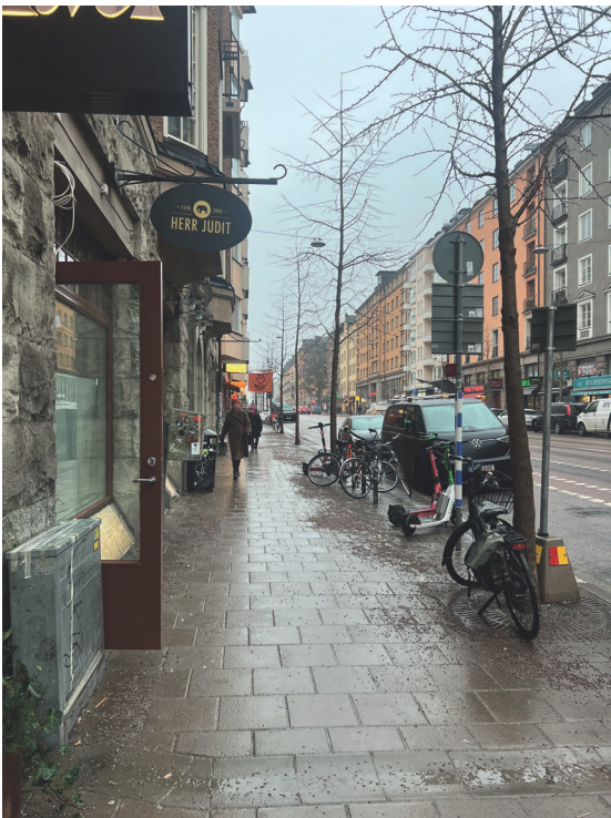
Dörren öppen mot gata. Elskåpet i förgrunden.

Vi menar att den lilla del av dörrbladet som inkräktar på gatumarken ej påverkar gångbanands funktion eller driften av den samma.