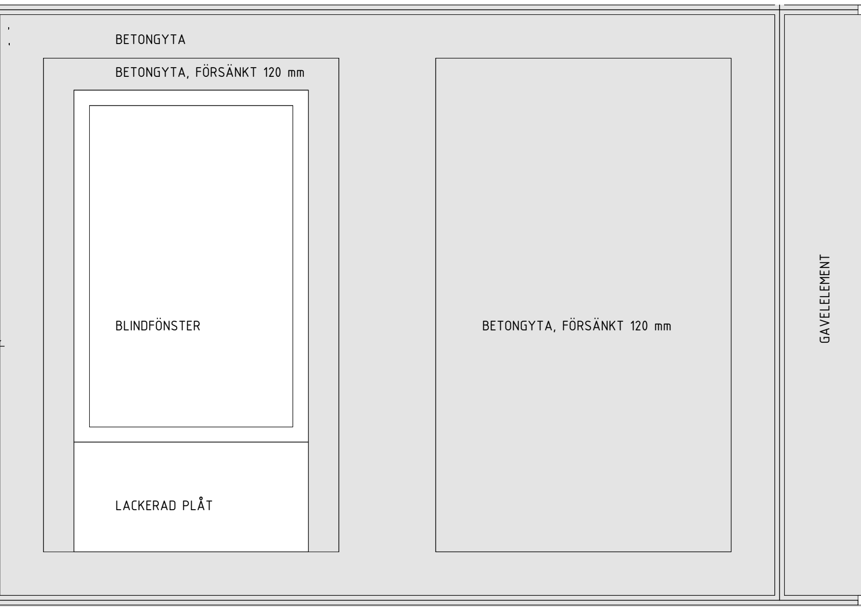
FASADELEMENT TYP C (SPV), MED BLINDFÖNSTER MOT ESSINGELEDEN