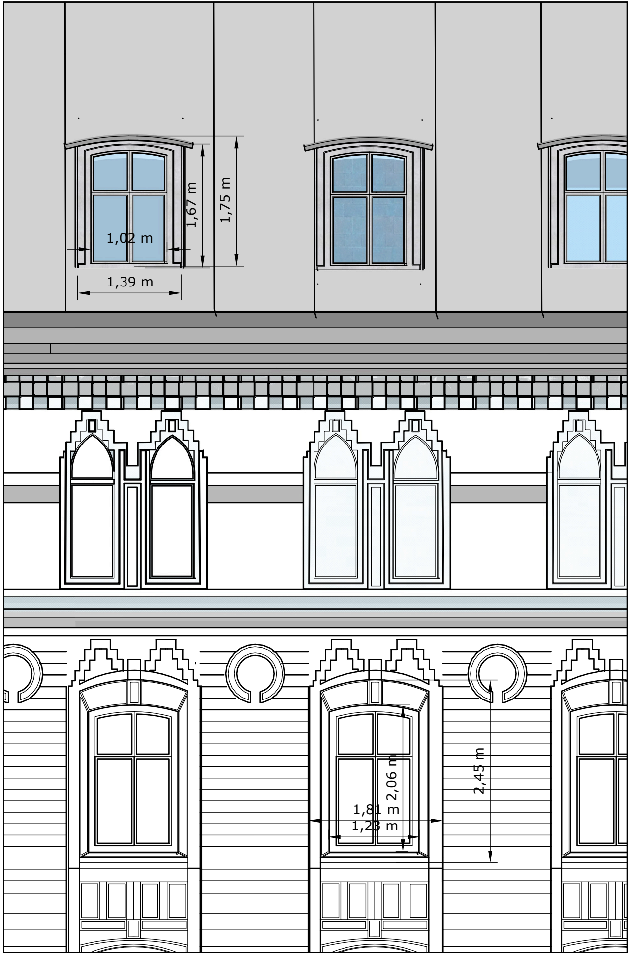
Proportionering mot dominerande fönster B/H = b/h