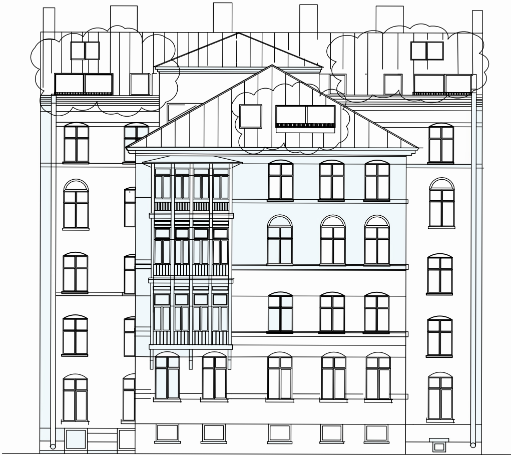
FASAD MOT GÅRD SYDOST