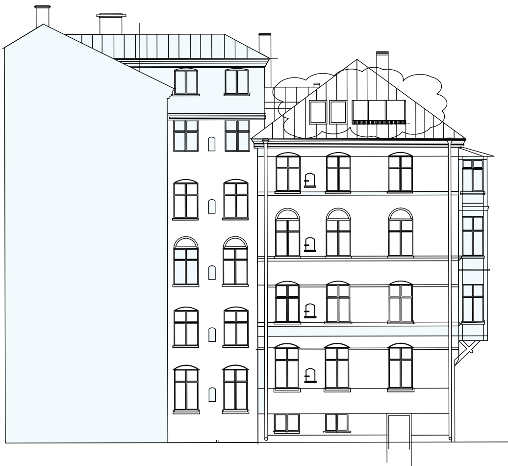
FASAD MOT GÅRD SYDVÄST