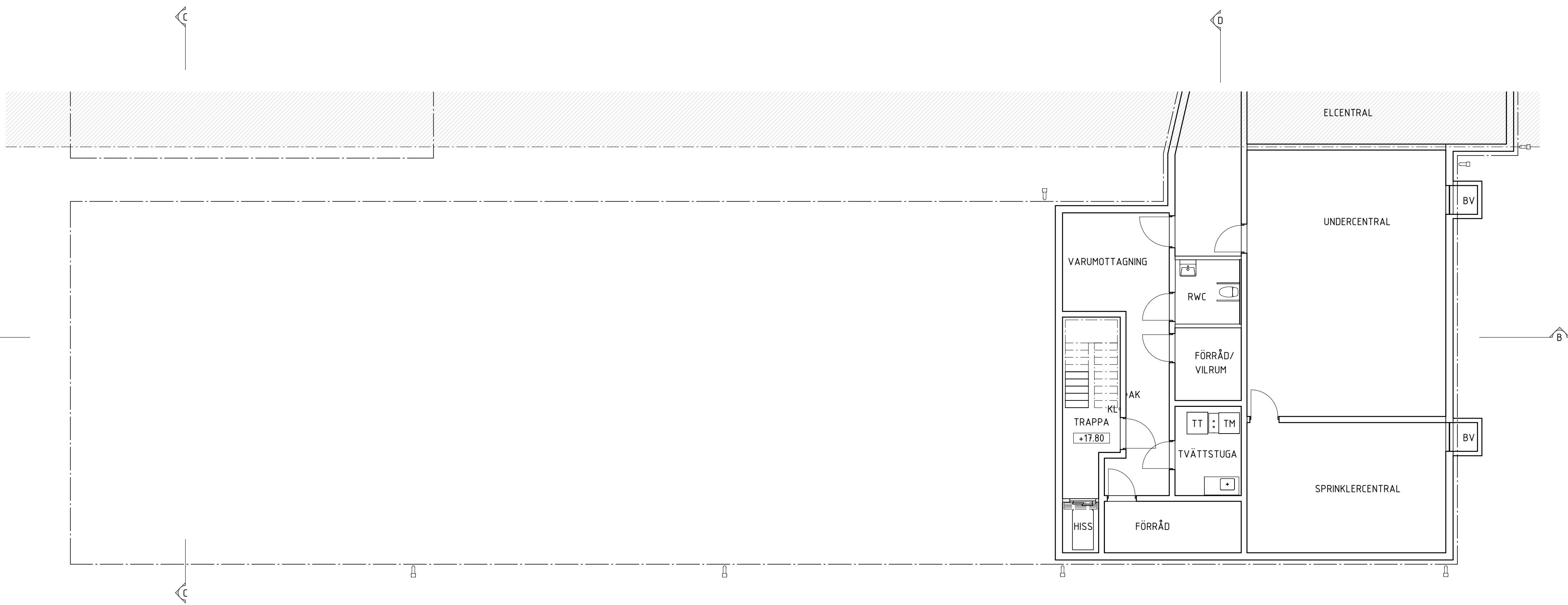
PLAN 09 - KÄLLARPLAN DEL 2(2)