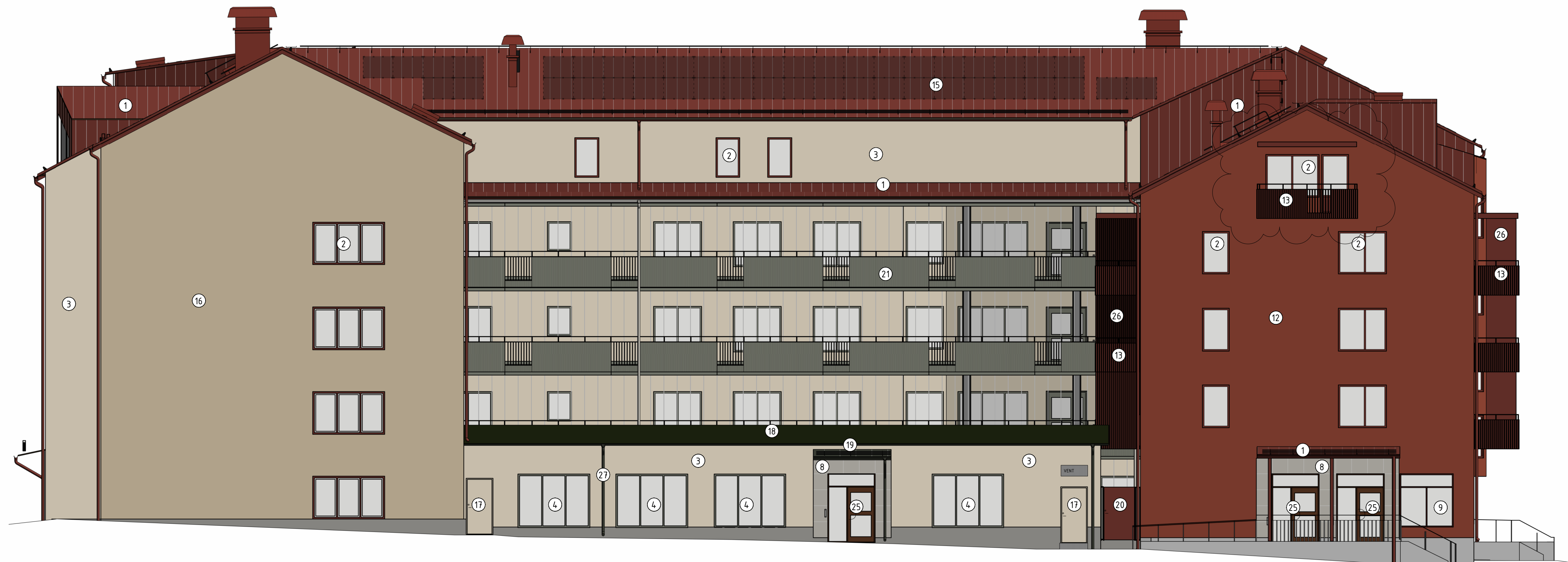
FASAD MOT NORDVÄST 1 : 100 (A1)