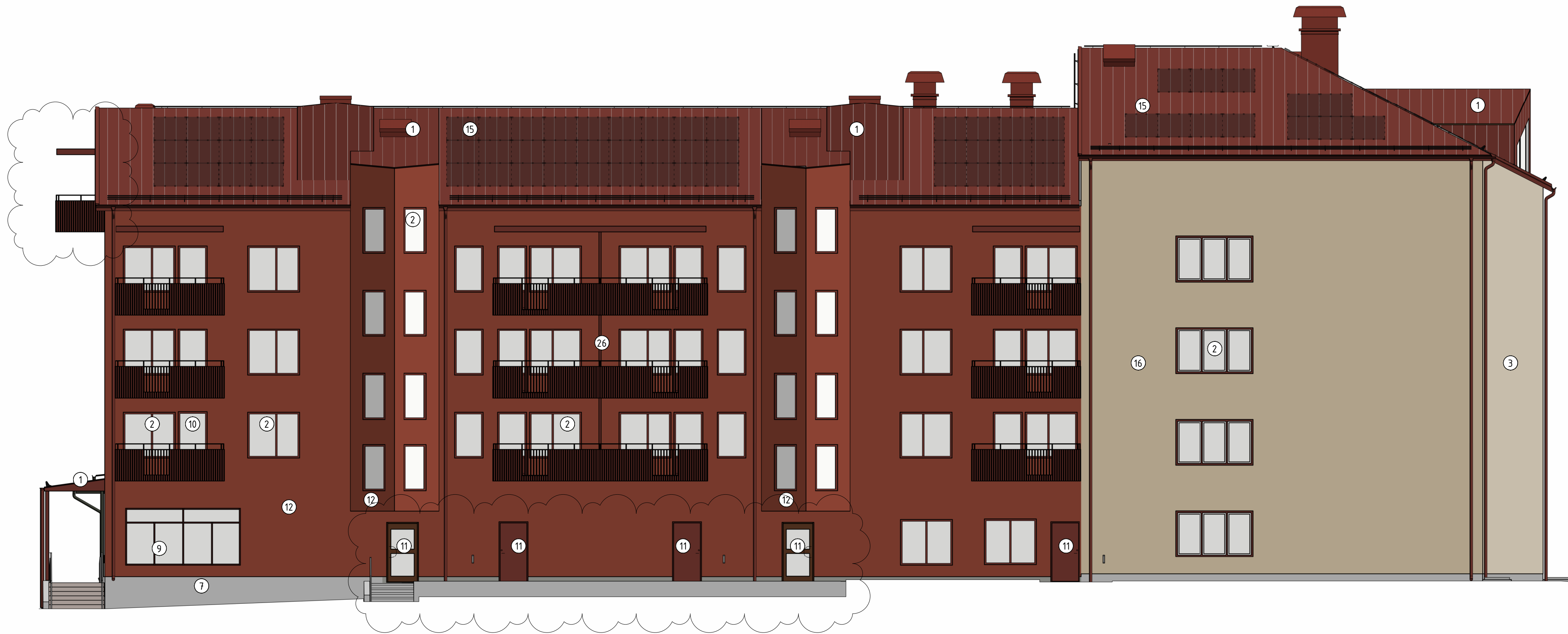
FASAD MOT SYDVÄST 1 : 100 (A1)