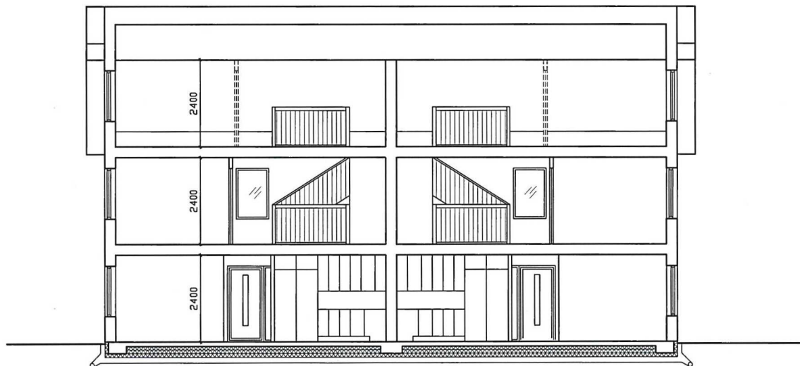
SEKTION B-B SKALA 1:100