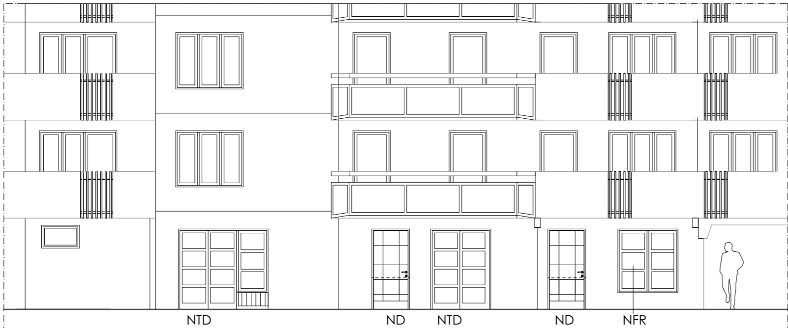
HUS 166 FASAD MOT GÅRD