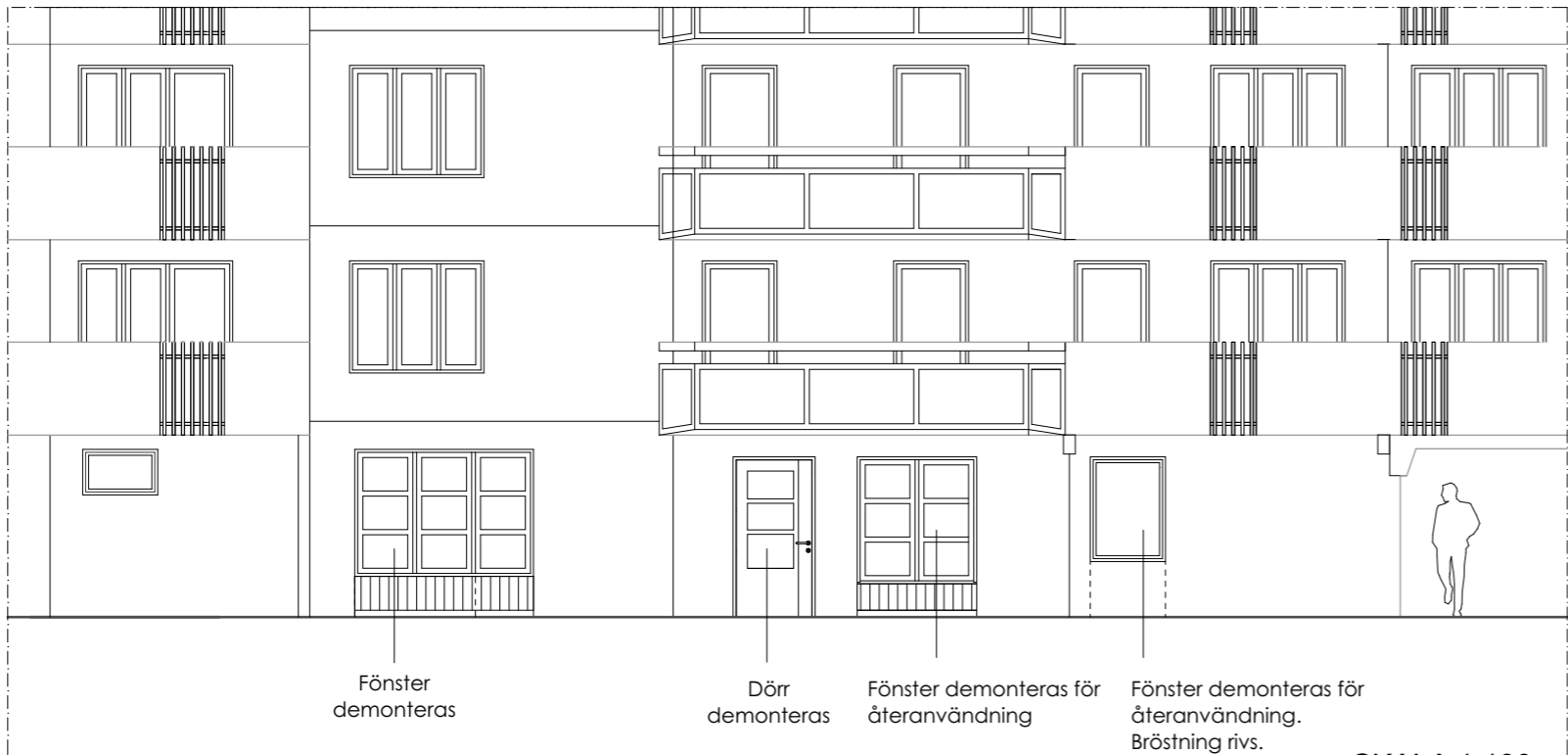
HUS 166 FASAD MOT GÅRD (RELATION)