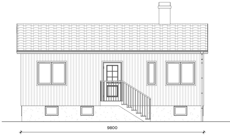
4 BEF. ÖST 1:100