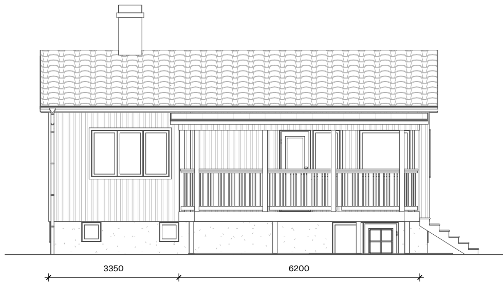
2 BEF. VÄST 1:100