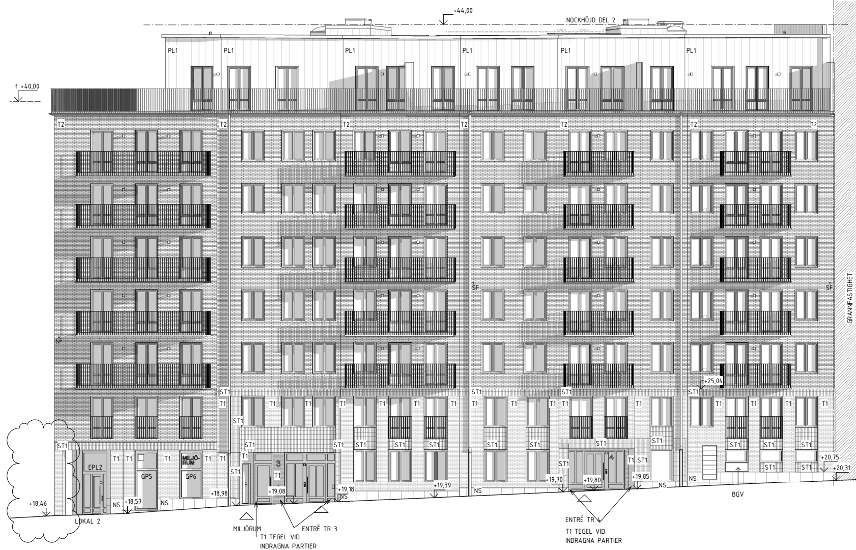
FASAD MOT EMLIESGATA