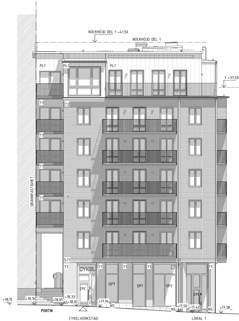
FASAD MOT BONDEGATAN