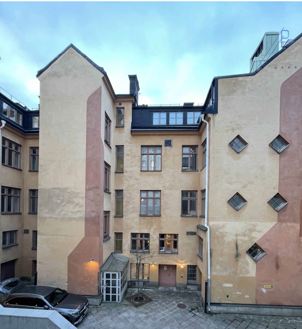
VY FRÅN TERRASS/ÖVRE GÅRD