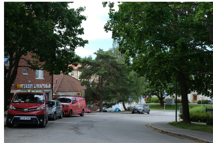
Bebyggelsen följer terrängen och området karaktäriseras av en stor mängd sparade träd, i bilden representerat av den knotiga tallen.