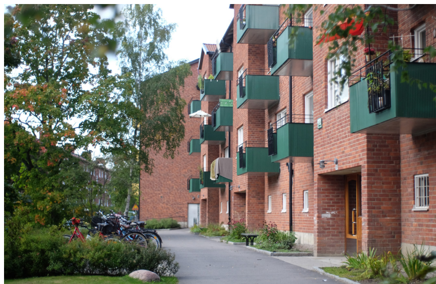
Välbevarad bebyggelse längs Bastuhagsvägen, med ursprungliga balkongfronter och hög grad av detaljering. Husen ligger indragna från gatan med grön förgårdsmark och är sammankopplade i långa band.

Förtätningsprojekten har ofta ambitionen att hålla nere byggkostnaderna för att lägenheterna ska kunna hålla rimliga hyror. Detta tas sig till uttryck i att byggnaderna ofta får fler våningar än den ursprungliga bebyggelsen, fasader putsade med cementbaserat bruk och en lägre grad av detaljering, samt underordnad markbehandling. I kombination med moderna byggnormer och krav som påverkar exempelvis husbredder och balkongstorlekar så upplevs förtätningsprojekten som mindre kvalitativa än områdets ursprungliga 1950-talsbebyggelse.