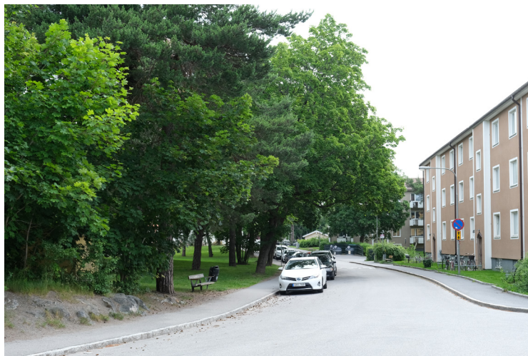
Planterade lönnar utgör karaktärsträd längs Bäckaskiftsvägen.