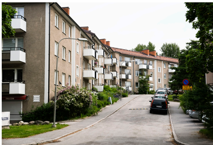
Lamellhusen håller samma trevåningsskala över hela stadsdelen.