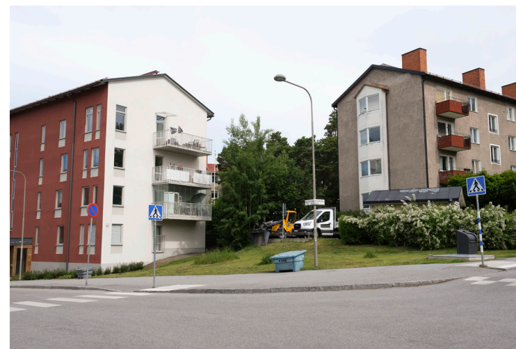
Möte mellan 1950-talets smalhus till höger och ett sentida utfört förtätningsprojekt till vänster. Notera skillnaden i våningsantal, tjocklek på byggnaderna, detaljeringsgrad, balkongstorlek och markbehandling i direkt anslutning till byggnaderna.