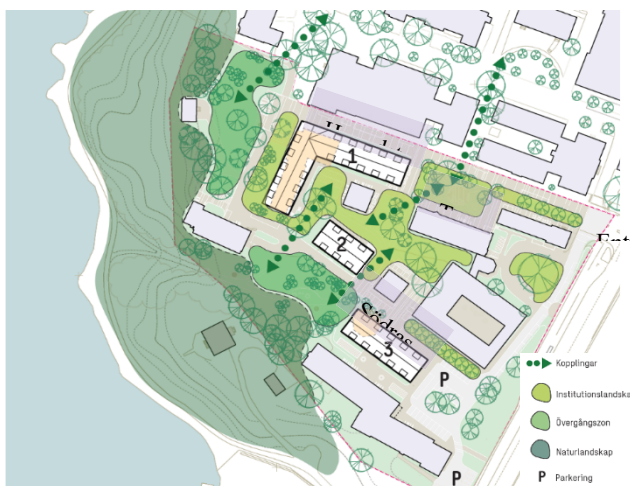
Figur 7 Illustration över gestaltungsforlagets koncept och huvuddrag.

Den arkitektoniske idén utgår från områdets karaktär av fritt placerade hus, anpassade till landskapet och topografin. Den ska stärka de befintliga riktningar, stråk, entréer och parkrum som identifierats i strukturen. De parkeringsytor som idag splittrar strukturen omvandlas till byggrätter och parkmiljöer. I nordväst och söder skapas nya sammanhängande parkrum mot vattnet. De nya byggnaderna inordnar sig i och kompletterar den befintliga bebyggelsestrukturen. De anpassas till terrängen, befintliga stigar, vägar och värdefulla träd. De bidrar med en ny avläsbar årsring i institutionsmiljön. Gestaltning samspelar med uttrycket och materialiteten i den karaktäristiska tegelarkitekturen från olika tidsepoker, som återfinns i området som helhet.