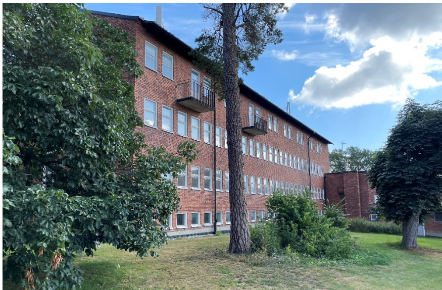
Figur 4 Exempel på funktionalistisk byggnad från planområdet i södra Kräftriket.

Inom södra Kräftriket har bebyggelsen uppförts succesivt från och med 1940-talet och placerats fritt i landskapet. Kring bebyggelsen har miljön en parkkaraktär med klippta gräsytor och mindre grupper av äldre ädellövträd och barrträd. Byggnaderna saknar tydlig koppling till varandra, bland annat på grund av parkeringsytorna som infogats mellan husen.