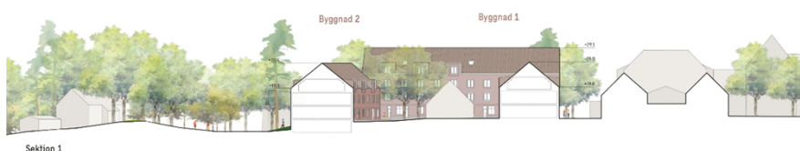
Figur 10 Planförslag inför godkännande.

Sektion A-A' genom byggnad 2 och 1. Del av byggnad 1 mot huvudstråket är i tre våningar med inredd vind. Taken föreslås vara i ljus plåt. Bild: Sweco