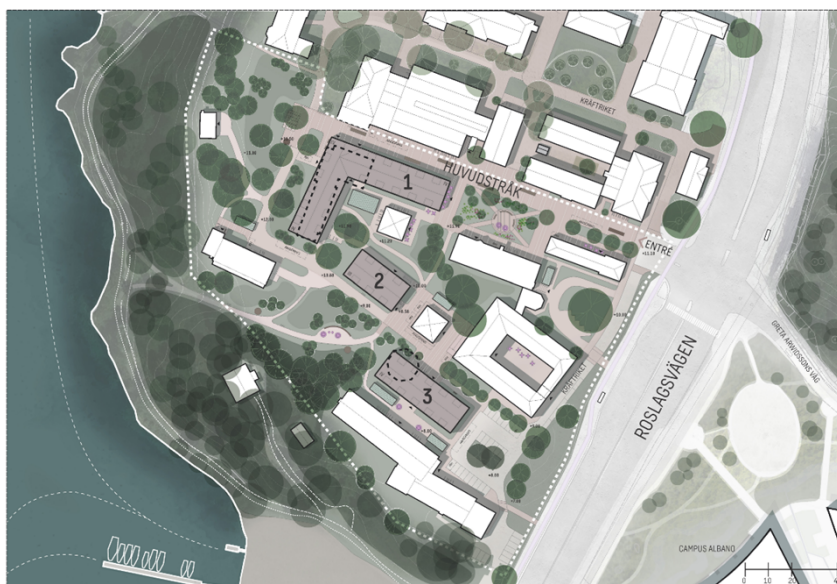
Figur 6. Illustration som visar den nya bebyggelsen: hus 1, 2, 3 samt det förtydligade huvudstråket med sin entréplats mot Roslagsvägen och den nya torgytan. I söder och väster föreslås nya parkmiljöer på befintliga parkeringsytor. Streckade ytor visar byggnader som föreslås rivas, Hundstallet (1) och Hästergometern (3).

Hela planområdet ligger inom Kungliga nationalstadsparken och omfattas av föreskrifter för anmälan om samråd enligt 12:6§ miljöbalken. Planförslaget har utformats utifrån till gällande riktlinjer för nationalstadsparken.