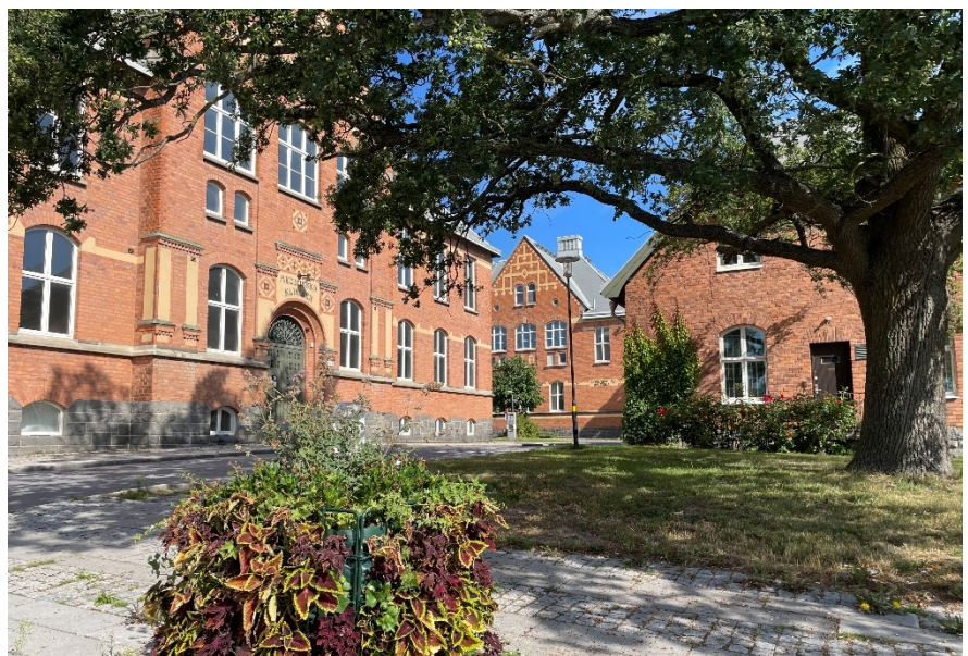
Figur 3. Exempel på Veterinärhögskolans bebyggelsemiljö från 1910-talet i norra Kräftriket.

Planområdet utgör den södra delen av Kräftriket. Kräftriket är en sammanhängande institutionsmiljö som uppförts för veterinärhögskolans verksamhet. Kräftriket utgörs av ett kuperat höjdparti som reser sig från Brunnsviken och dalar ut mot Roslagsvägen. Norra Kräftriket har en rätvinklig planstruktur med byggnader från 1912 i nationalromantisk stil.