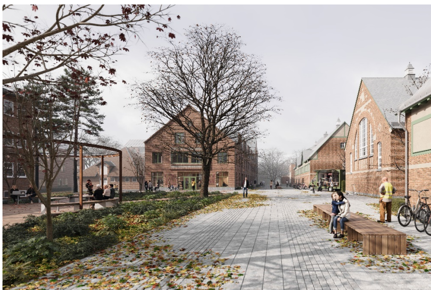
Figur 8 Visionsbild, vy från områdets huvudstråk mot torget och byggnad 1. Bild: Sweco