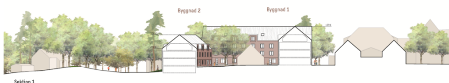
Figur 9 Granskningsförslag.

Med anledning av de synpunkter som framförts under granskningen föreslår stadsbyggnadskontoret att planförslaget justeras gällande hantering av trafikbuller, skyddsvärda träd, utformning av tak på ny bebyggelse samt höjd på del av byggnad 1. Planhandlingarna har reviderats avseende det ovan nämnda. I övrigt har planhandlingarna korrigerats från formaliafel och mindre redaktionella ändringar har gjorts. Kontorets bedömning är att ändringarna är små och inte kräver att planförslaget behöver granskas på nytt.