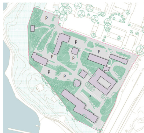
Figur 5. Illustration som redovisar den befintliga strukturen, med stora parkeringsytor infogade mellan byggnaderna.