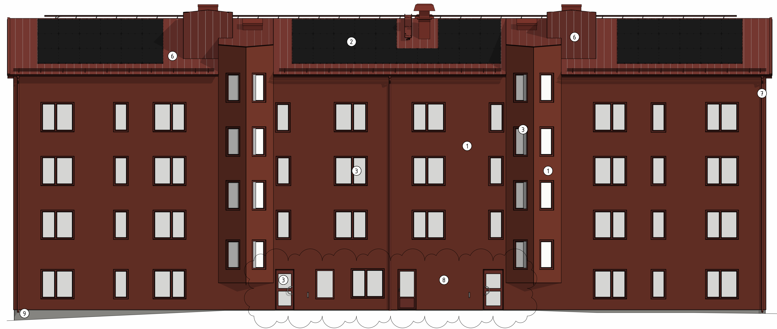
FASAD MOT NORR 1 : 100 (A1)