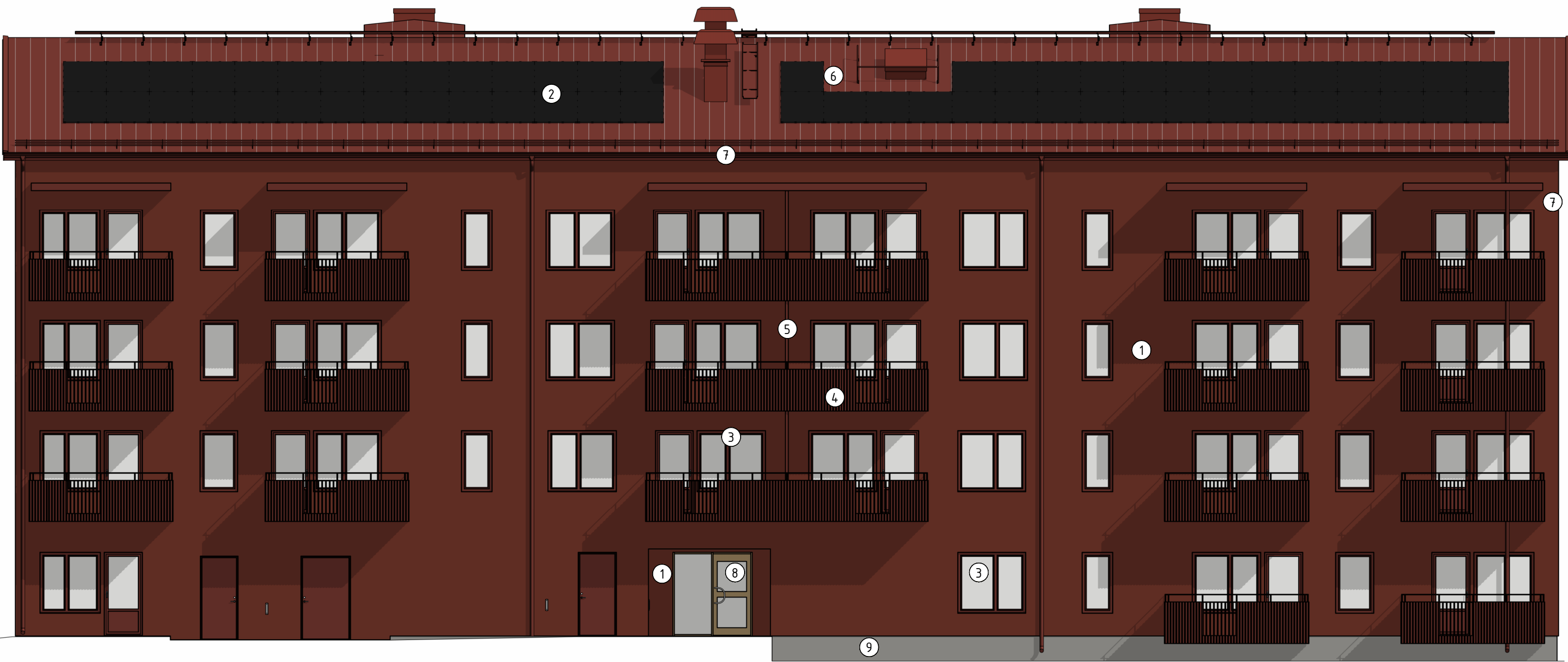
FASAD MOT SÖDER 1 : 100 (A1)