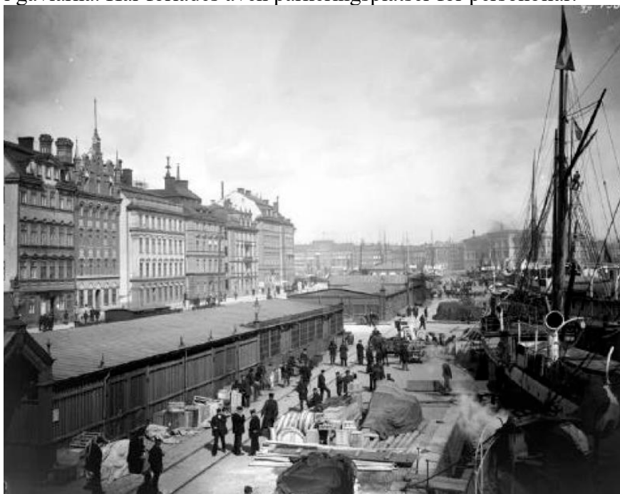
Det fanns tullhus utmed skeppsbron redan på slutet av 1800-talet. De var placerade i ungefär samma lägen som idag.