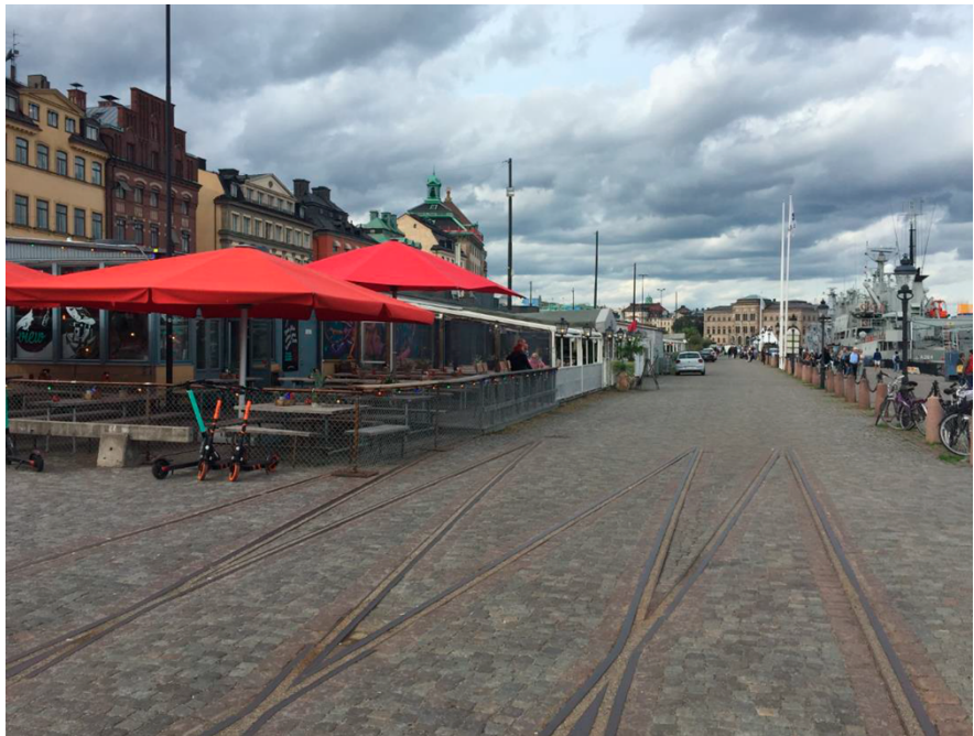
Spår från tidigare järnväg längs kajen.

Byggnaderna var mycket funktionellt utformade för att inrymma tullverksamhet. Här fanns visitationslokaler med speciella kroppsvisitationsrum, vänthallar, tullexpedition, tulltaxeringslokal, utlämningshallar och rum för passpolis. Även personalrum med wc, sovrum och omklädningsrum fanns. Planlösningarna var relativt lika uppbyggda och de flesta av funktionerna fanns i samtliga byggnader. Det har hittats en notering om att packhuskarlar, kranmaskinister och passpolis hade sitt huvudsakliga arbete i mellersta byggnaden. Till följd av andra världskrigets utbrott kom användningsområdena att bli delvis annorlunda än planerat. Till exempel användes tullhus 2 som lagerlokal för fartygsdelar, inredningsdetaljer och nautiska instrument.