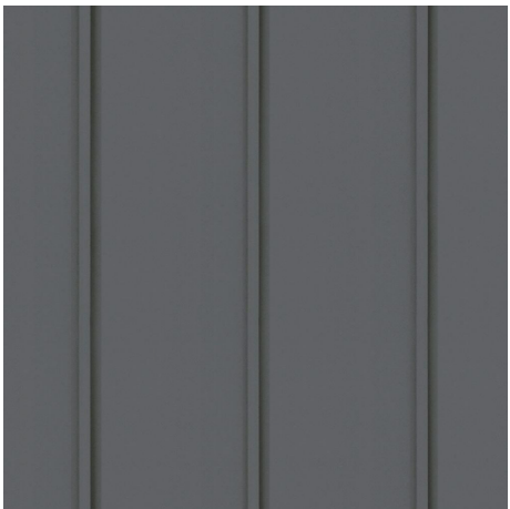
Tak Bandtäckt plåt mörkgrå

*Alla kulörer kommer att verifieras genom ett fysiskt prov på plats för godkännande av bygglovshandläggare samt byggherre och arkitekt.