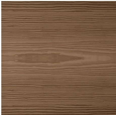
Sockel Träpartier i bottenvåning