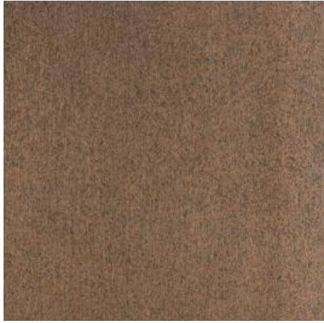
Sockel Plåt mot mark under träpartier