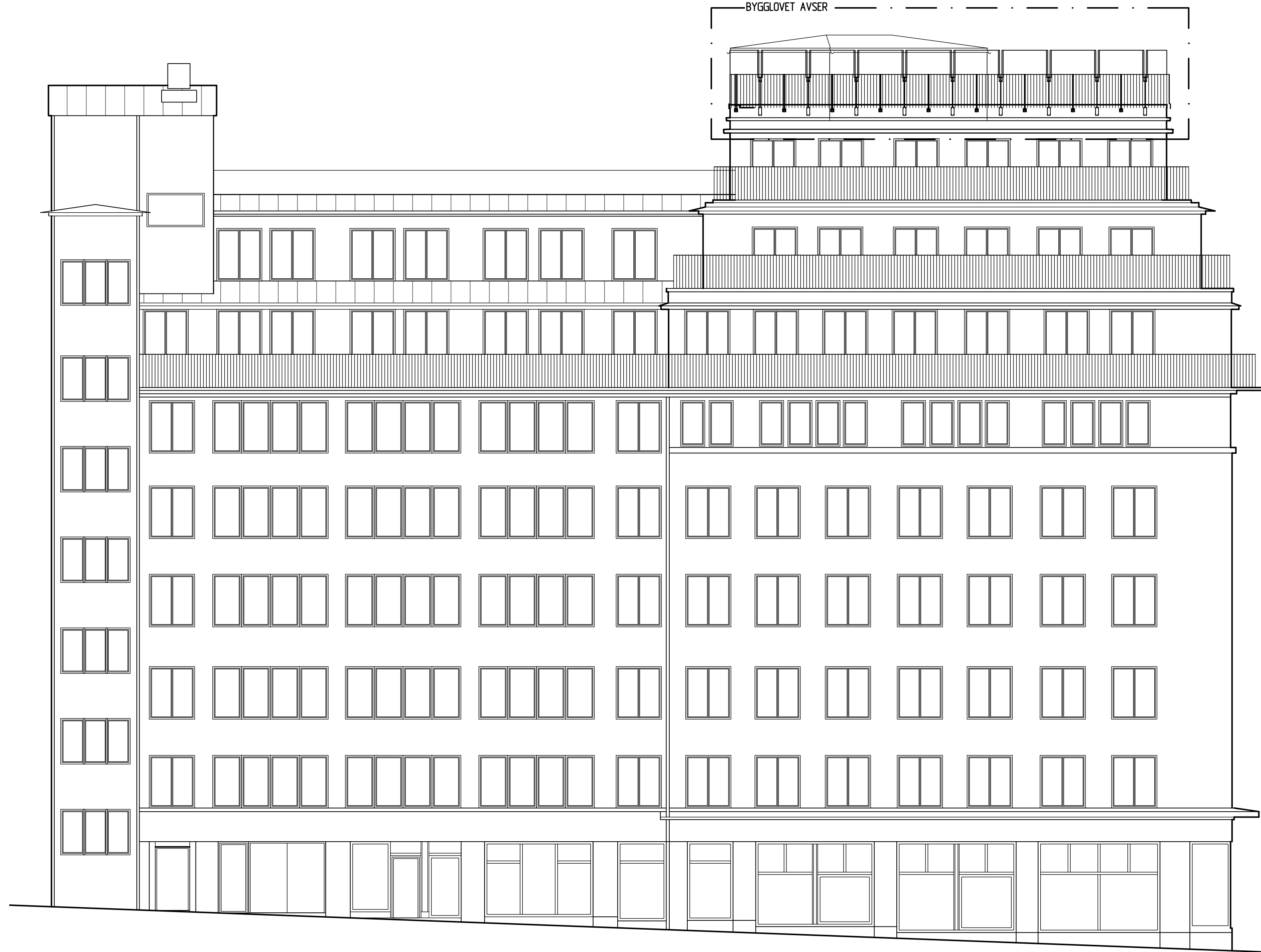
FASAD MOT TEATERGATAN