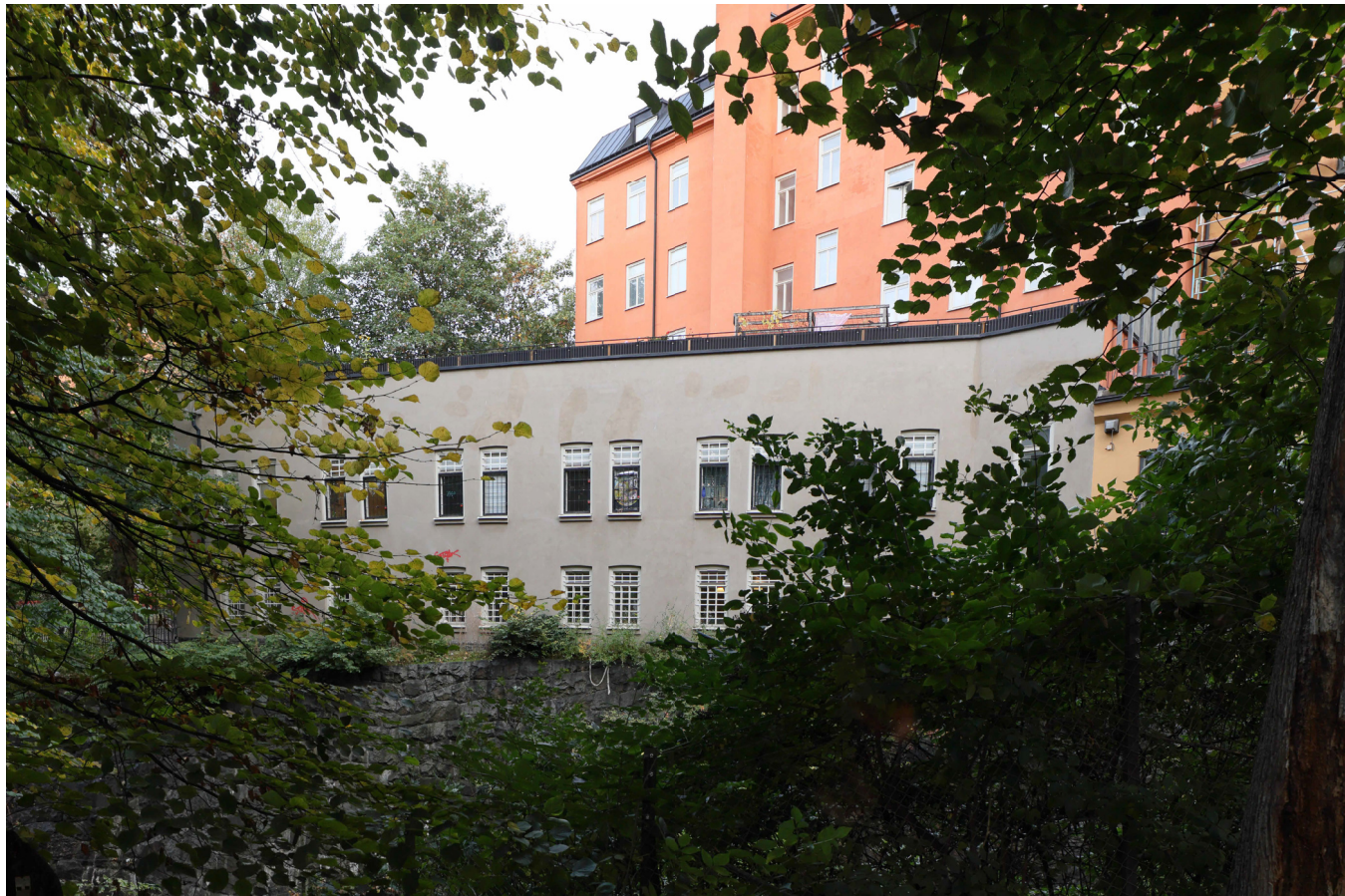
BEFINTLIGT UTSEENDE PÅ SYDVÄSTRA FASADEN SETT FRÅN MOTSTÅENDE SIDA AV JÄRNVÄGSGRAVEN