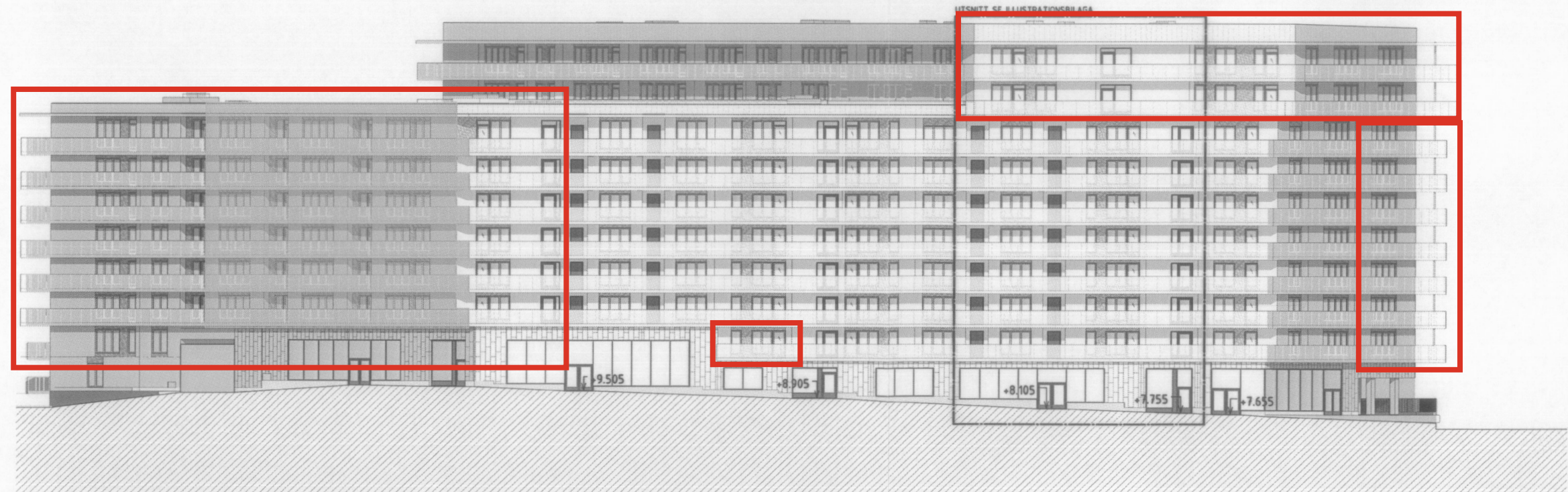
FASAD MOT ÖST MOT LILJEHOLMSVÄGEN

Ansökan gäller samtliga balkonger inom markerat område (EJ loftgångar). Balkongerna glasas in i linje med ovanliggande balkongplatta/tak.