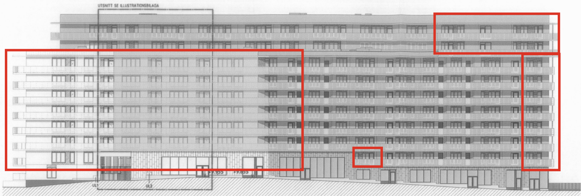
FASAD MOT SYDÖST MOT LILJEHOLMSTORGET