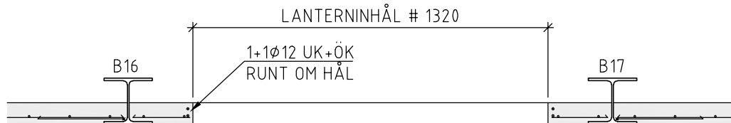
SNITT B-B 1:20