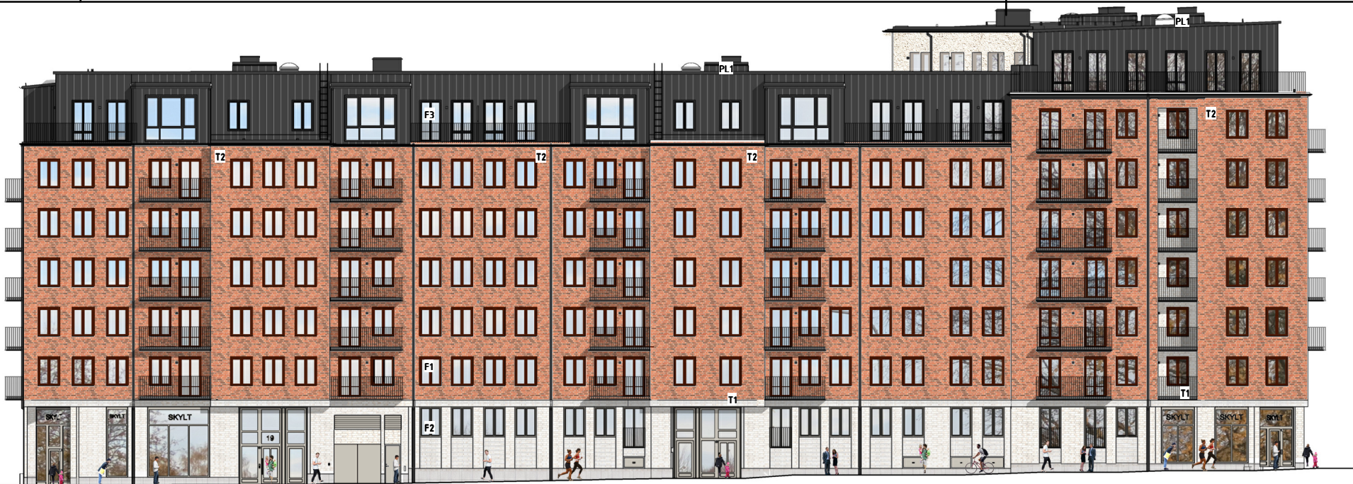
FASAD MOT BARNÄNGSGATAN