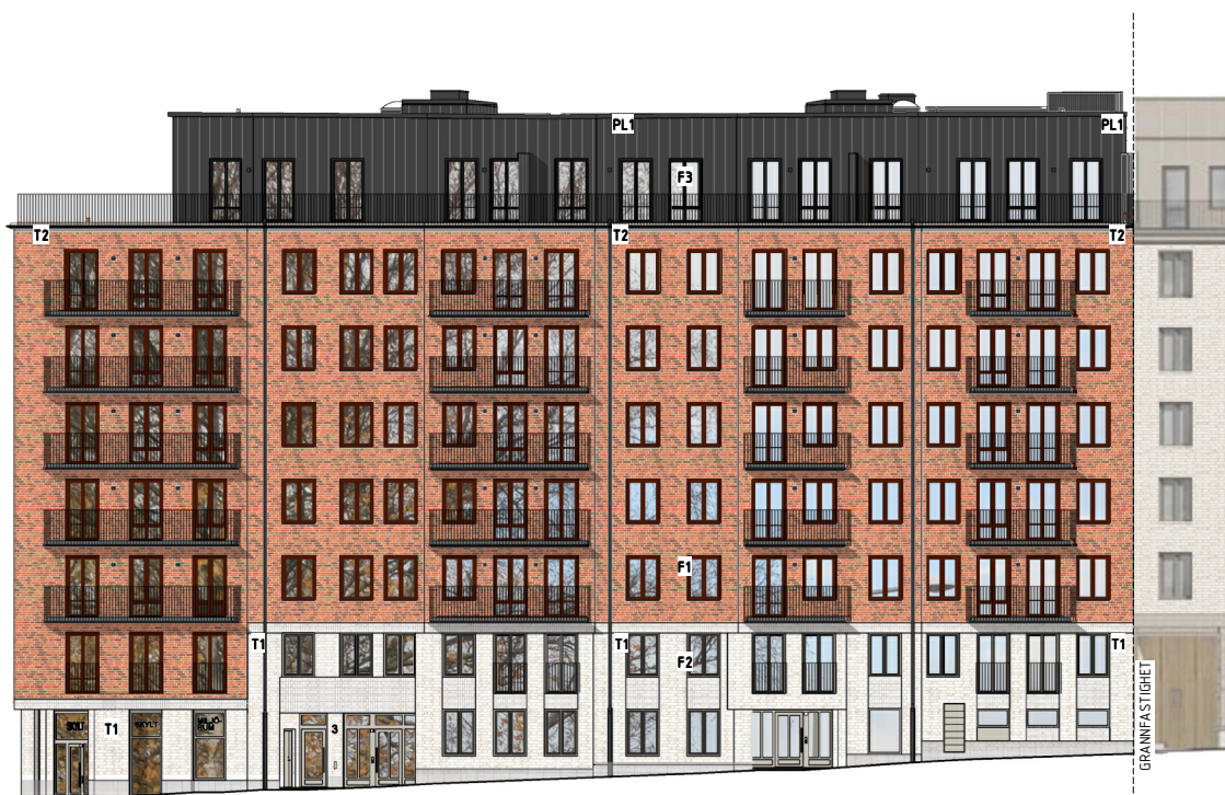
FASAD MOT ERELIES GATA