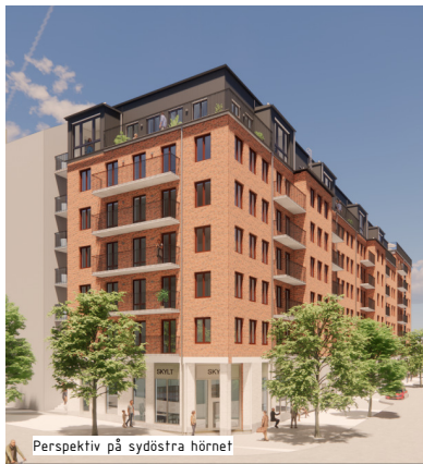
Perspektiv på sydöstra hörnet