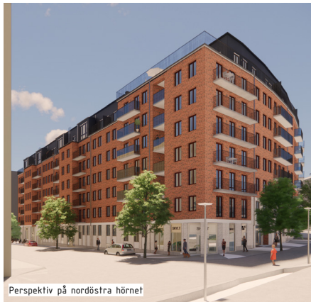
Perspektiv på nordöstra hörnet