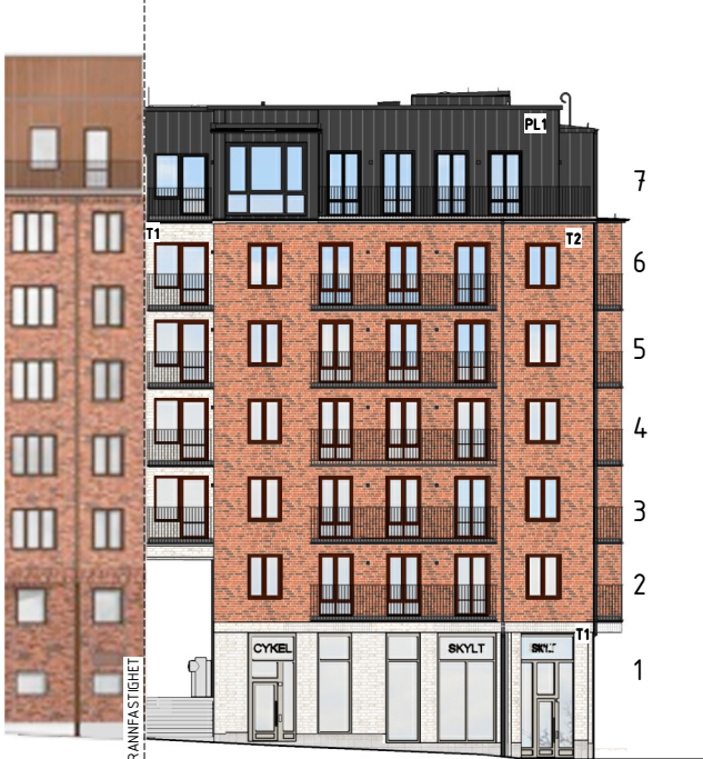
FASAD MOT BONDEGATAN