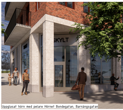
Uppglasat hörn med pelare Hörnet Bondegatan, Barnängsgatan