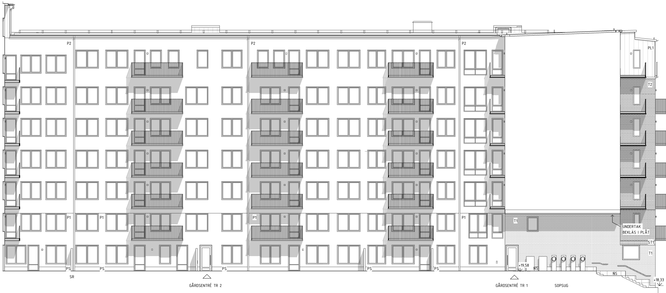
GÅRDSFASAD MOT VÄST