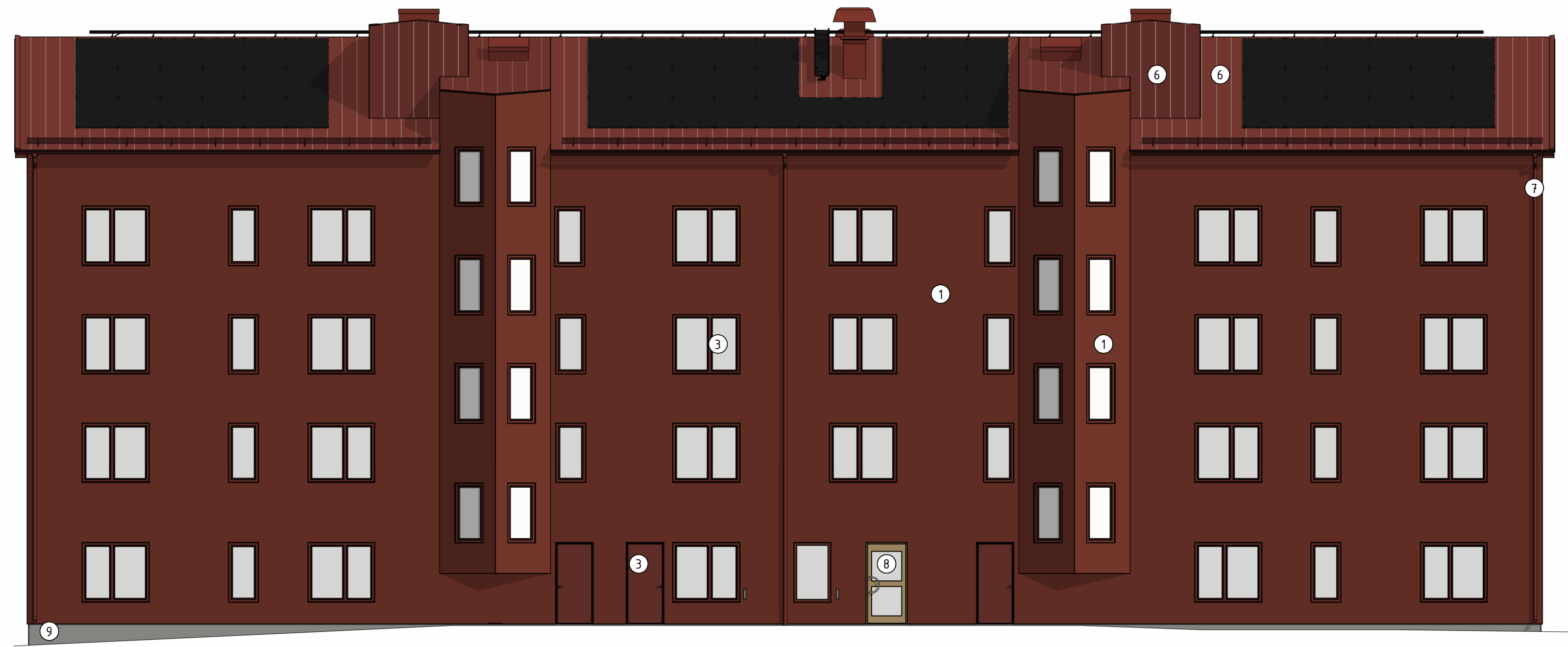
FASAD MOT NORR 1 : 100 (A1)