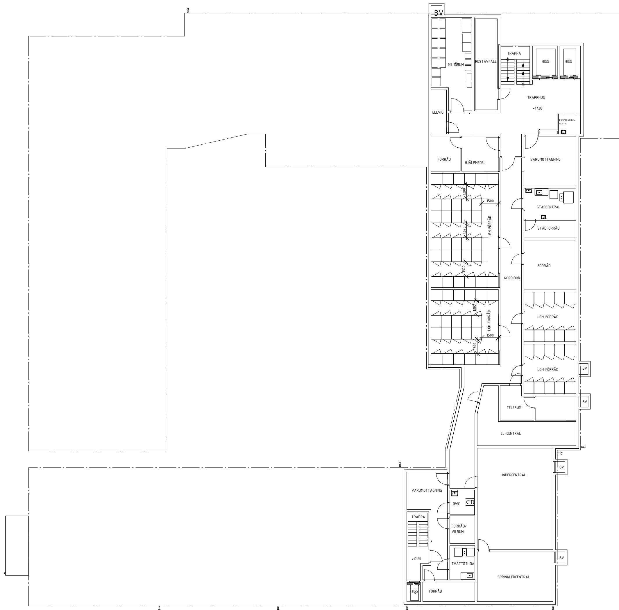
PLAN 09 - KÄLLARPLAN 1 : 200 (A1)