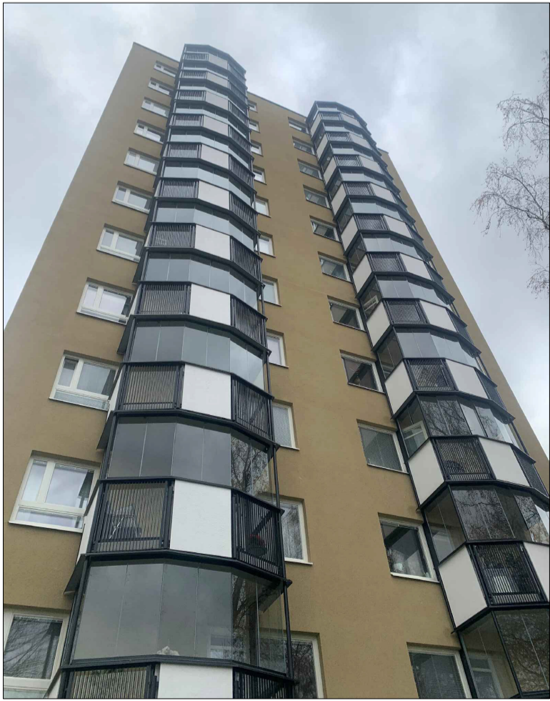
Platsbilder: Fasad syd

Koordinatuppgifter i plan levereras i Sweref 99 18 00.