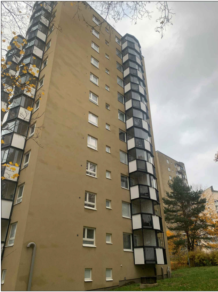
Platsbilder: Fasad öst