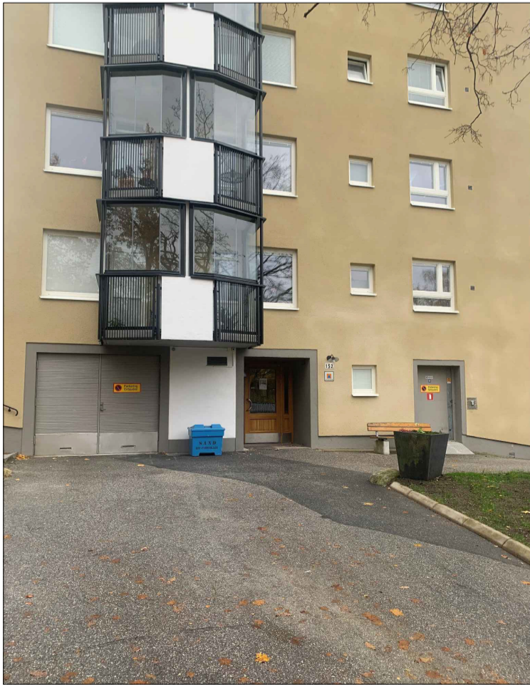
Platsbilder: Fasadutsnitt väst / Jämtlandsg 152