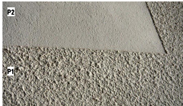
Olika kulörer och grovhet i puts