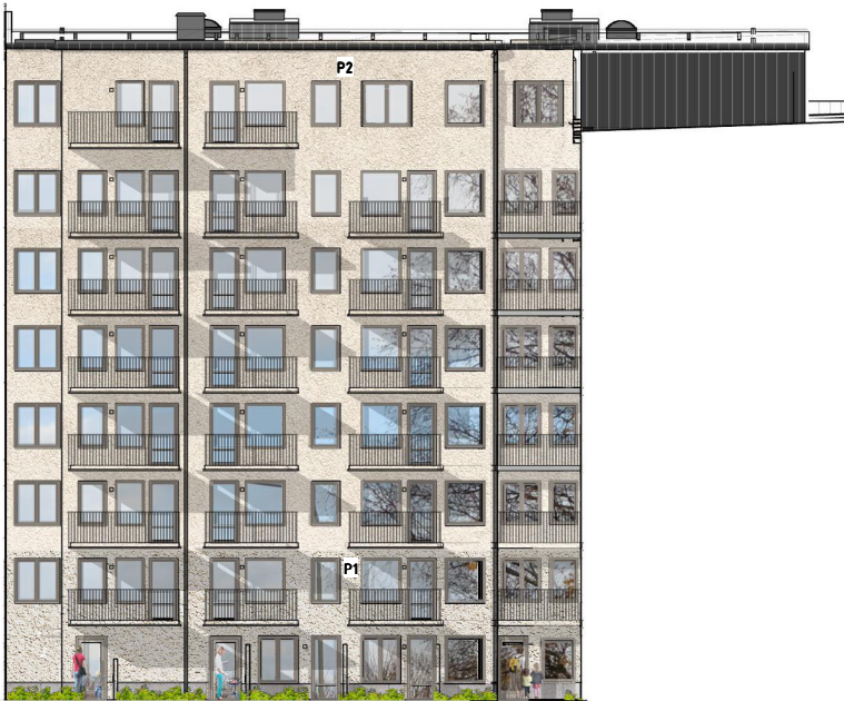
FASAD MOT SYD