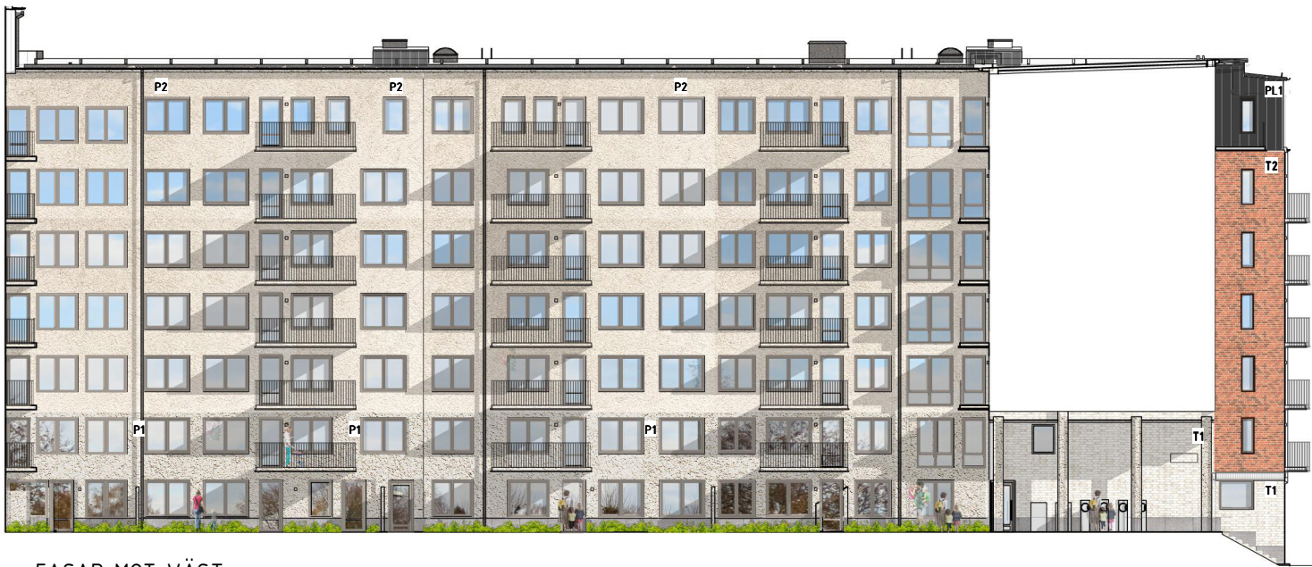
FASAD MOT VÄST