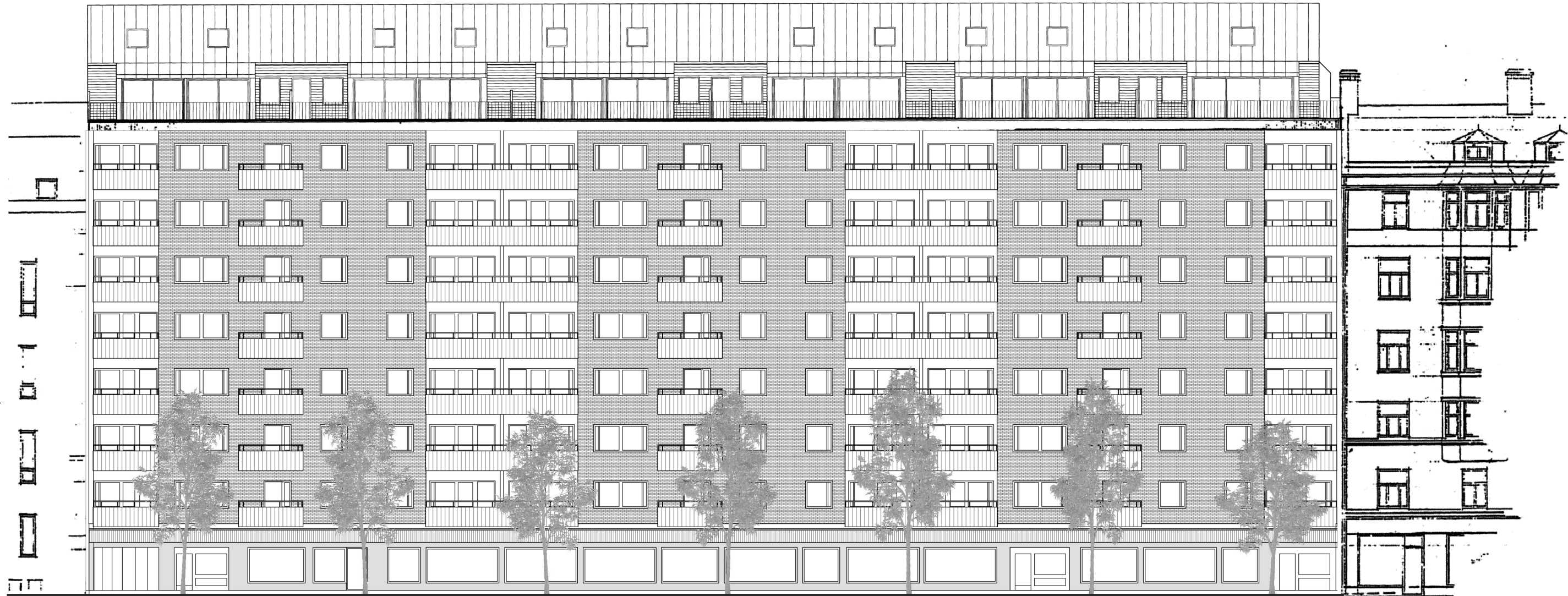
Fasad mot Roslagsgatan

(Bef.) Rad A (Bef.) Rad B (Bef.) Rad C (Bef.)