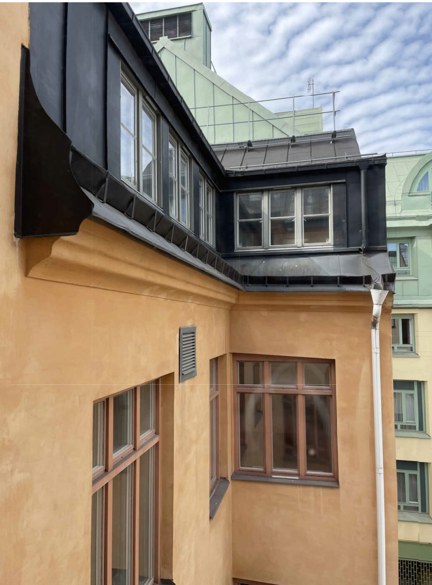
PLAN 4-5, TAKFOT MED TAKFOTSGESIMS GALLER I FASAD

UTVÄNDIG KULÖR- & MATERIALBESKRIVNING SE FASADRITNING A-40-3-01