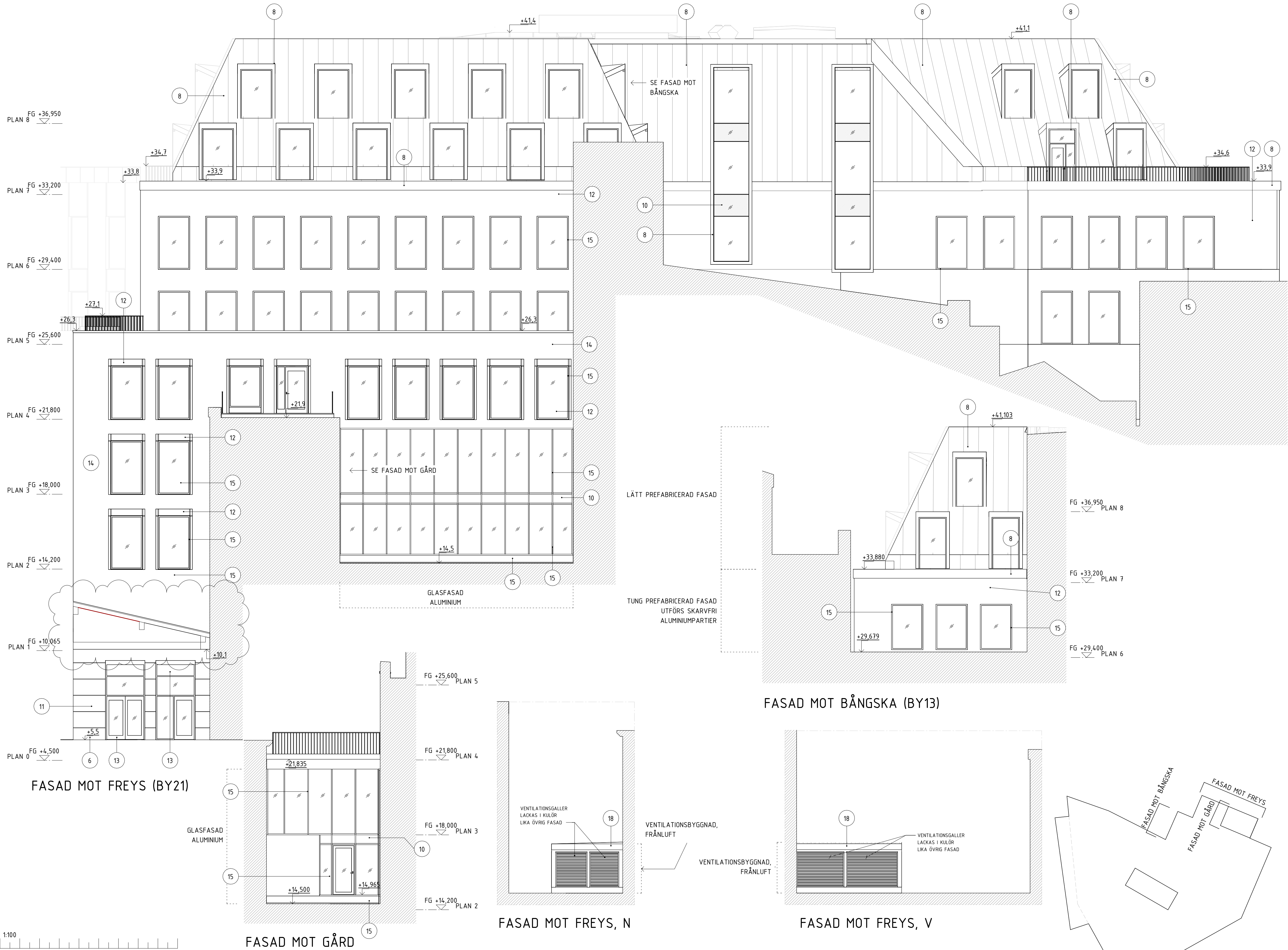
FASAD MOT BÅNGSKA (BY13)

DOKUMENTNUMMER: 52-A-40-3-0002 SKALA: A1=1:100 A3=1:200 ANDRING: D