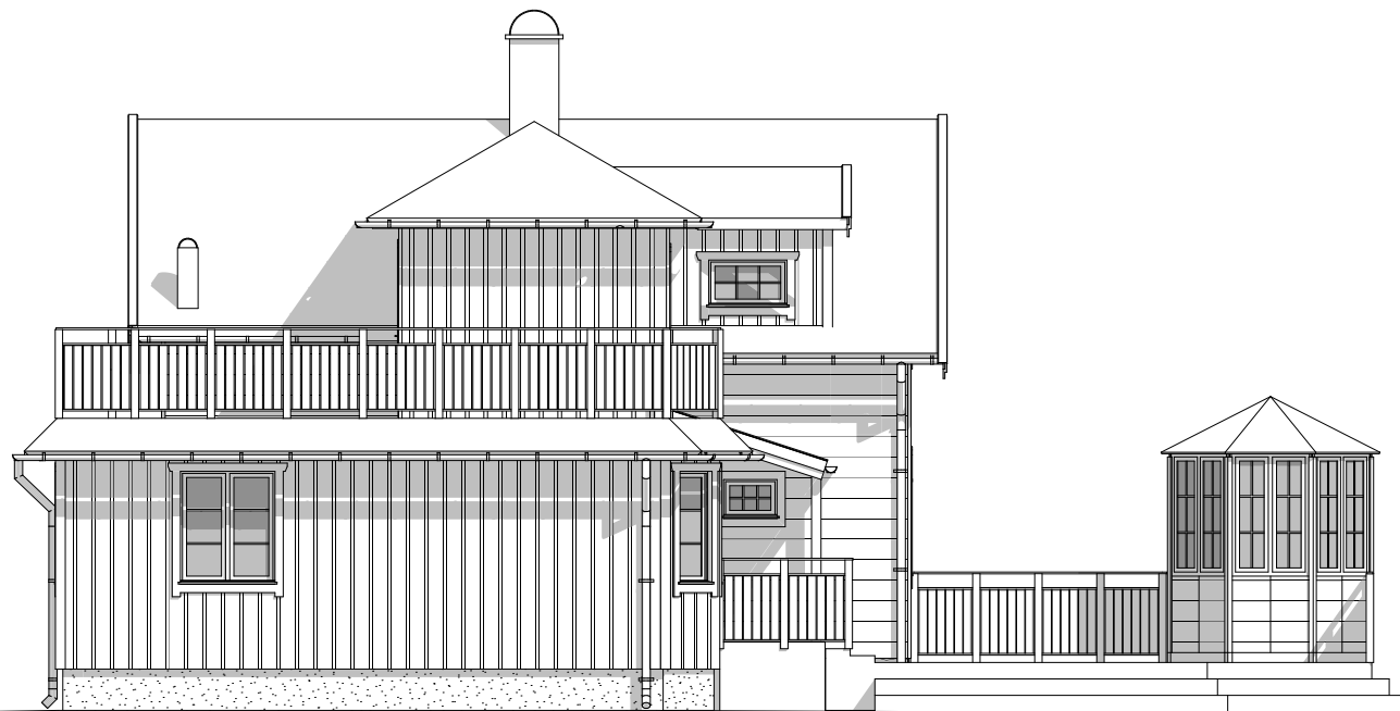
FASAD MOT NORR 1:100