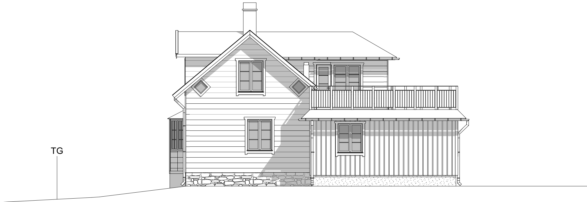
FASAD MOT ÖSTER 1:100