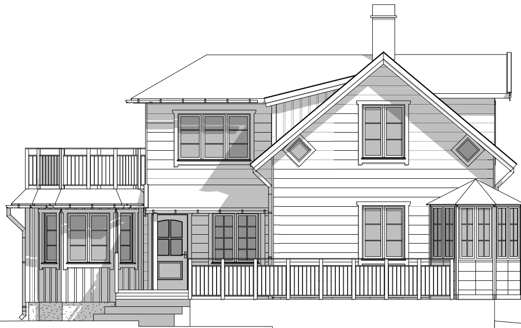
FASAD MOT VÄSTER 1:100