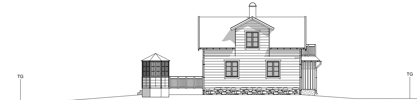
FASAD MOT SÖDER 1:200