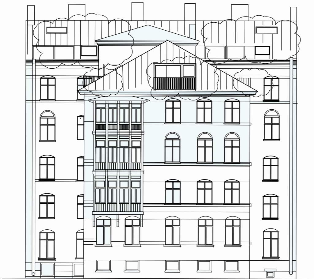
FASAD MOT GÅRD SYDOST