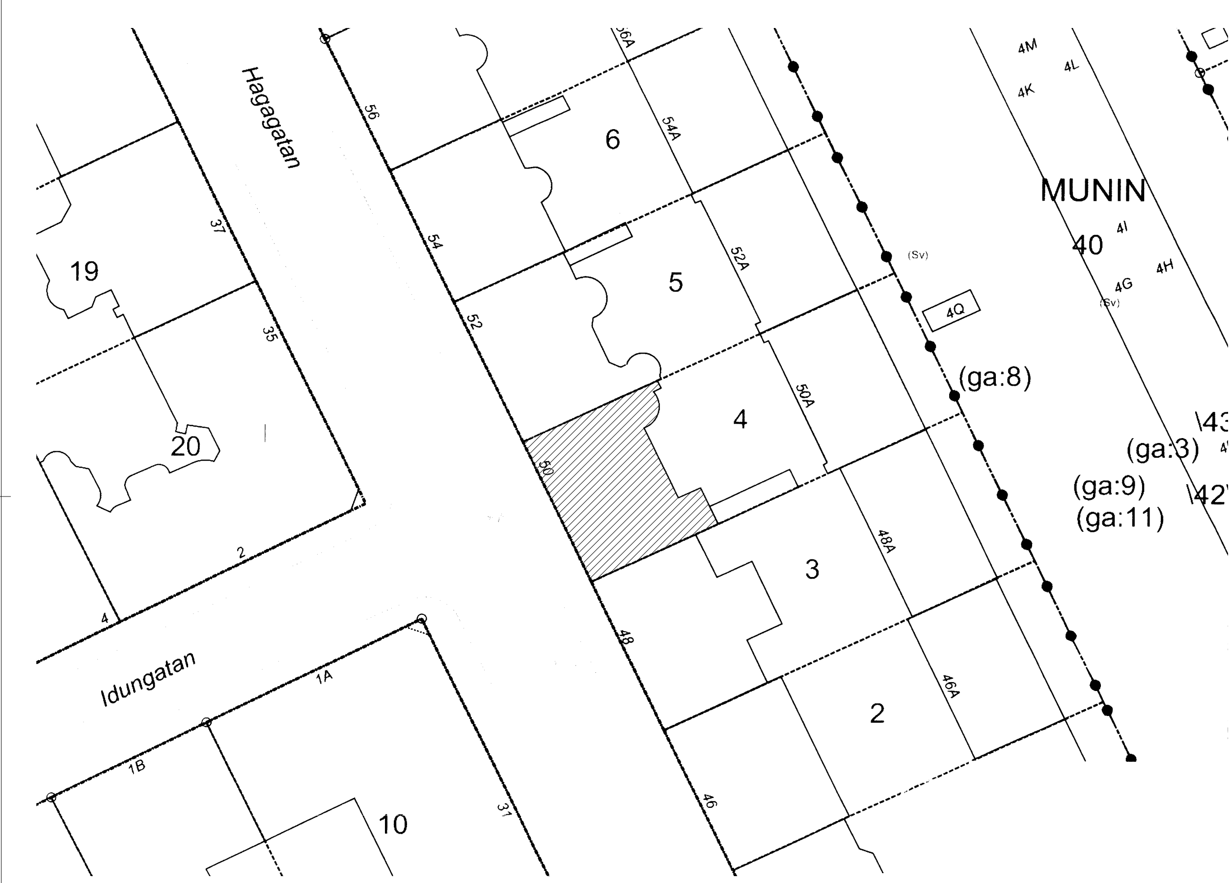
SITUATIONSPLAN SKALA 1:400 (A3)