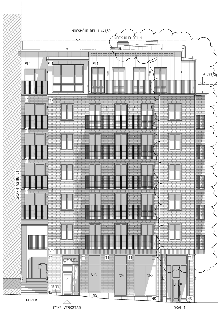
FASAD MOT BONDEGATAN