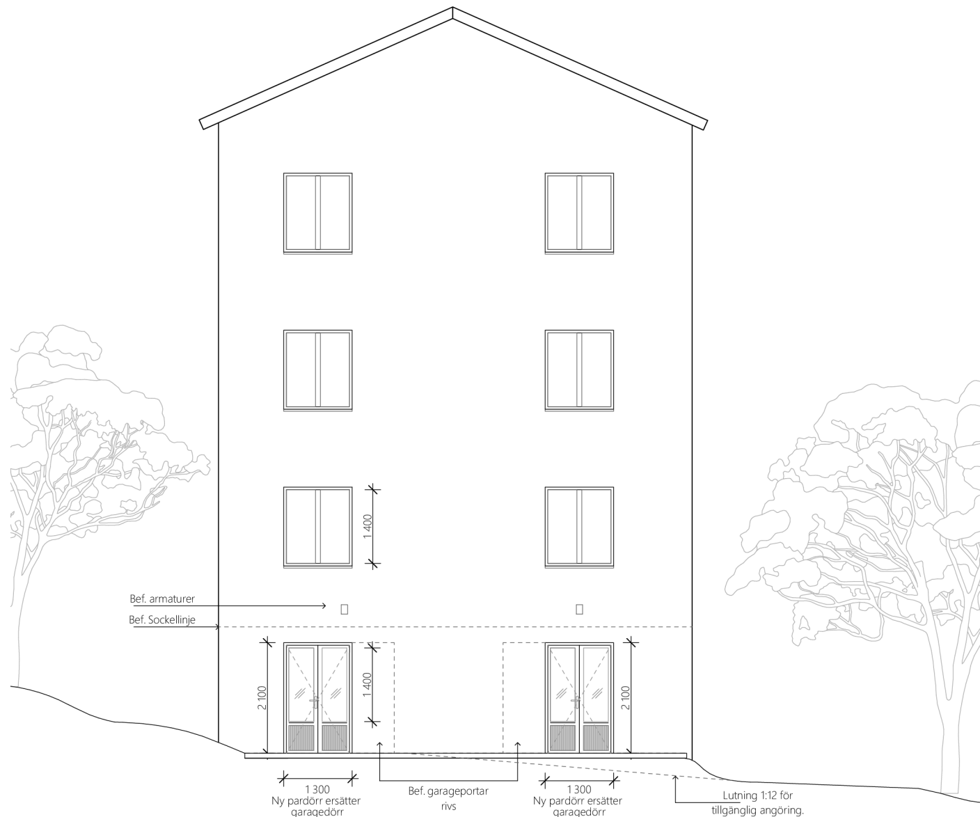
FASAD MOT NORDOST