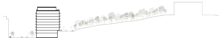
Sektion genom Västra Terrasskvarteret och Hjorthagsberget (t h) med äldre bebyggelse. (Illustration: CF Møller Architects)

Stads- och landskapsbilden bedöms påverkas positivt genom att platsen får ett mer ordnat och gestaltat uttryck i gränsen mot Hjorthagsberget. De solitära huskropparna skapar kontakt mellan berget och den kommande bebyggelsen i Kolkajen samtidigt som möjligheten till utblickar över landskapet och vattnet bibehålls. Nivåskillnaden på platsen, som idag tas upp genom en stödmur av betong, kläs in av föreslagen bebyggelse och park.