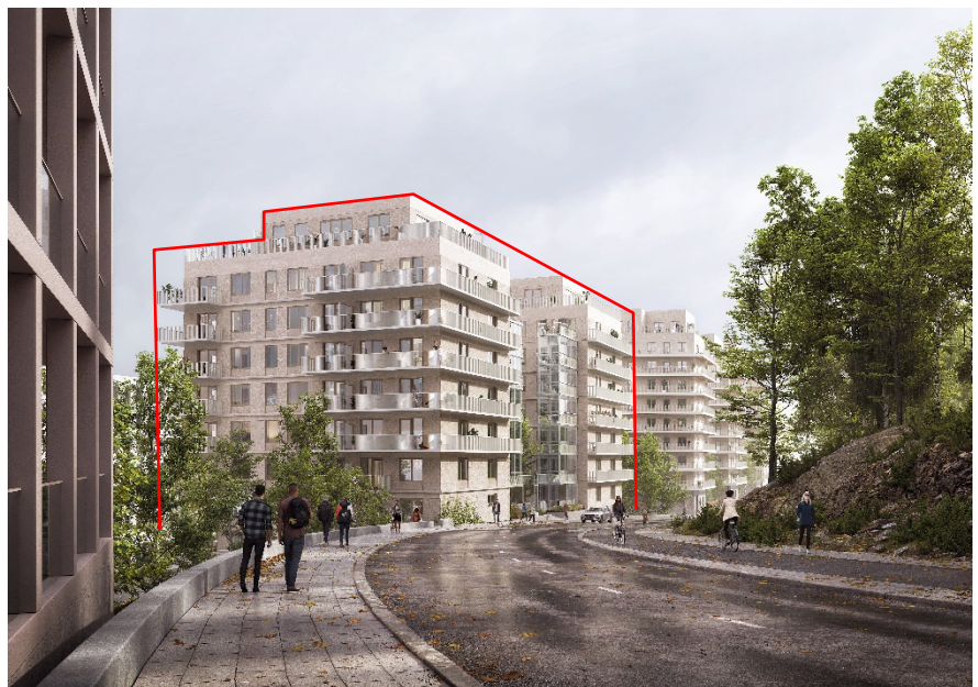
Vy från Gasverksvägen österut. Detaljplanen omfattar de två byggnader som markerats med rött. Närmast till vänster en av de planerade nya byggnaderna inom Gasverket Östra. Bild: CF Möller Architects

Terrasskvarteren utgörs av en grupp byggnader (varav detta tjänsteutlåtande behandlar den västra delen med de två byggnaderna närmast gasverket) på en smal markremsa med stor nivåskillnad mellan Bobergsgatan och Gasverksvägen. De bildar en övergång mellan den kommande bebyggelsen på Kolkajen och den äldre bebyggelsen och grönskan på Hjorthagsberget. Med 10 våningar, som ansluter till planerade byggnader inom gasverket, kommer byggnaderna att utgöra en del av en fond till Kolkajen. Likt övriga byggnader längs Hjorthagsbergets fot skapar de en öppen struktur som låter bergets grönska vara synlig i stadslandskapet. Längs Gasverksvägen skapas tillsammans med ny bebyggelse i Gasverket Östra en serie av solitära huskroppar som landar i mer samlade volymer på den lägre nivån.