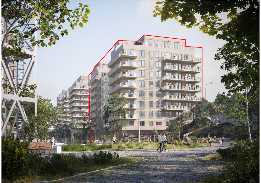
Vy från Gasverksparken österut. Detaljplanen omfattar de två byggnader som markerats med rött. Närmast till vänster det så kallade flamtornet, en bevarad konstruktion från gasproduktionen. Bild: CF Möller Architects

Ett horisontellt motiv av långsgående balkonger ger boendekvaliteter med rymliga uteplatser samtidigt som ljudmiljön i bostäderna förbättras. Översta våningen i varje hus är indragen. Byggnaderna binds samman längs Bobergsgatan av en tydlig sockel med högre våningshöjd, som med publika lokaler och entréer skapar kontakt med gatan. På ömse sidor om kvarteret finns parkstråk med trappor som binder samman de olika nivåerna.