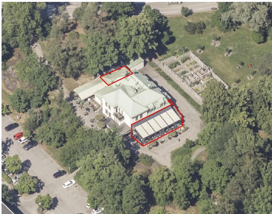
Markerat i bild är de två tillbyggnaderna, köket och lastkajen mot norr och uterummet tillsammans med inbyggd trappa mot söder.

tillsammans med en inbyggd trappa som skapar invändig koppling mellan byggnaden och uterummet.