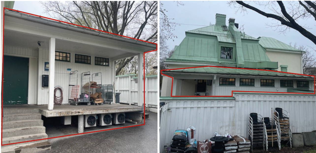
Tillbyggnad innehållandes kök och lastkaj som detaljplanen syftar till att ge planstöd markerat med rött. I bilden till höger ligger tillbyggnaden bakom ett högt plank vilket gör att den delvis är dold för den som rör sig i parken norr i fastigheten.

Centrumändamål tillåts inom hela fastigheten, men ska finnas i byggnadens bottenvåning. Bostadsändamål tillåts inom hela fastigheten undantaget byggnadens bottenvåning. Detta för att undvika att hela fastigheten blir en privat bostad. Genom föreslagen användning säkras möjligheten till en användning som riktar sig till allmänheten och som bidrar till Långbroparken som utflyktsmål och mötesplats. För att inte hindra allmänhetens passage över fastighetens infartsväg reglerar planen att inga byggnader, murar eller staket får uppföras där.