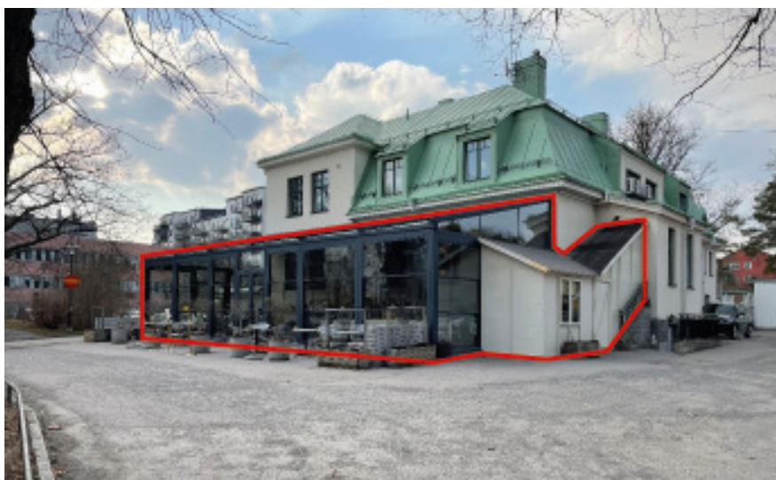
Den före detta överläkarvillan tillhörande Långbro tidigare mentalsjukhus. På bilden markeras det inglasade uterum detaljplanen prövar att ge planstöd. Kontoret föreslår att i den fortsatta planprocessen pröva en varsam håltagning i yttervägg mot uterummet för att möjliggöra en direkt access till detta. Syftet med det är att ta fram den nu inbyggda stentrappa (till höger i bild), vilket skulle bidra till att framhäva byggnadens ursprungliga volym.