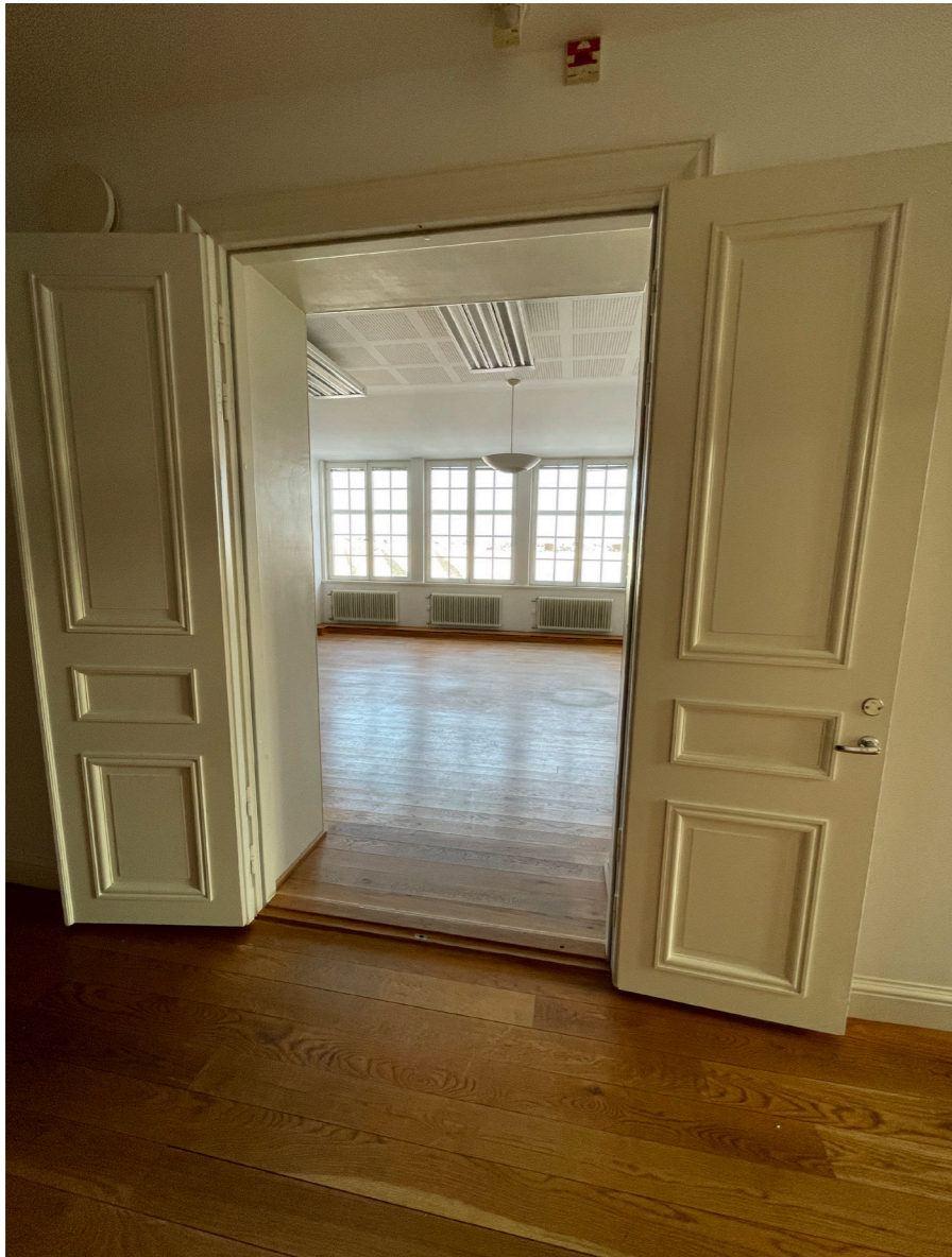
Exempel på icke ursprunglig dörr i hjärtmuren.