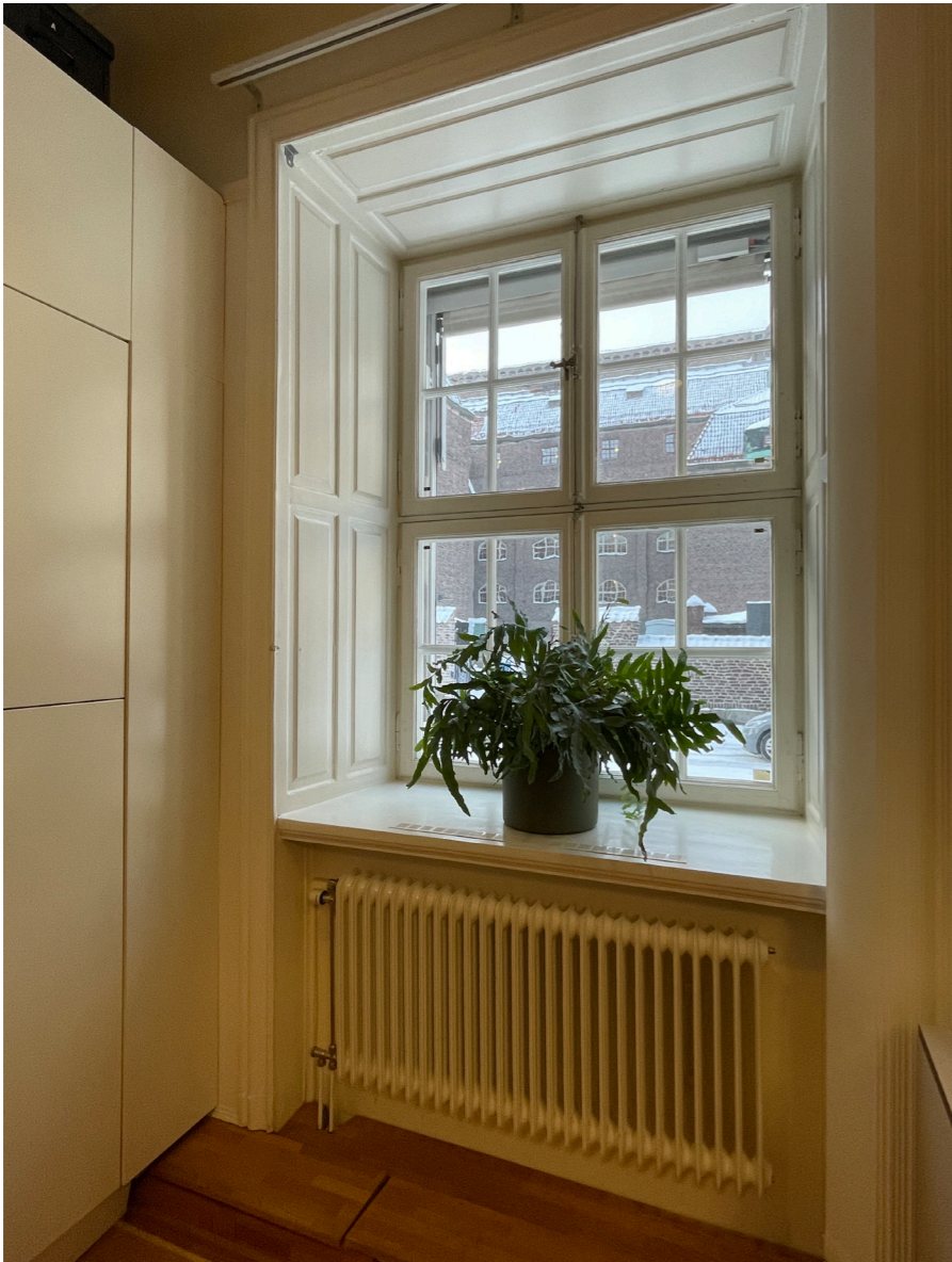
Fönster i gatuplan med djup fönsternisch. Murverket är kraftigast i byggnadens nedre del.