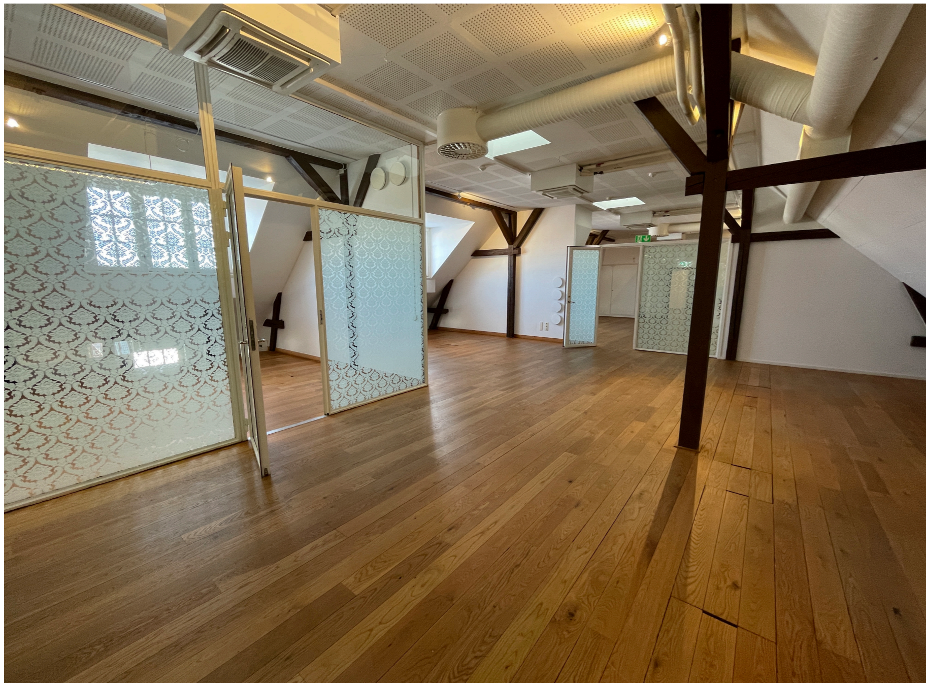
Kontorsytor på övre vindsvåningen med rumsbildningar.