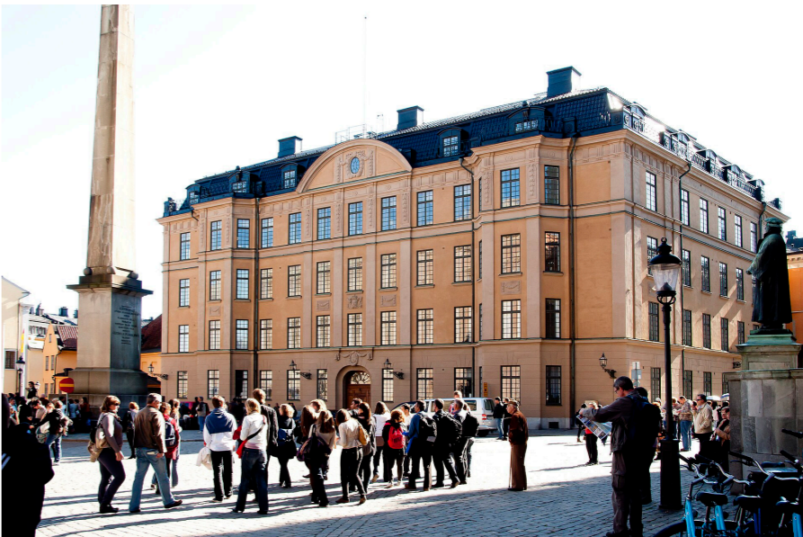
Hovförvaltningens hus, Slottsbacken. Här var Josephson påtagligt influerad av stormaktstiden.