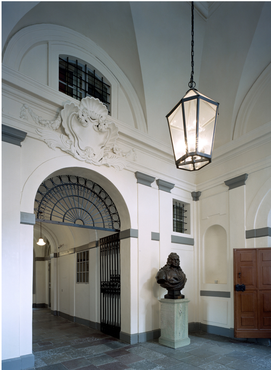
Bancohuset, Gamla stan. Kalkstensgolv, vitputsade väggar, grå detaljer och smide samt lykta - samtliga inslag som Erik Josephson lät utforma Generalitetshusets trapphus med.