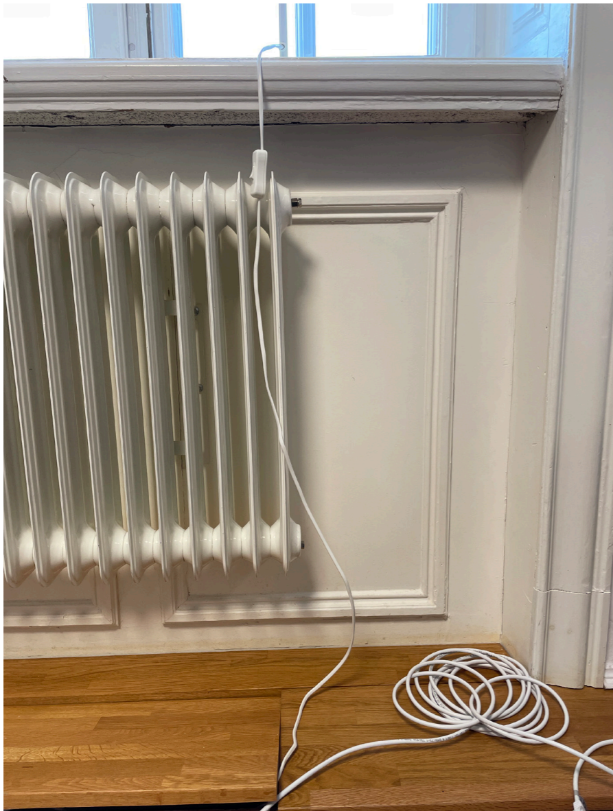
Väggpanel bakom radiator. Byggnaden var utrustad med vattenburen centralvärme och radiatorer då den uppfördes. Samtliga radiatorer har bytts ut mot nya som är relativt väl anpassade till arkitekturen.