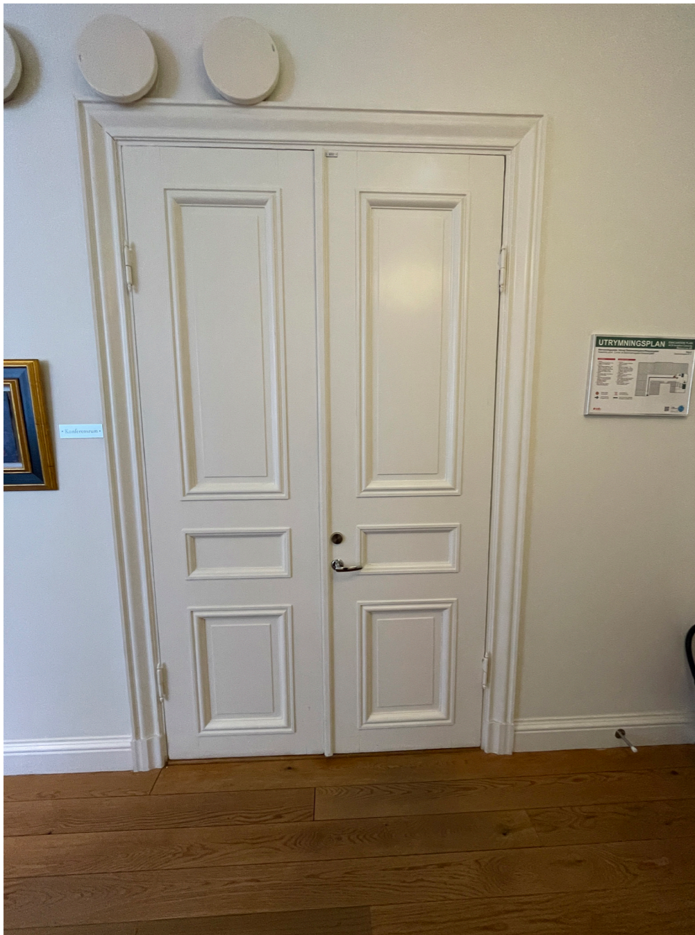
Pardörr i spegelutförande med ursprungliga foder och gångjärn.