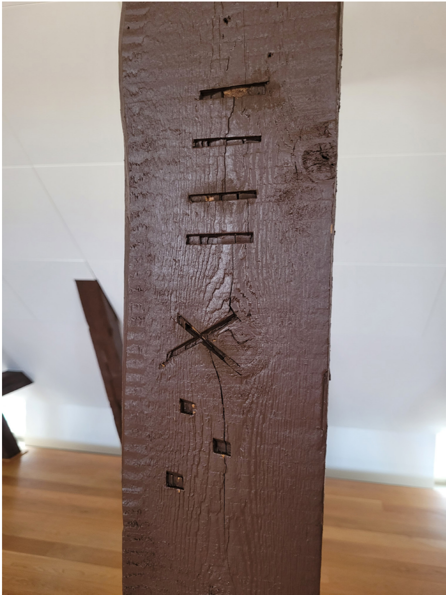
Takkonstruktionen är uppbyggd av virkesdelar som numrerats.