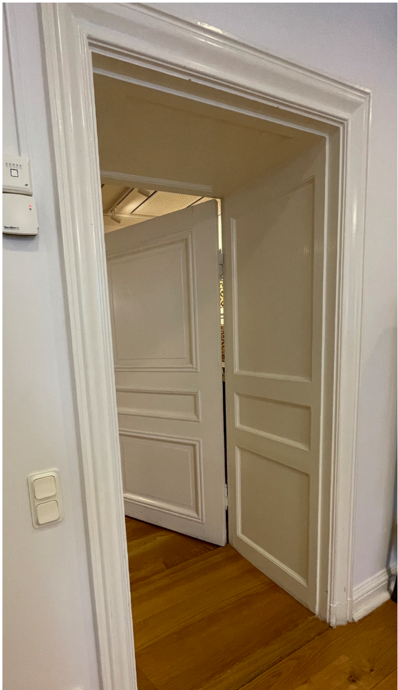
Snickerier i och i anslutning till öppningar i hjärtväggar är till största delen ursprungliga.