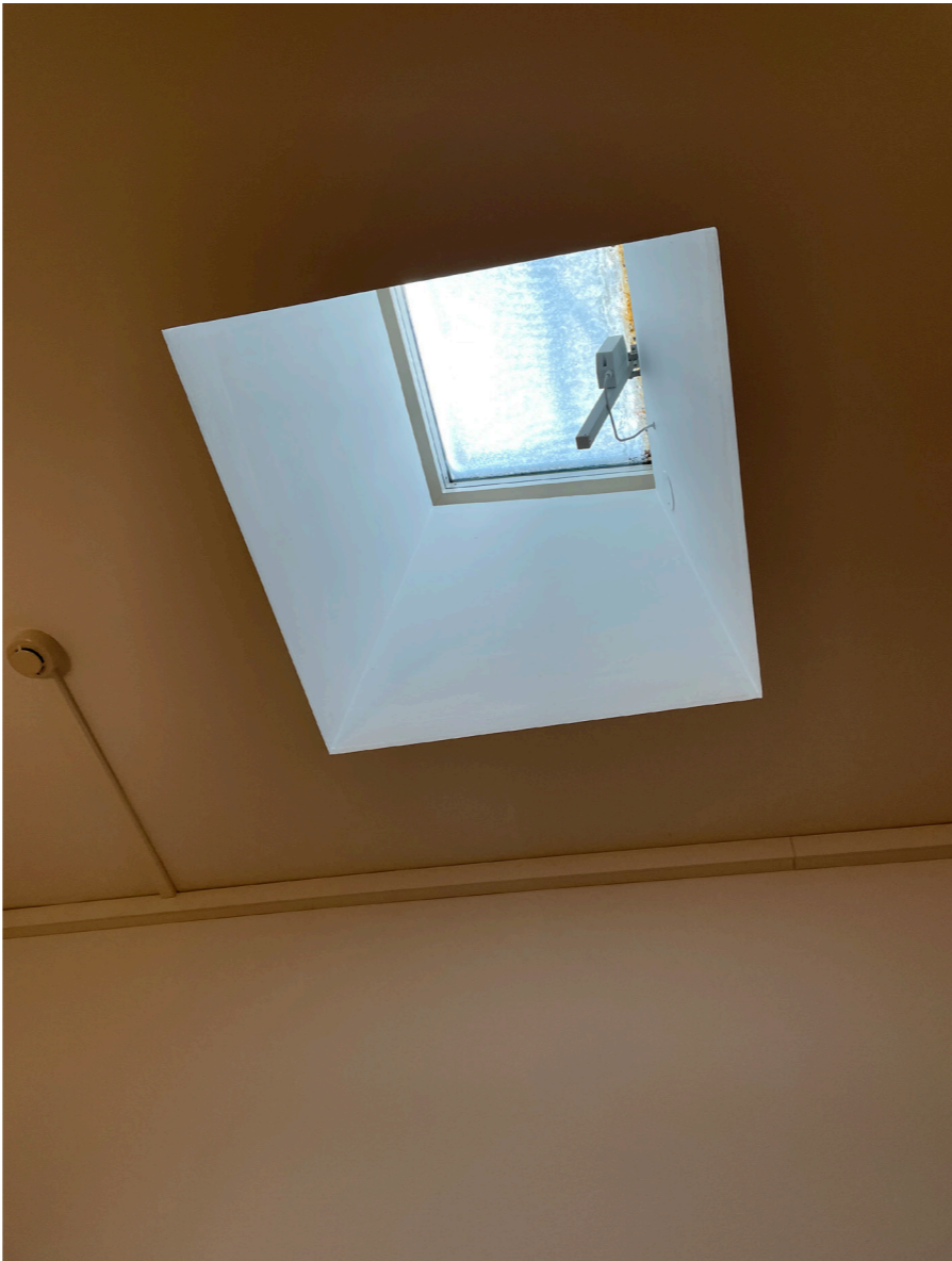
Takfönster från renoveringen 1999-2003.