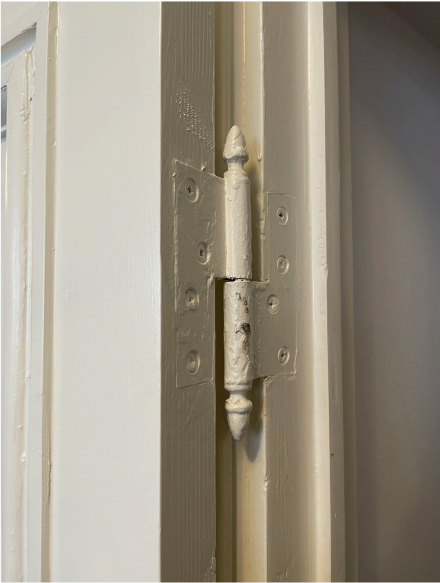
Gångjärn innerdörr i karaktäristiskt utförande från 1900-talets första del.