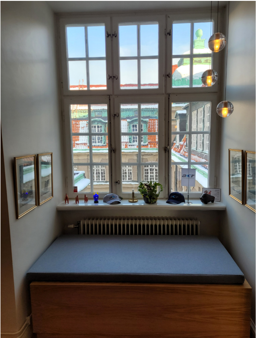
Fönsternisch i nedre vindsvåning i anslutning till kontorsentré. Detta läge motsvarar fönster- och balkongpartiet på bilden intill. Här i anslutning till trapphuset finns särskilt bearbetade lösningar som varierar plan för plan beroende på yttermurens dimensioner.