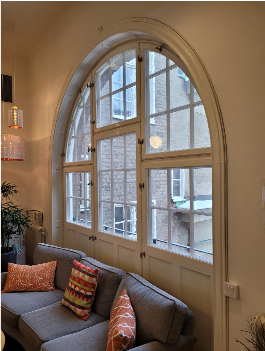
Fönsterparti med fransk balkongdörr.