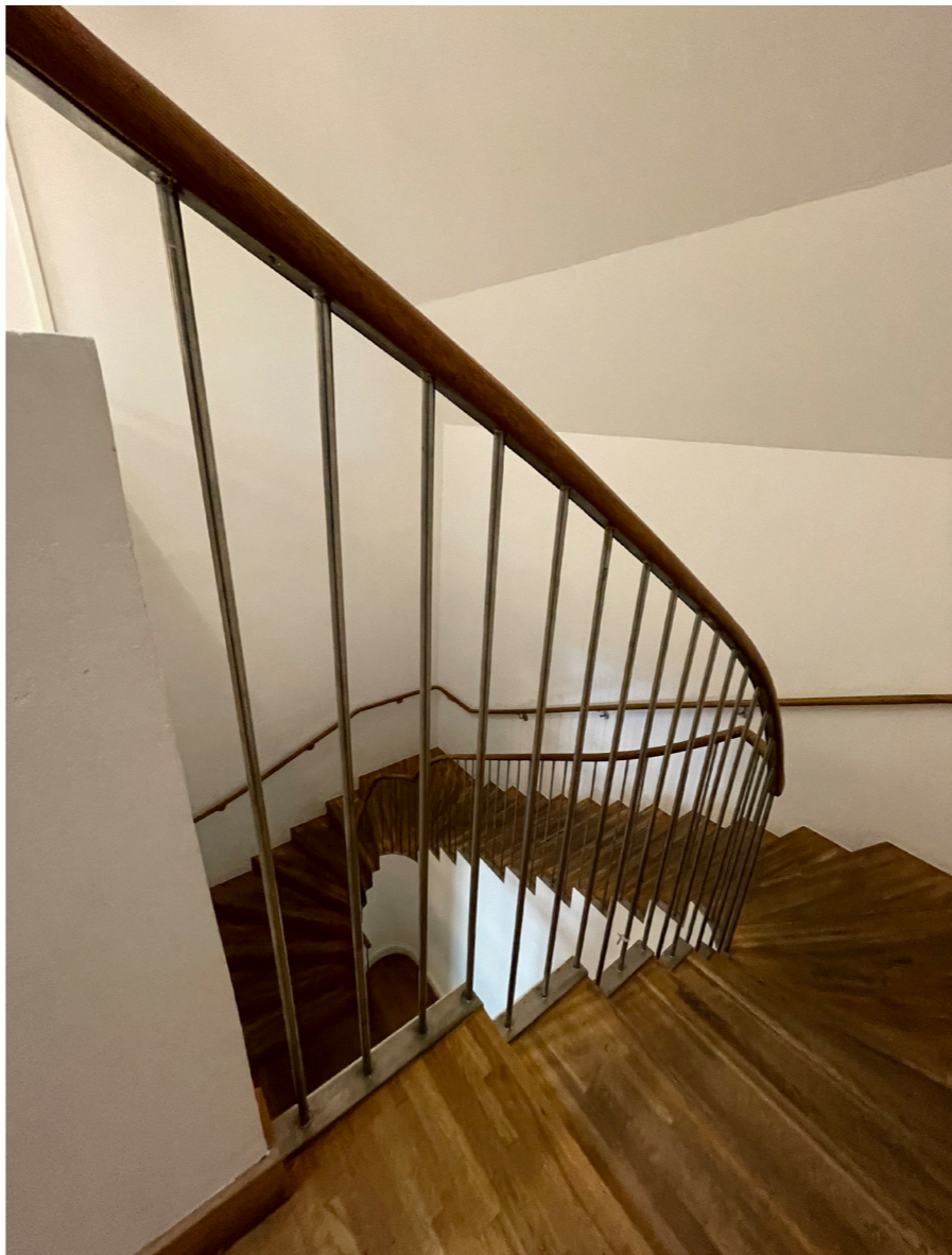
Invändig trapp till övre vind, tillkommen i början av 2000-talet.