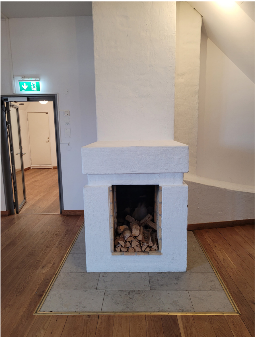
Öppen spis med geometriska former och eldstadsplan av gotländsk kalksten. Denna enda spis i byggnaden har sannolikt tillkommit vid 1900-talets mitt.