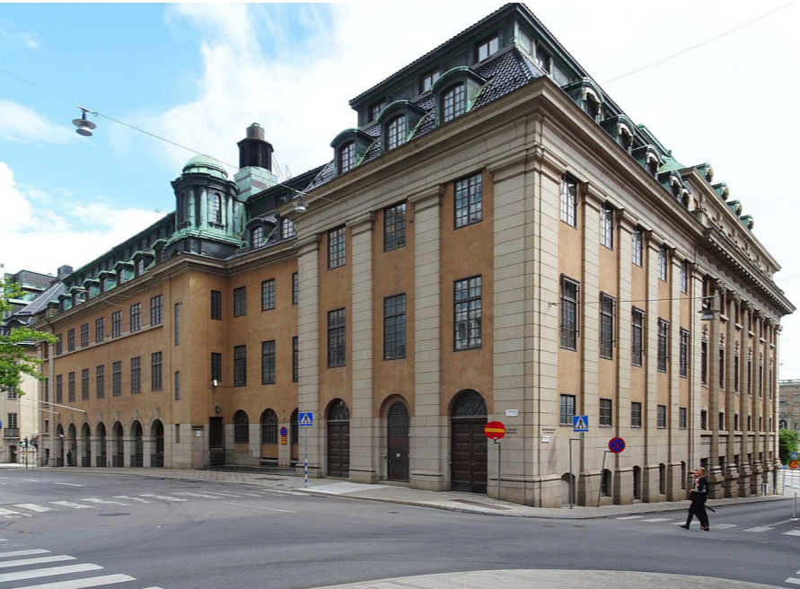
Kvarteret Vinstocken har vissa likheter med Generalitetshuset.