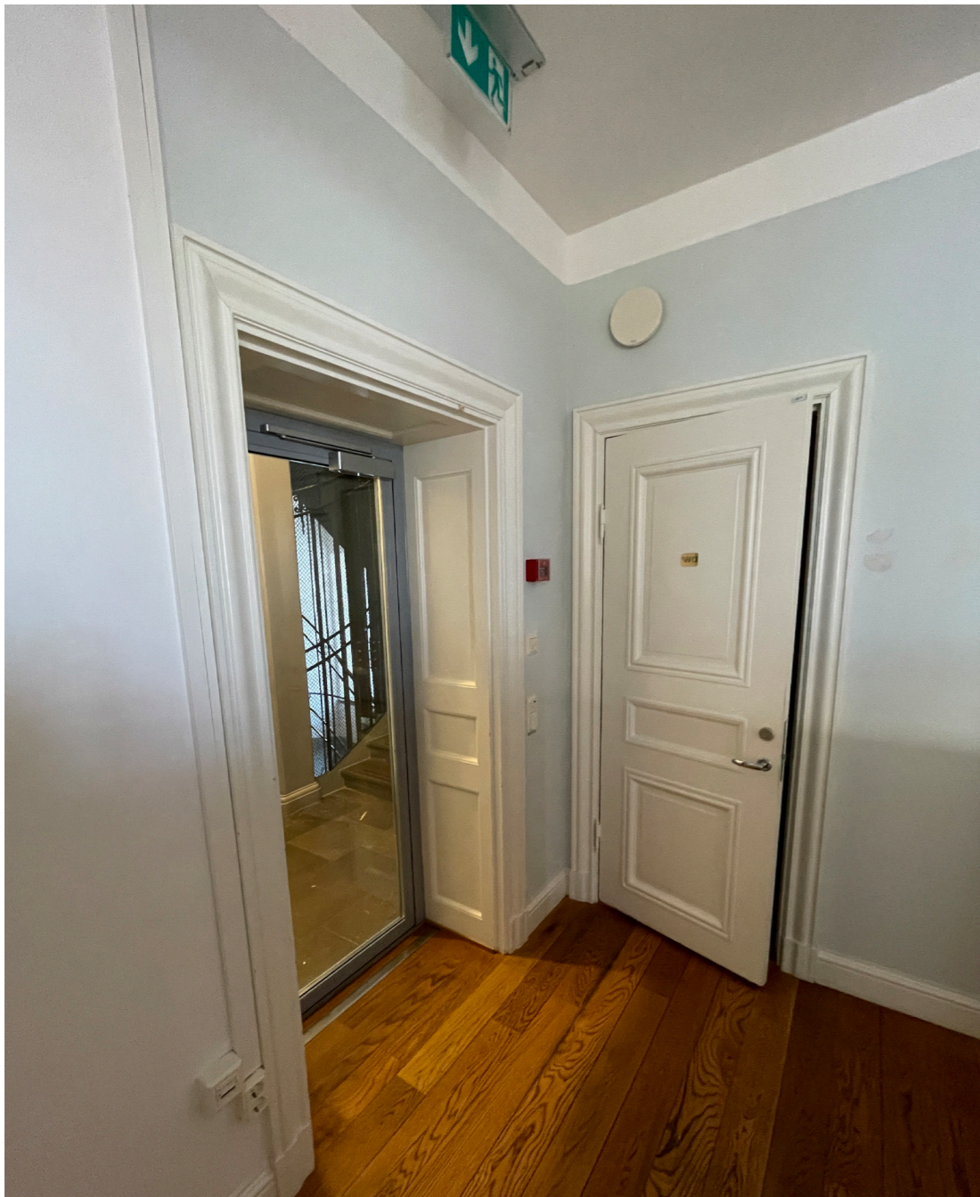
Exempel på där ett glasat entréparti satts in mellan trapphus och lokal.