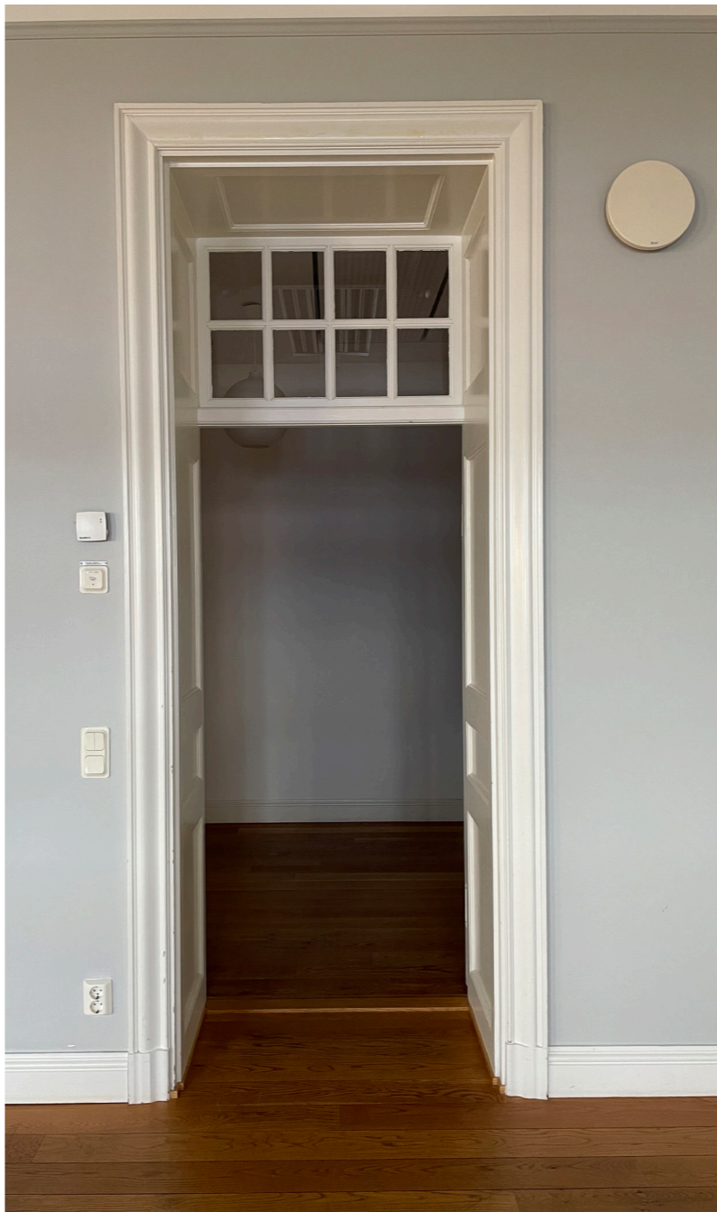
Överljus i korridorvägg. Snickerierna i öppningarna har stor betydelse för kontorsplanens karaktär.