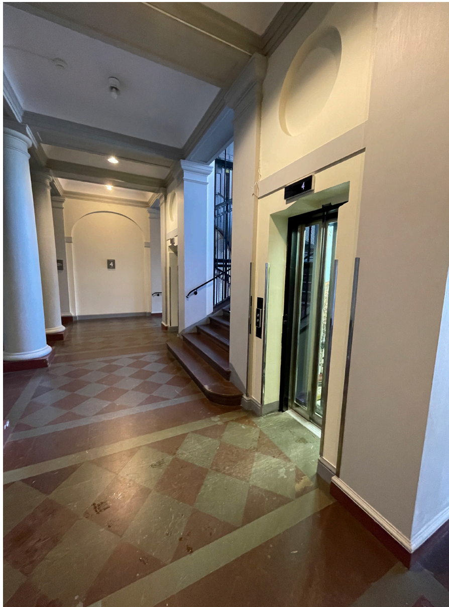
Huvudtrapphuset har dubbla hissar. Det 1600-talsinspirerade golvet breder ut sig i det rymliga utrymmet.