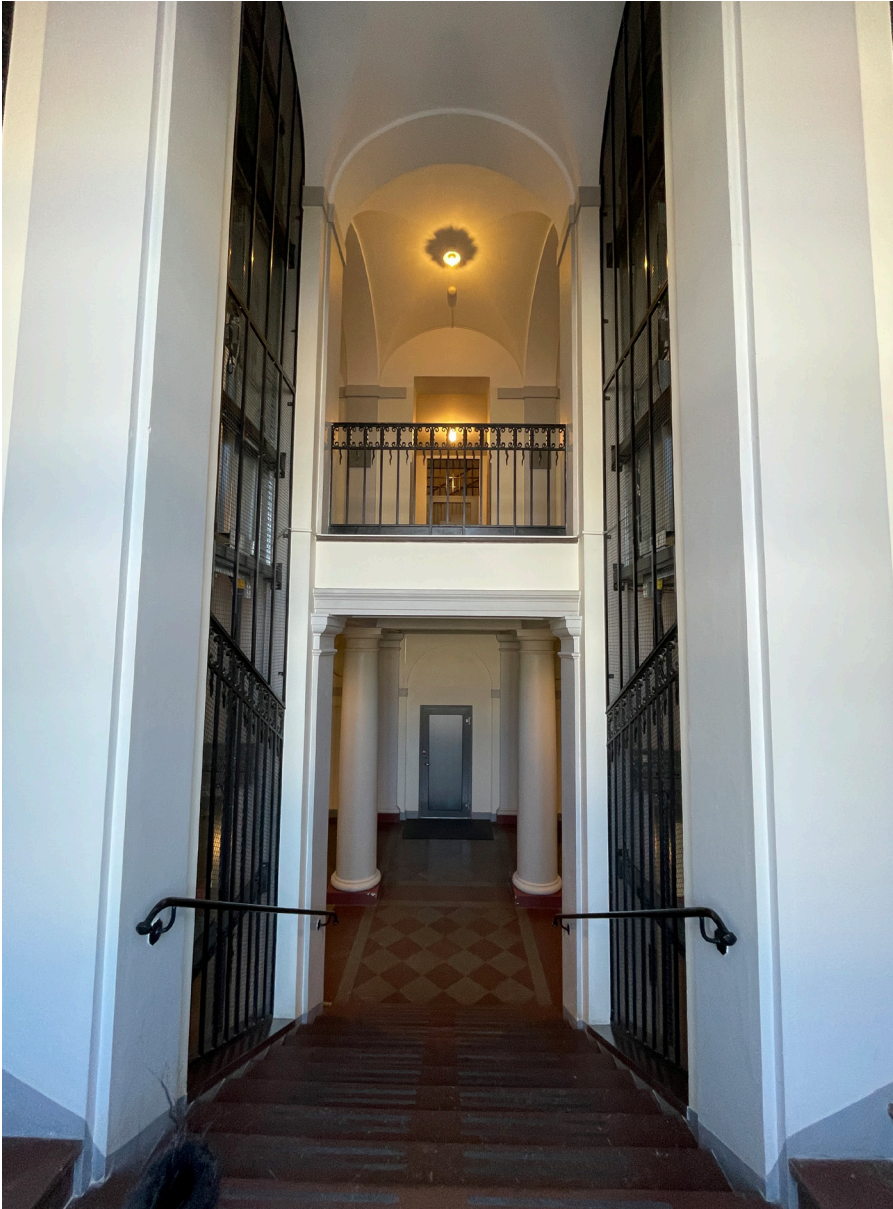
Trapphallens översta del med dubbelhöjd och ursprungligt, rikt dekorerat smidesräcke.