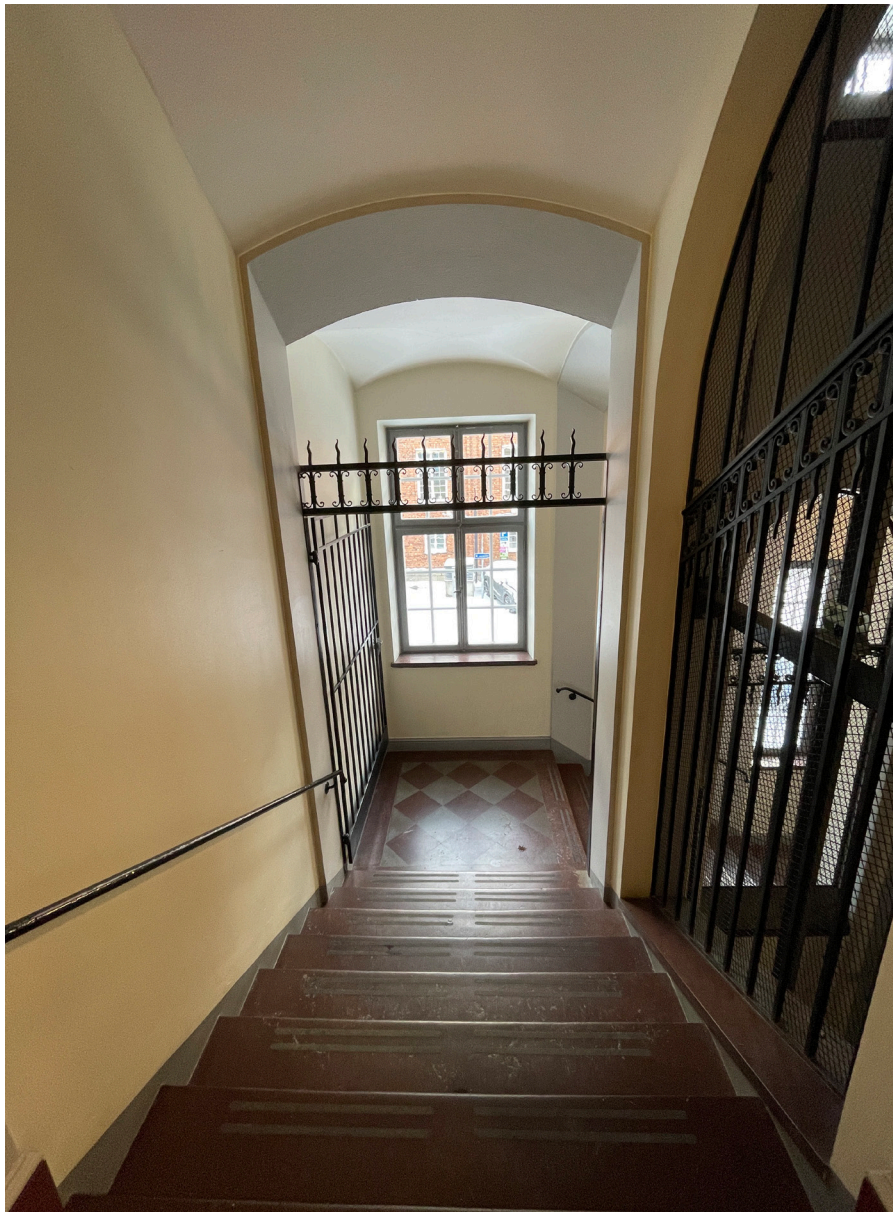
Trapphall med avgränsande gallergrind som kan vara ursprunglig. Hissgallren har bevarats när hisskorg bytts ut.