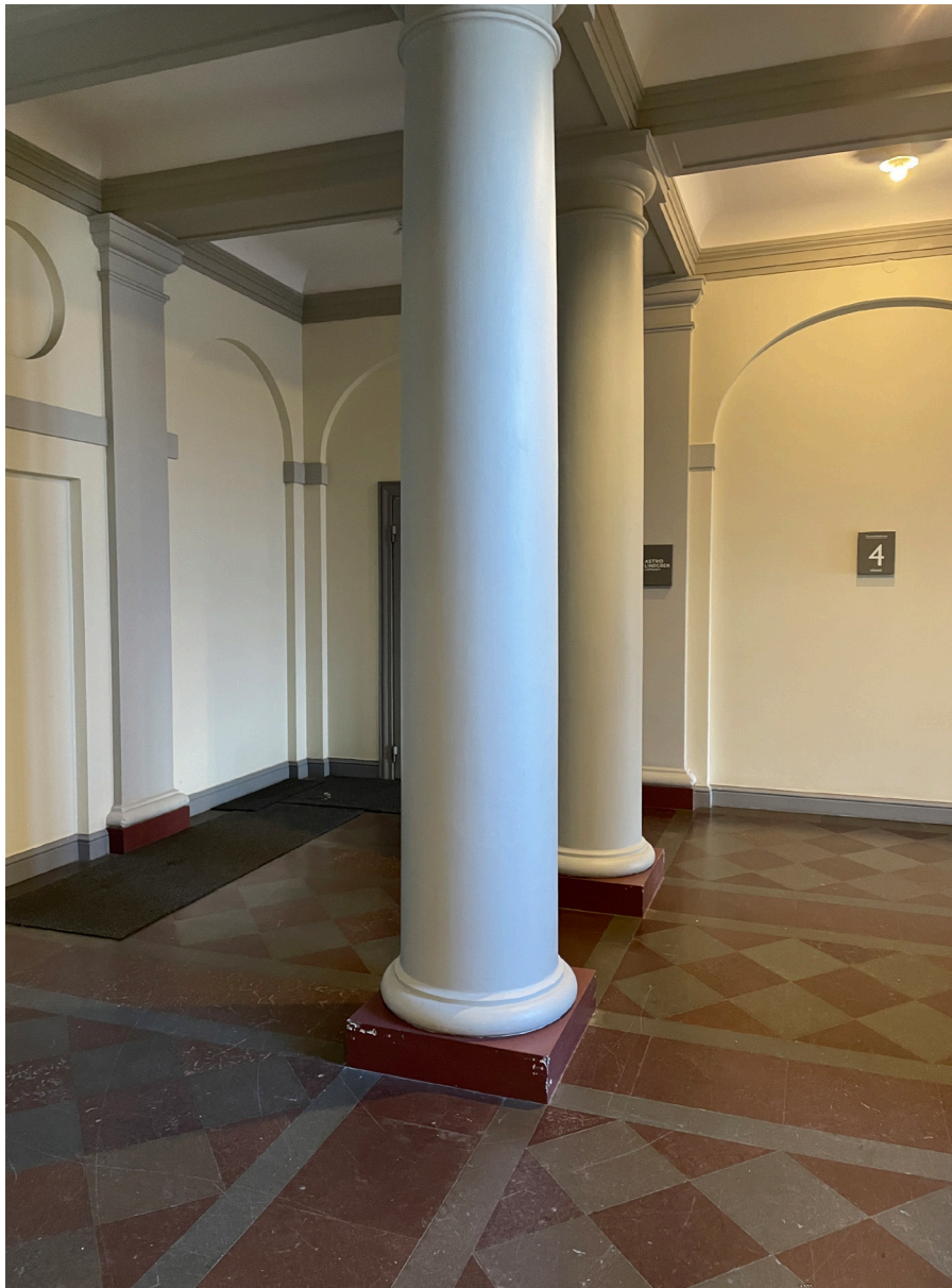
Trapphallen på plan 4 har inte påverkats av inbyggnad. På andra plan har väggar som länkar samman lokaler på var sida av trapphusen tillkommit i sen tid.