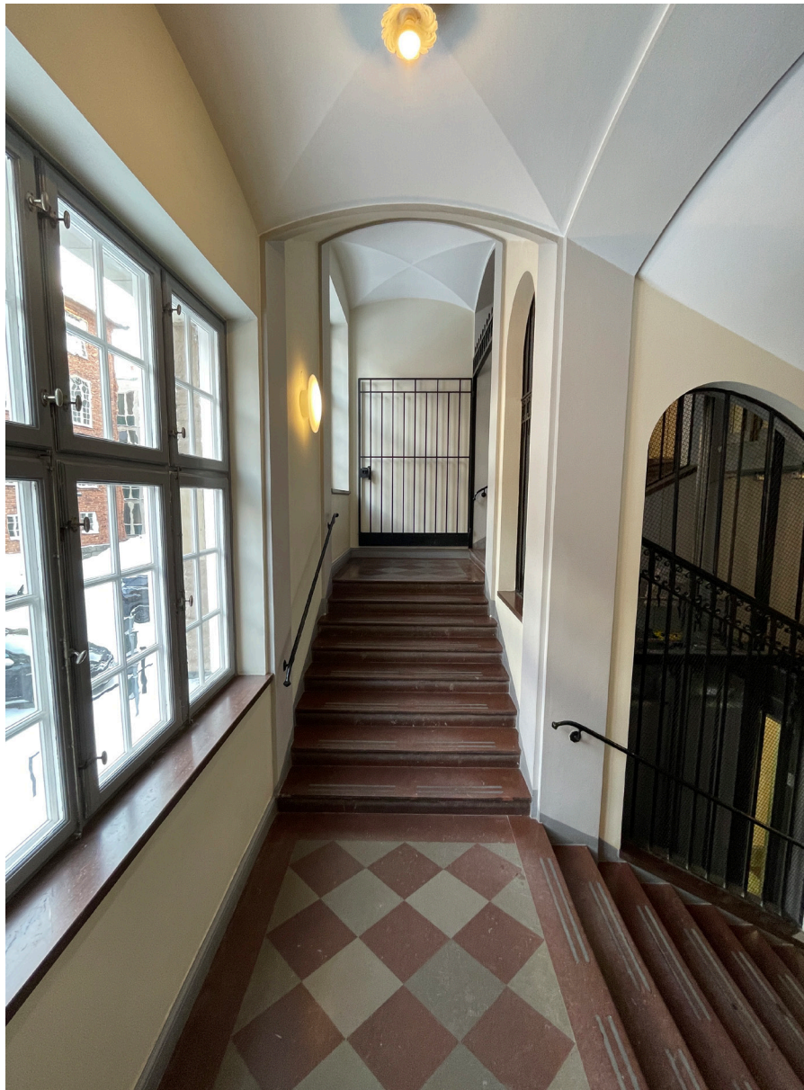
Trapphallen sträcker sig ut till norra fasaden och har rik dagsljusbelysning.