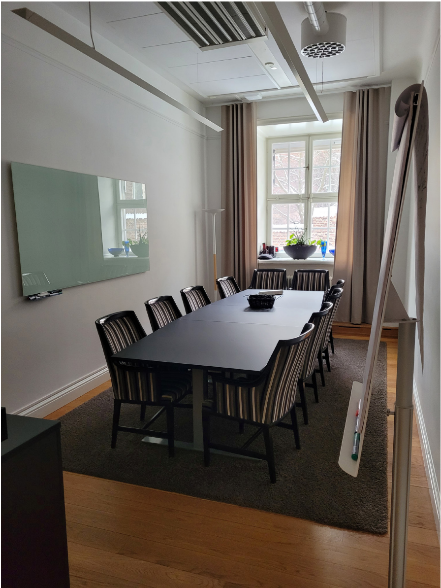
Exempel på mindre rumsbildning med bevarat kälrat tak och sentida tillägg i form av akustikplattor, baffel, ventilationsdon och nedpendlade belysningsarmaturer.