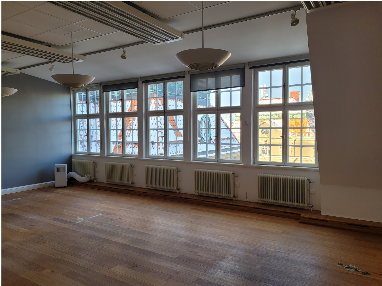
Rum i nedre vindsvåningen med en grupp av tätt sittande fönster. På detta plan finns flera f.d. salar med förstärkt dagsljusinsläpp. Dessa rum har bl. a. använts som ateljéer.