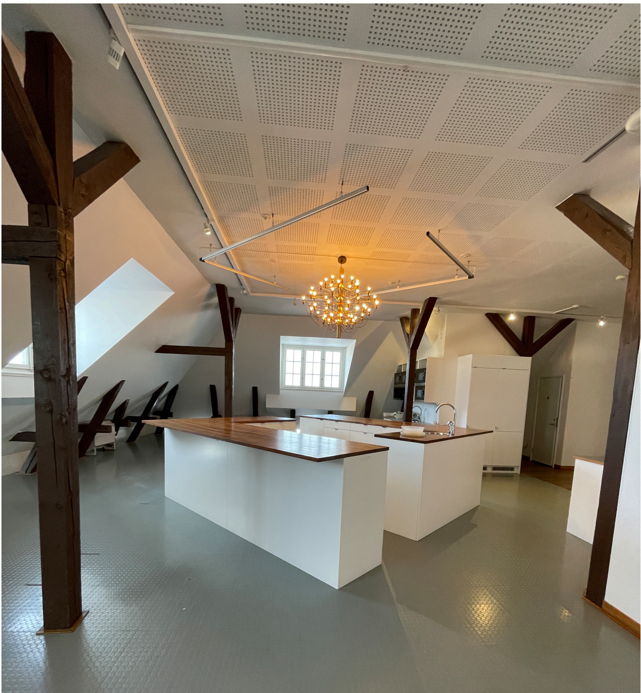
Pentry på övre vindsvåningen.