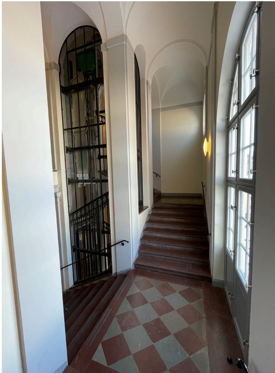
Trapphall med utgång till balkong på norrfasaden.