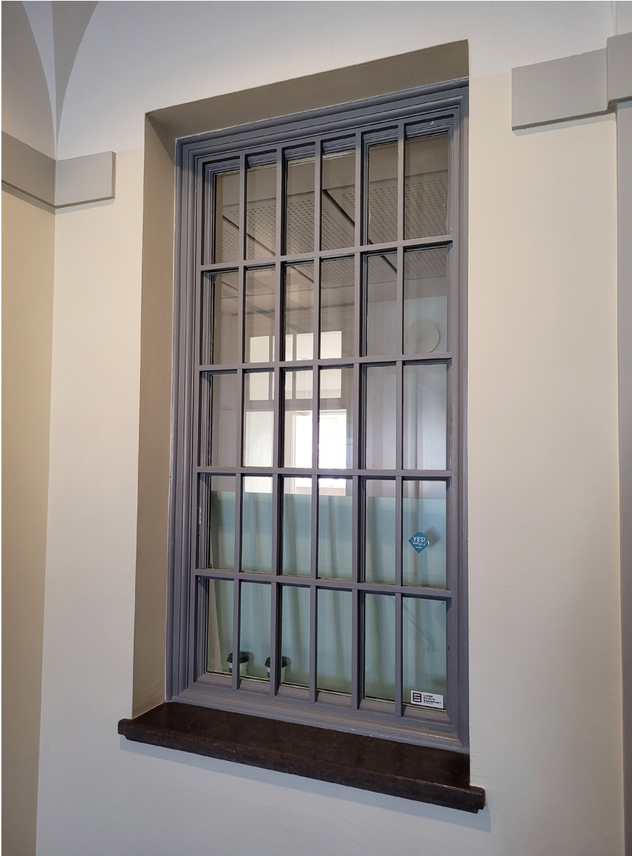
Invändigt fönster högt upp i trapphallen med sentida säkerhetsgaller.