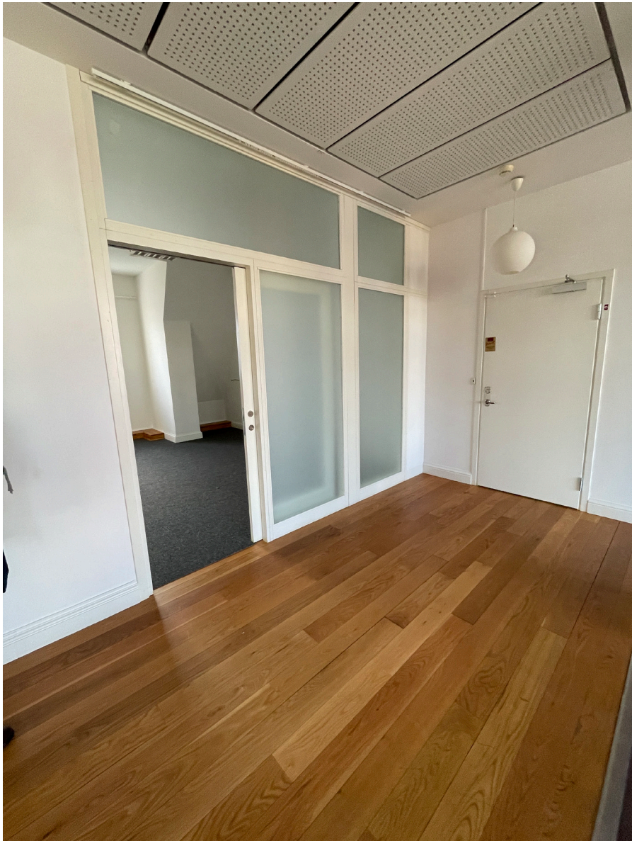
Vissa ytor präglas i högre grad av 2000-talets anpassningar än av ursprungstiden.