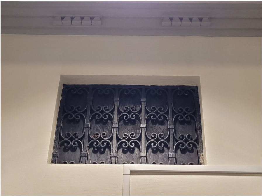
Ursprungligt ventilationsspjäll i smide, senare igensatt.