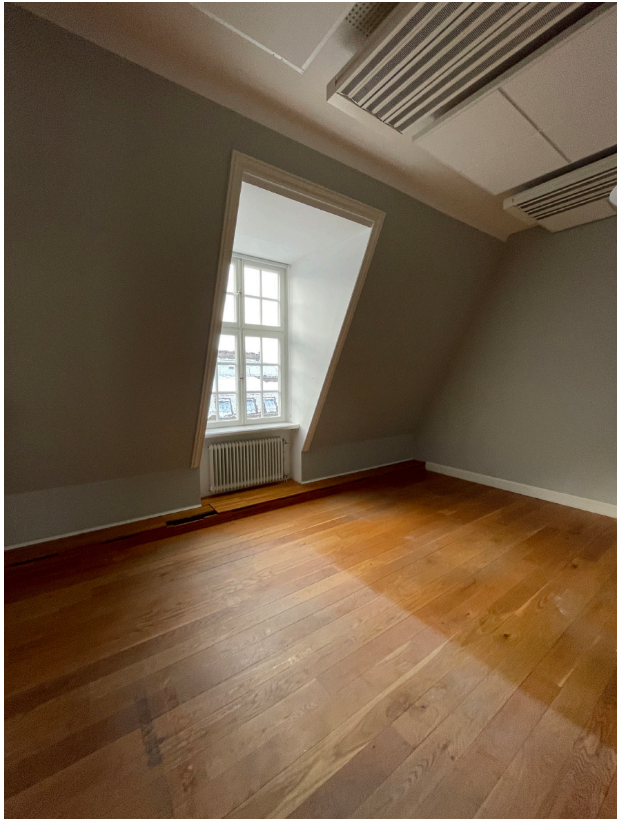
Kontorsyta på nedre vindsplan med solitär takkupa.