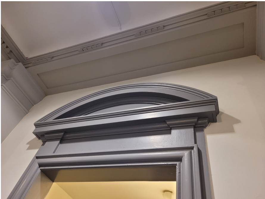
Dörröverstycke och kraftigt profilerade dörrfoder med historiserande utformning.