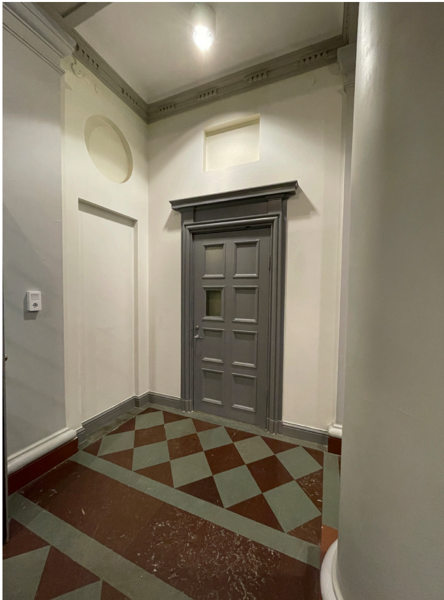
Taklisten är här mer dekorerad än på andra håll i byggnaden.