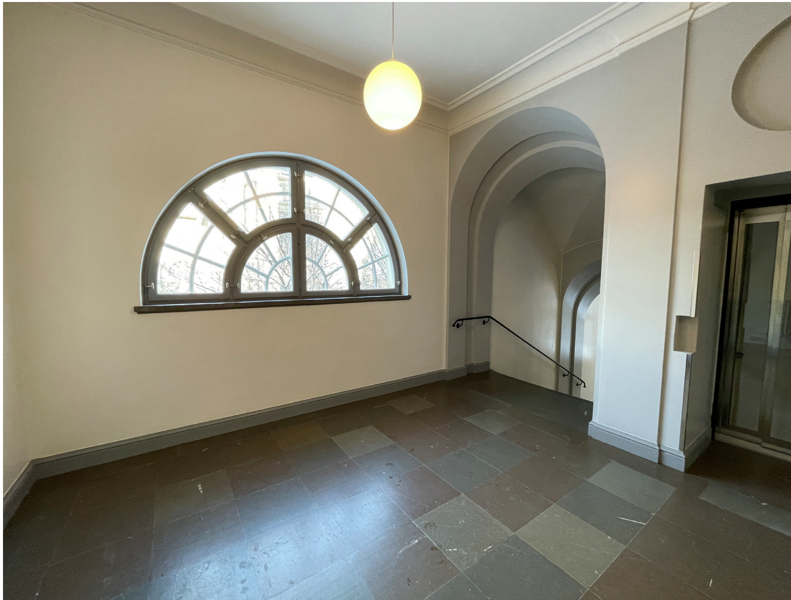
Trapphallarna i flyglarna förses med dagsljus från fönster med olika former.