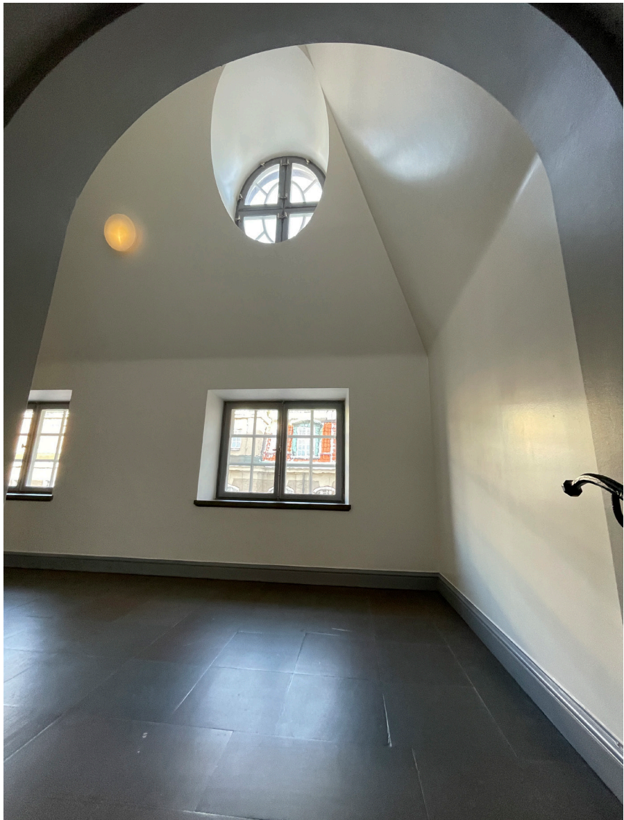
Trapphall med högt placerat fönster, s. k. oxöga.