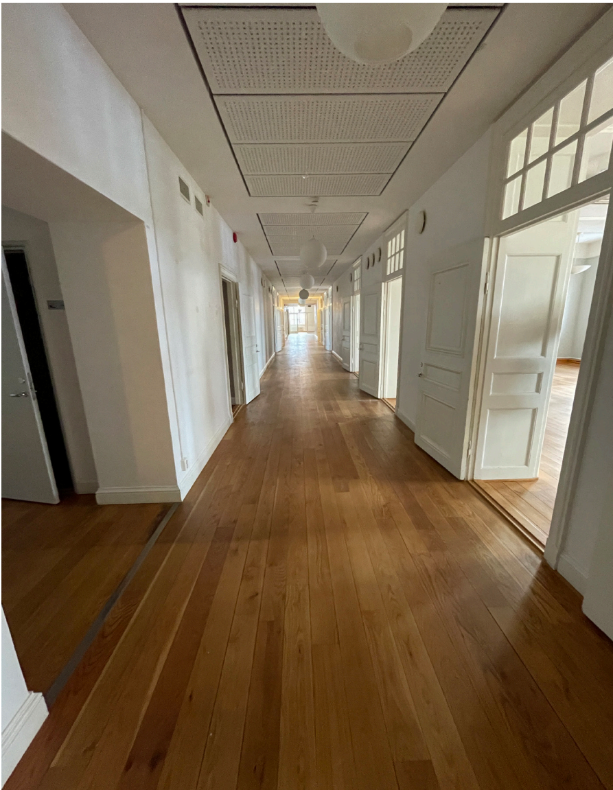
För byggnaden representativ korridor med öppningar i hjärtmur till stora kontorsrum. Dörrar med fyllningar och spegelindelning i muröppningarna har bevarats när flera mindre rum slagits samman. Överljusfönster ger sekundärljus till korridor. Inslag från det tidiga 2000-talets modernisering är golvmaterial, öppning i mur för WC-grupp, ventilationsdon i hjärtmurar samt sänkt undertak.