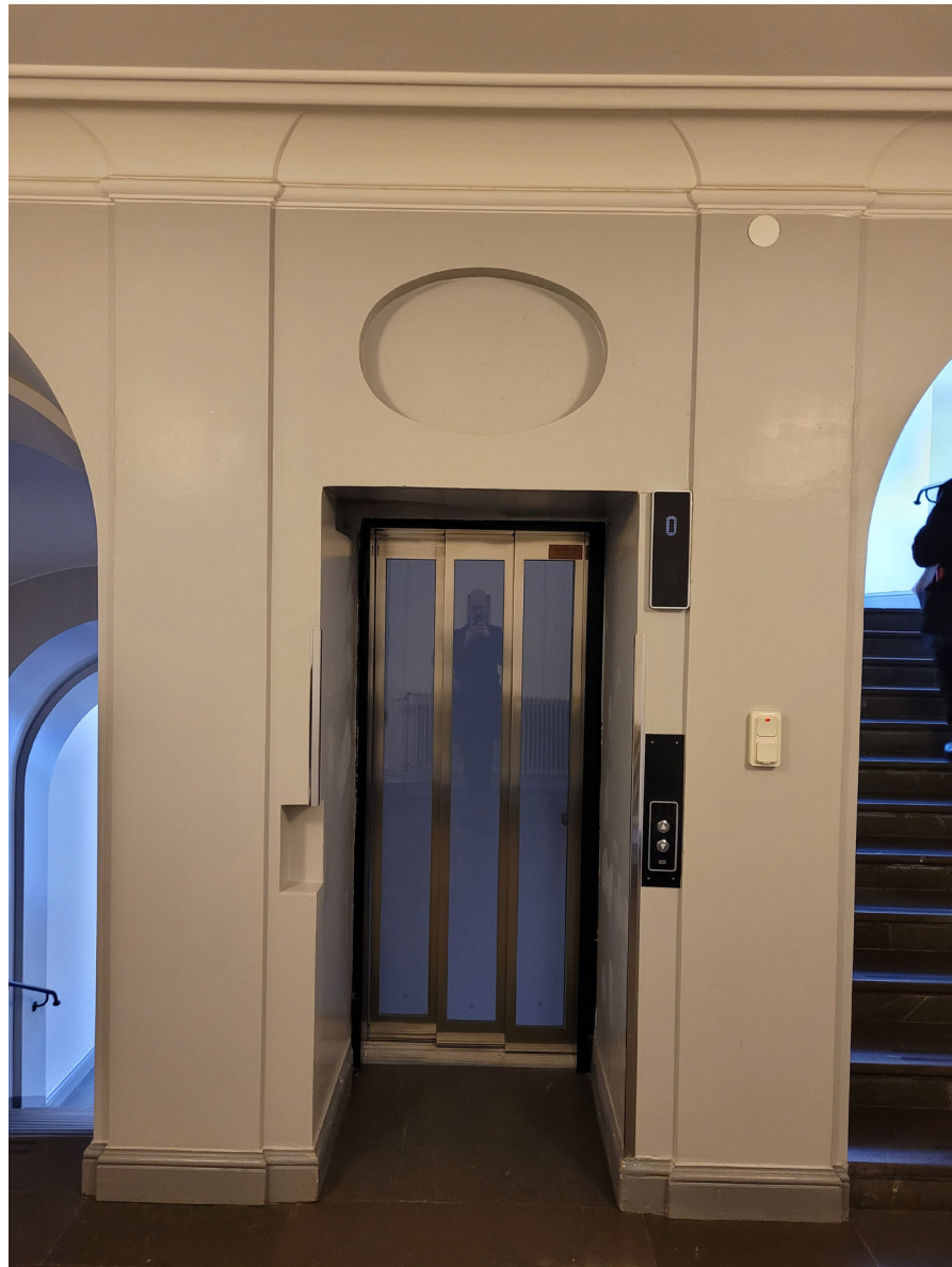
Hissen är indragen och omgiven av pilastrar och en oval blinding.