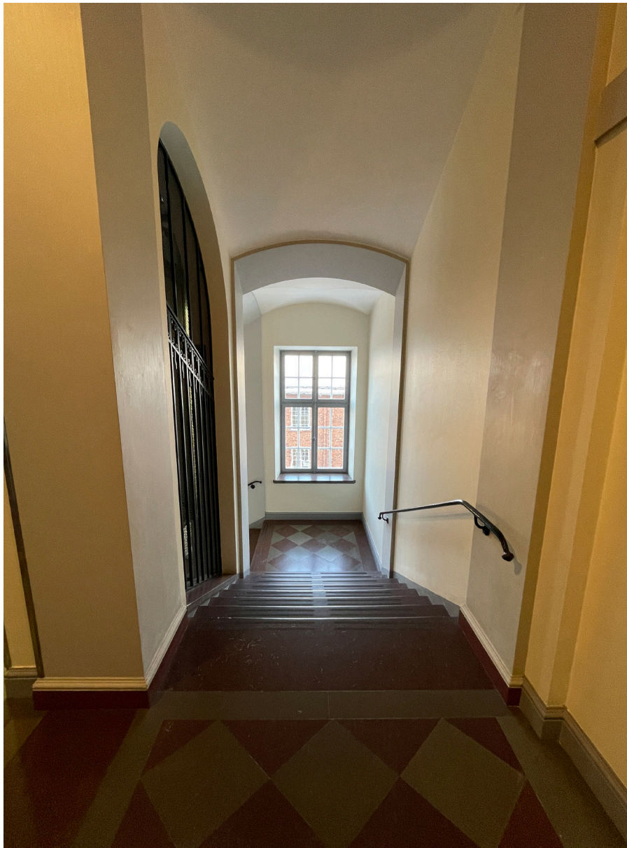
Handledarna i smide är av samma typ som i flyglarnas trapphus.