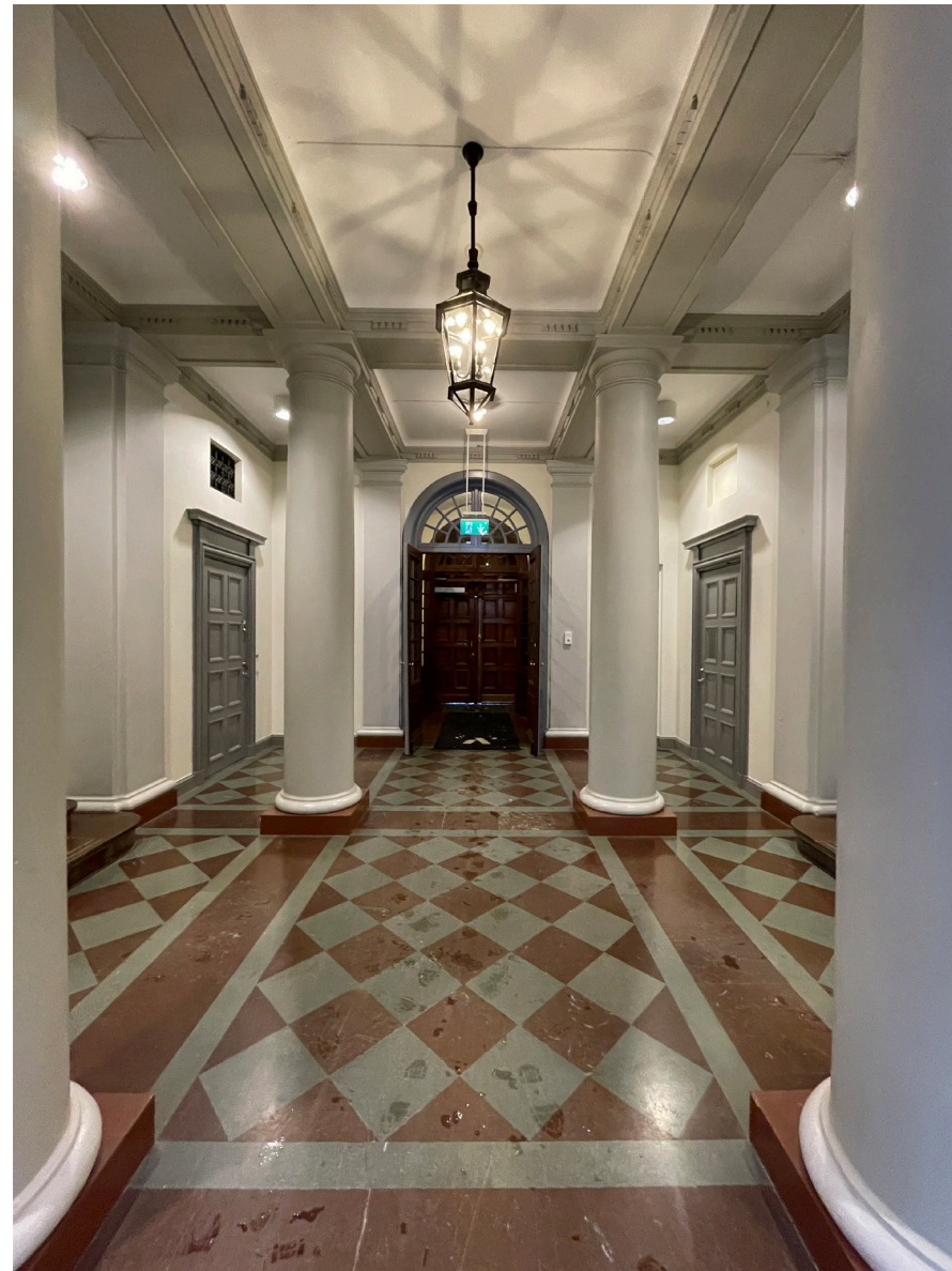
Huvudtrapphuset som brukades av Generalstaben, marinstaben m.fl har en betydligt mer påkostad karaktär än "högskoletrapphusen" i flyglarna. Utformningen är kraftigt influerad av 1600-talets slott- och palatsarkitektur.