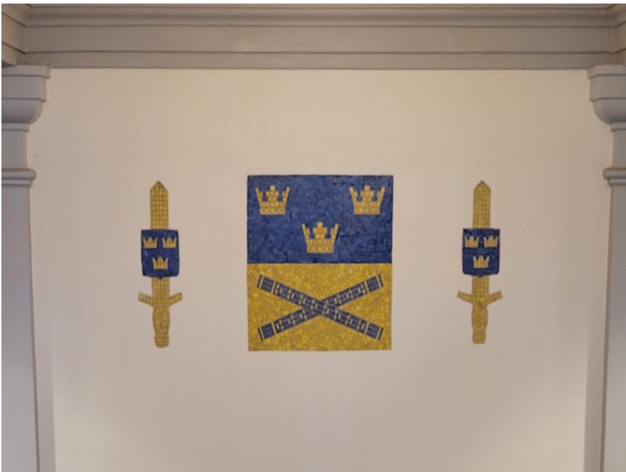
I huvudtrapphuset finns en mosaik med ett av Försvarmaktens vapen. Det är oklart när detta tillkommit. Det är ett av få invändiga inslag som vittnar om byggnadens militära ursprung. Vapnet har sannolikt koppling till Generalstaben.