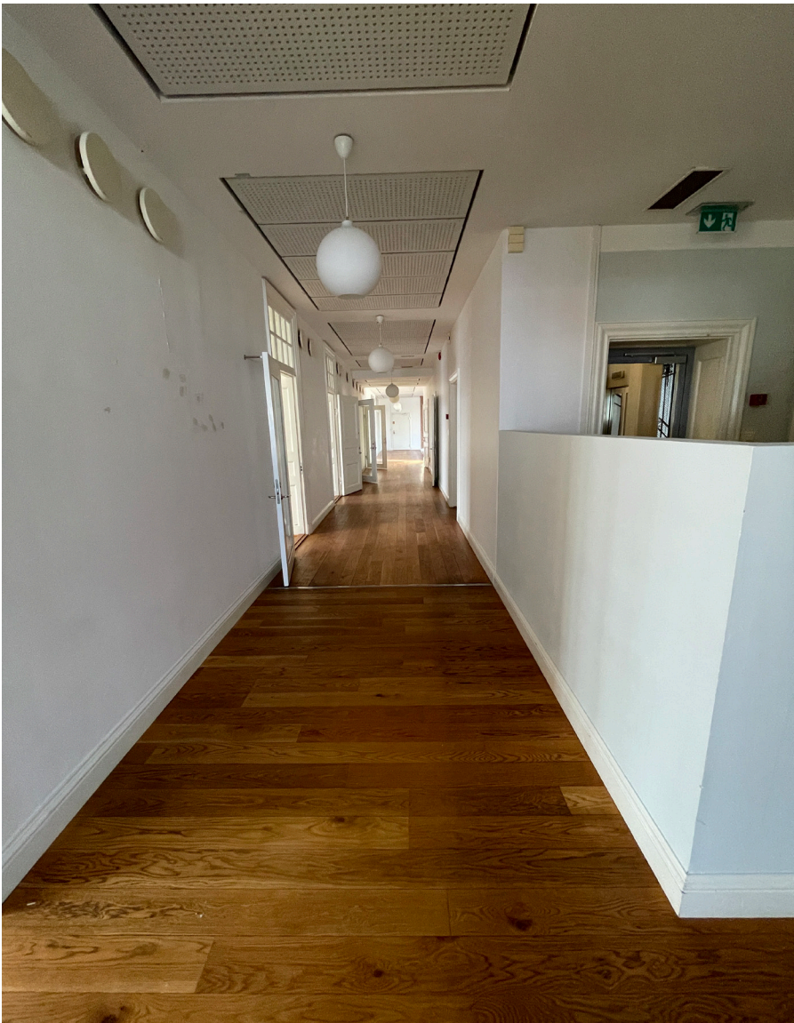
Korridor i flygel längs Skeppargatan. Den lägre väggen döljer en WC-grupp i anslutning till ett av trapphusen.