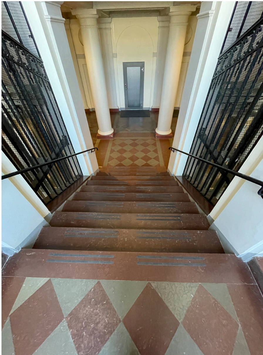
Kolonnerna i entréhallen återkommer på våningsplanen Här syns ett plan där ursprunglig volym bevarats. Dörren är inte ursprunglig.