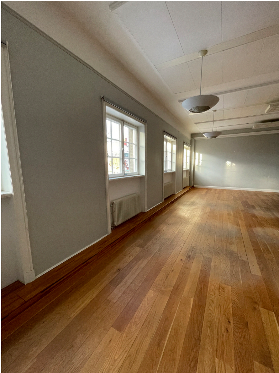
I den förhöjda mittdelen mot innergården är fönstren i nedre vindsvåningen mindre och högt placerade.