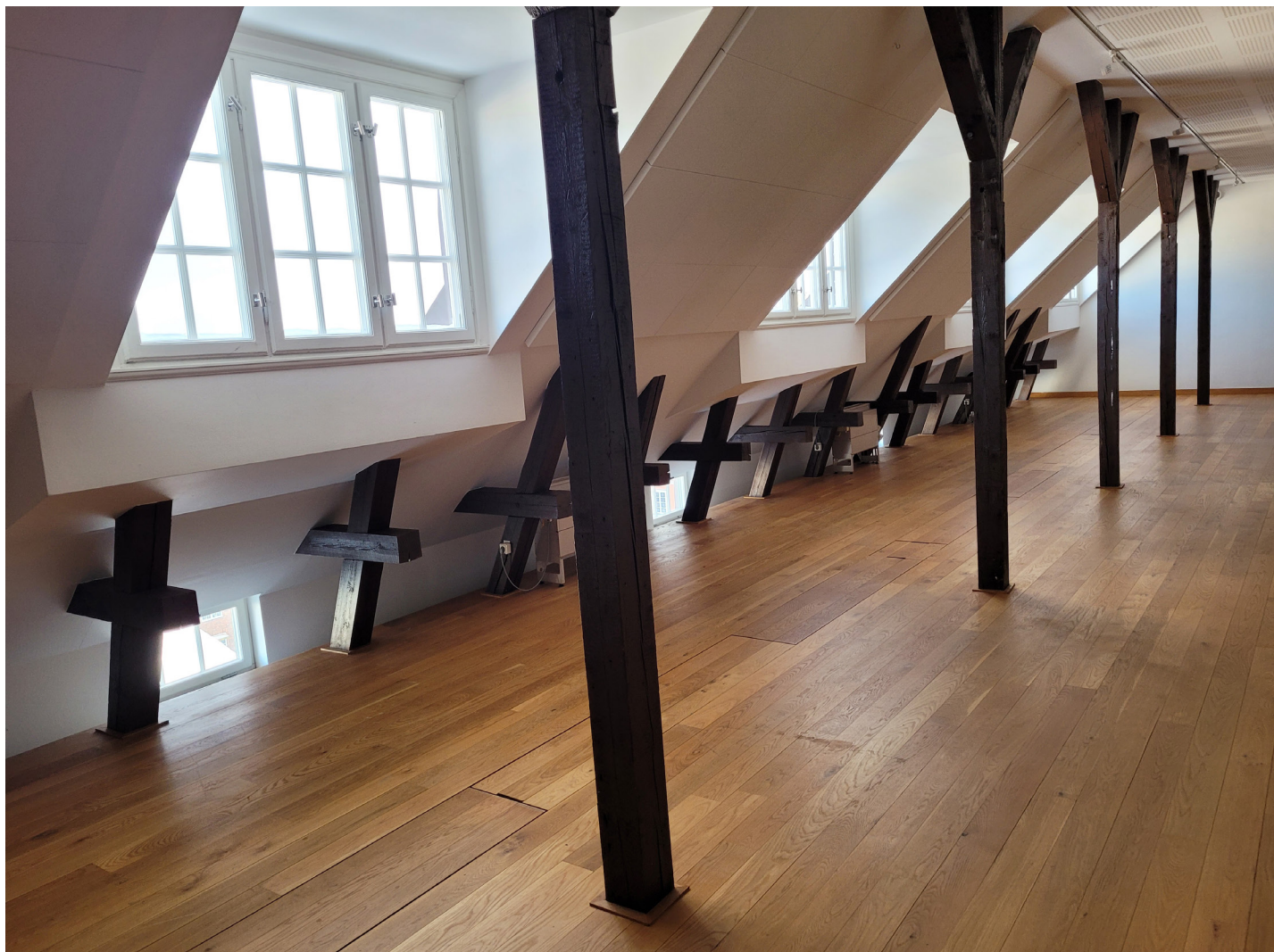
Kontorsytor på övre vinden som iordningställdes i början av 2000-talet och som genomgått anpassningar även efteråt. Rummen får ljus från de små fönstren i takets italian och från takkupor varav flera tillkom 1999-2003.