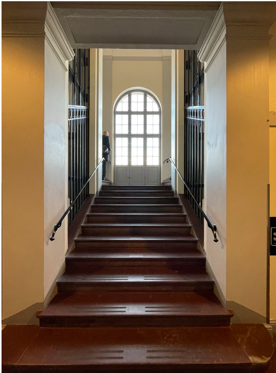
Trapphall. Monumentaliteten och symmetrin är utpräglad.