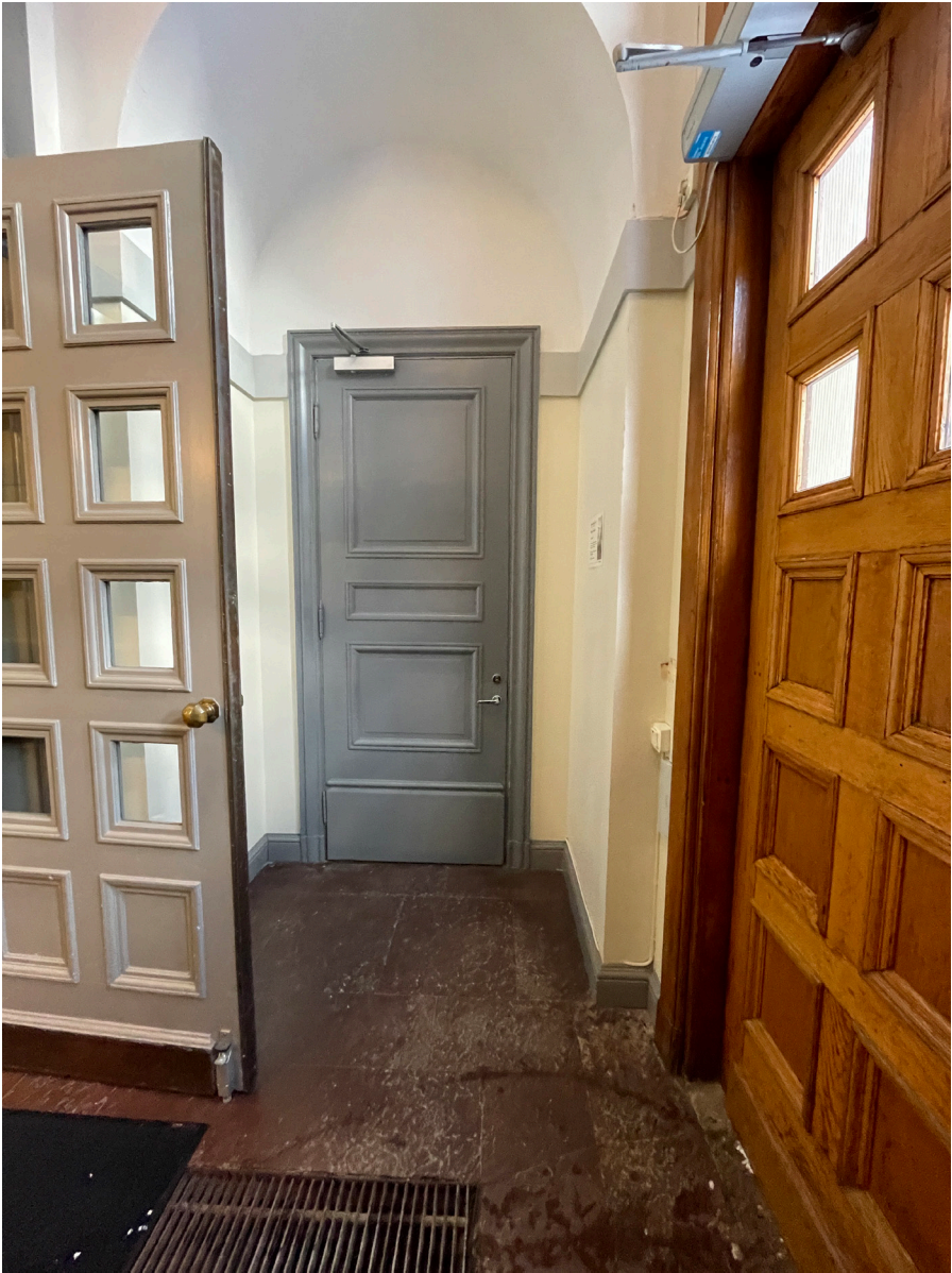
Entréhall med vindfång. Redan i entrén möts man av de allmänna ytornas karaktärsmaterial, kalksten, vit puts och grå snickerier.