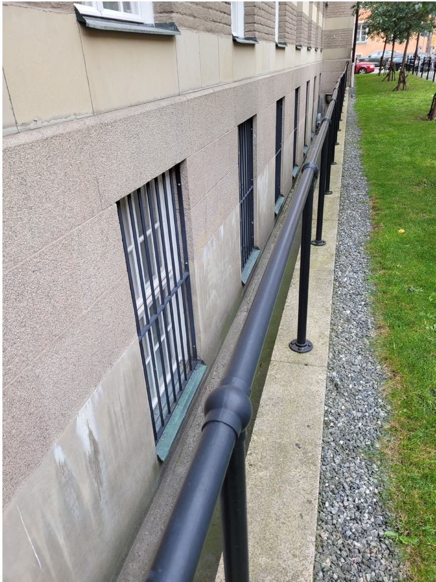
"Löjtnantsgatan" - räcket vid de förhöjda fönstren kan vara av ursprunglig typ.