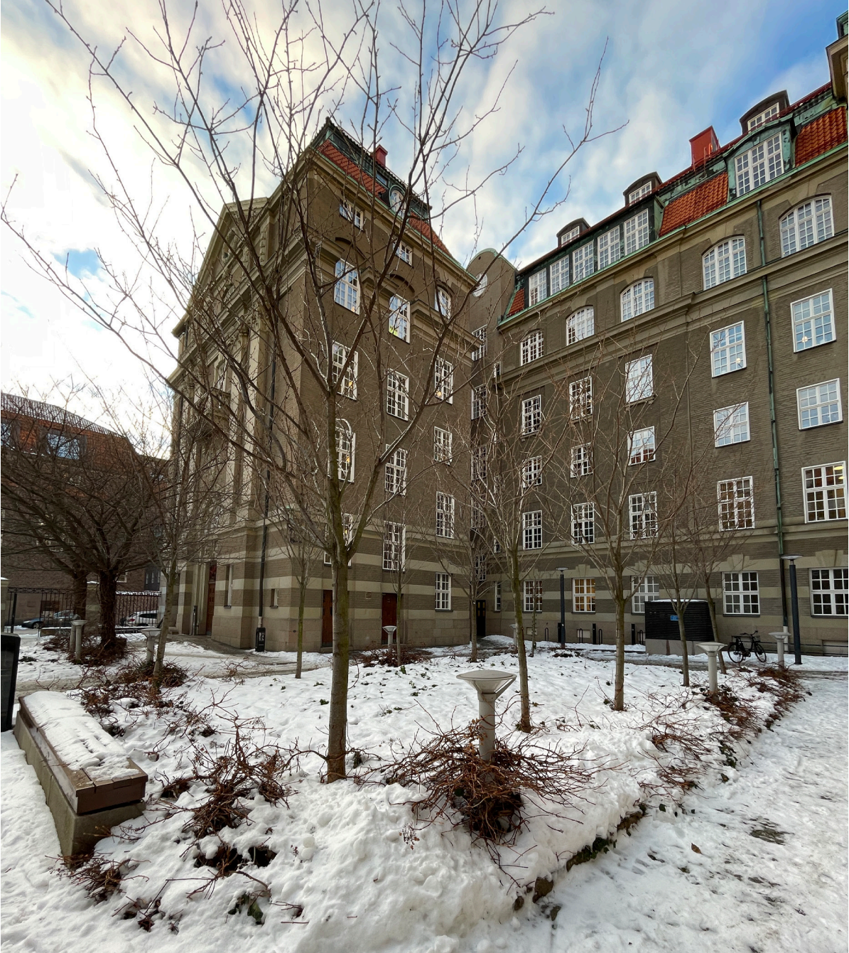
Innergård med träd- och buskplantering, belysningspollare och sittbänkar.