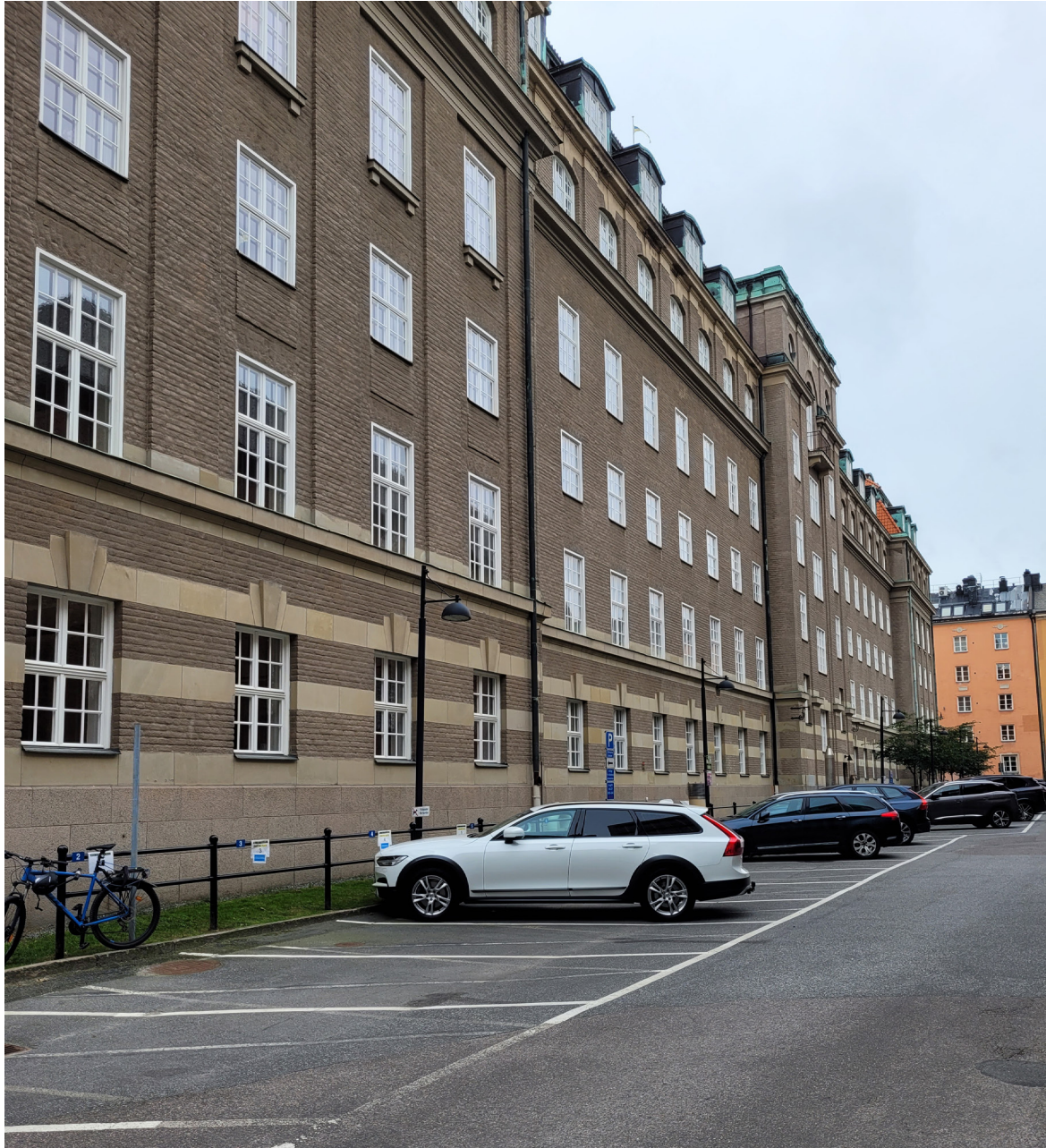
”Löjtnantsgatan” med gräsyta, räcke och parkeringsyta längs fasaden.