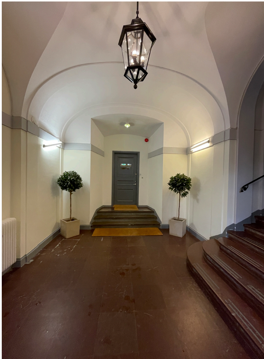
Entréhall med olika typer av valv.