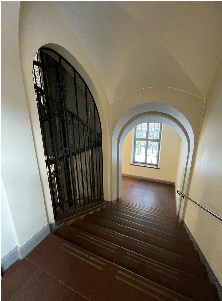
Den moderna funktionen hissgaller har "maskerats" i smide med anspelningar på 1600-talets former.