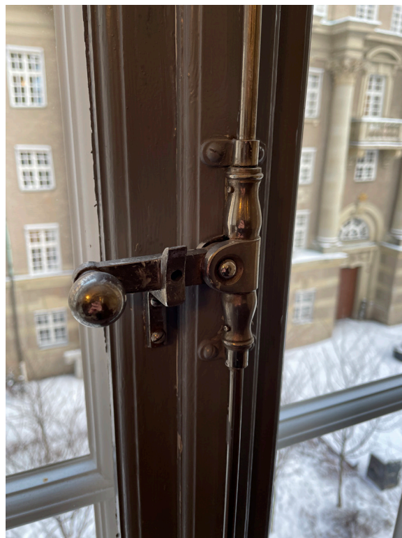
Fönsterbeslag, spanjolett, ursprungliga.