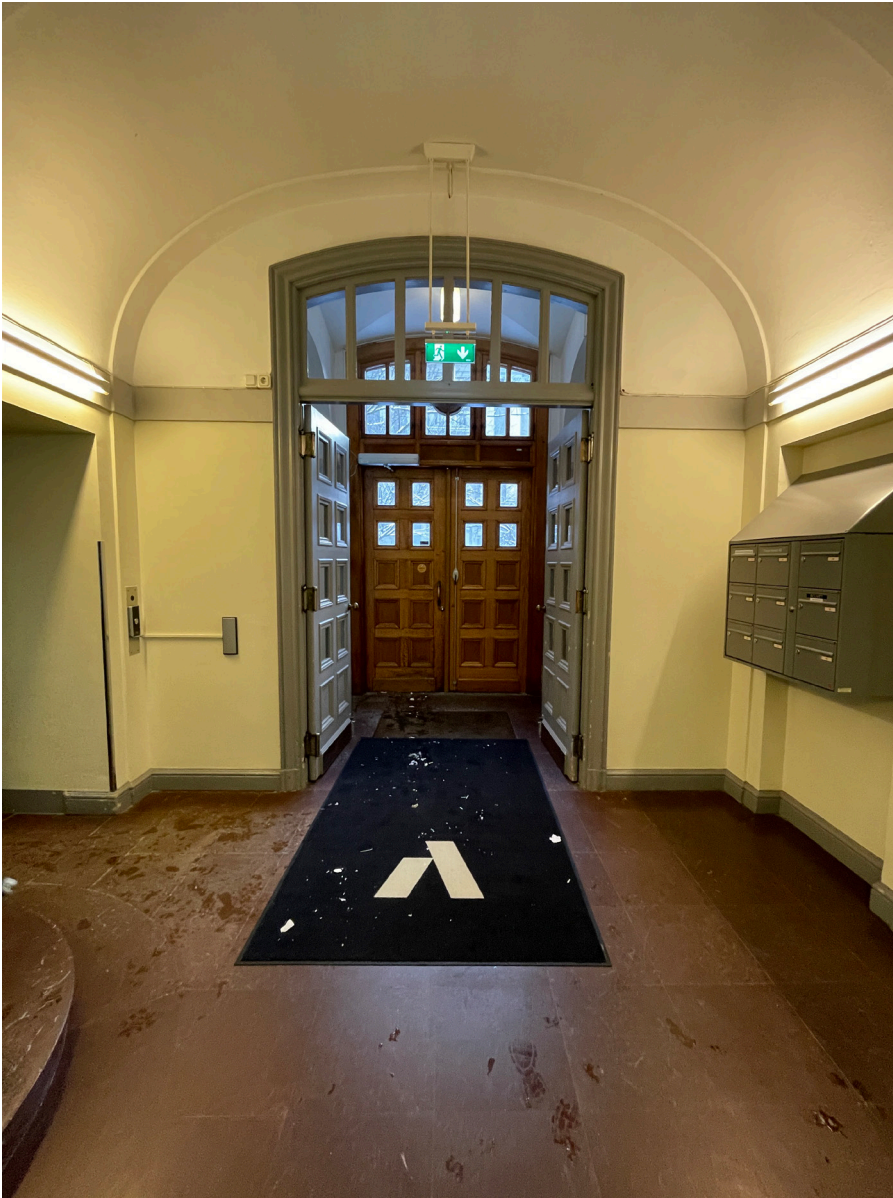
Entréhall med strikt och sober karaktär.

Efter den stora renoveringen 1999–2003, har byggnaden inte genomgått några större förändringar. Våningsplanen har en ljus färgsättning, med vita väggar, ekparkettgolv och vitmålat tak. Vindsvåningen har en modernare kontorslösning med flyttbara systemväggar i glas och aluminium. På vissa våningsplan har vissa hyresgäst Anpassningar gjorts efter verksamhetens behov..