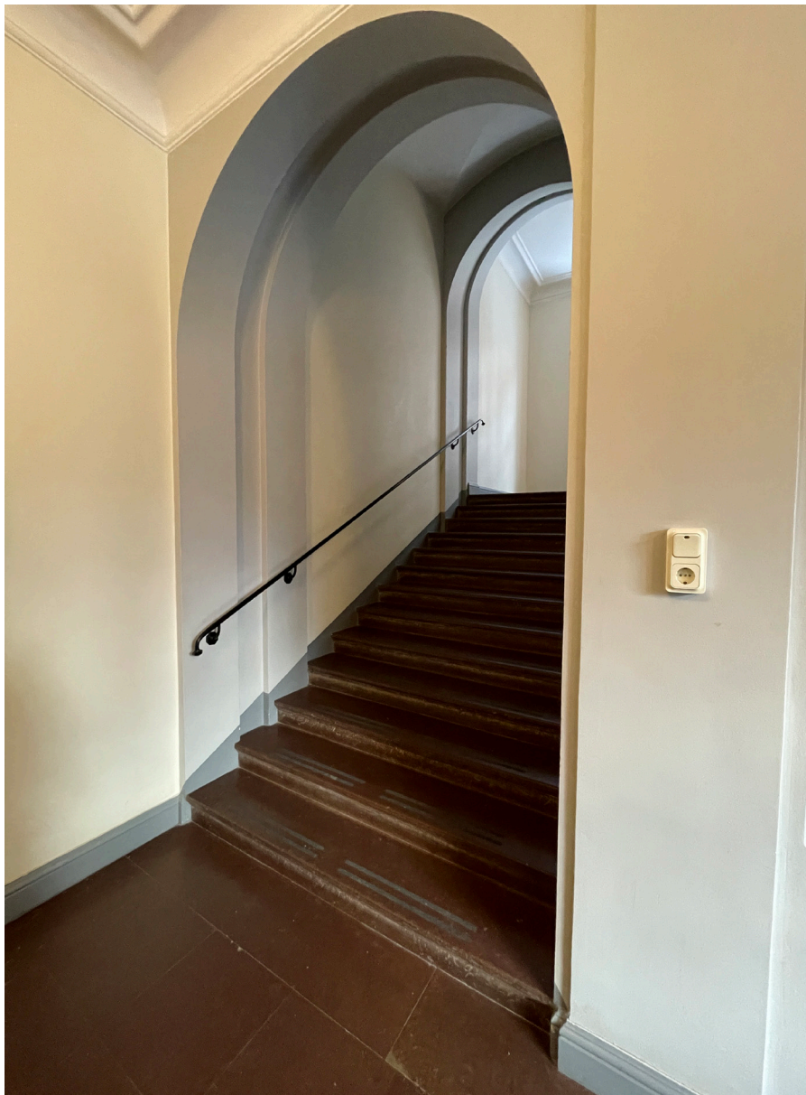
Traphall med rundbågade öppningar under en kraftig taklist.