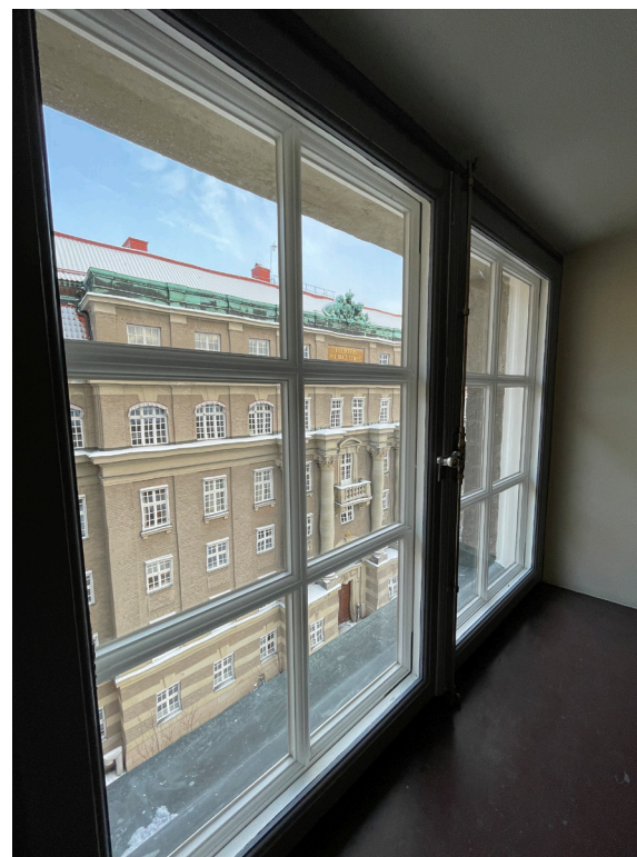
Fönster med munblåst fönsterglas i innerbågen.