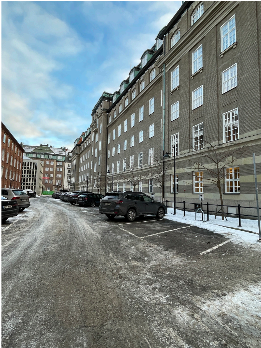
"Löjtnantsgatan" - i västra delen finns en trädrad.