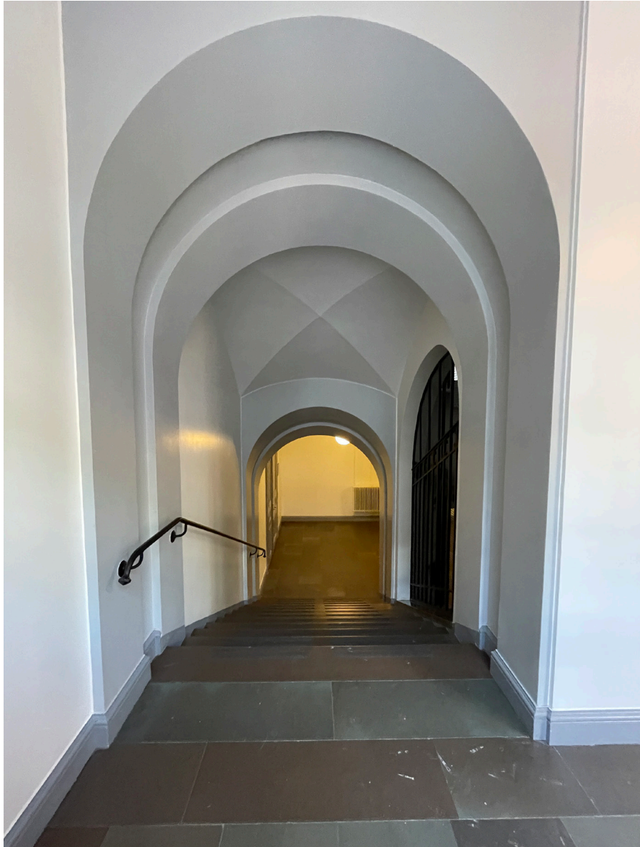
Trapphall med liknande karaktär som i systertrapphuset.