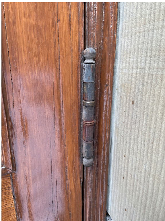
Gångjärn, entréport, ursprungligt.