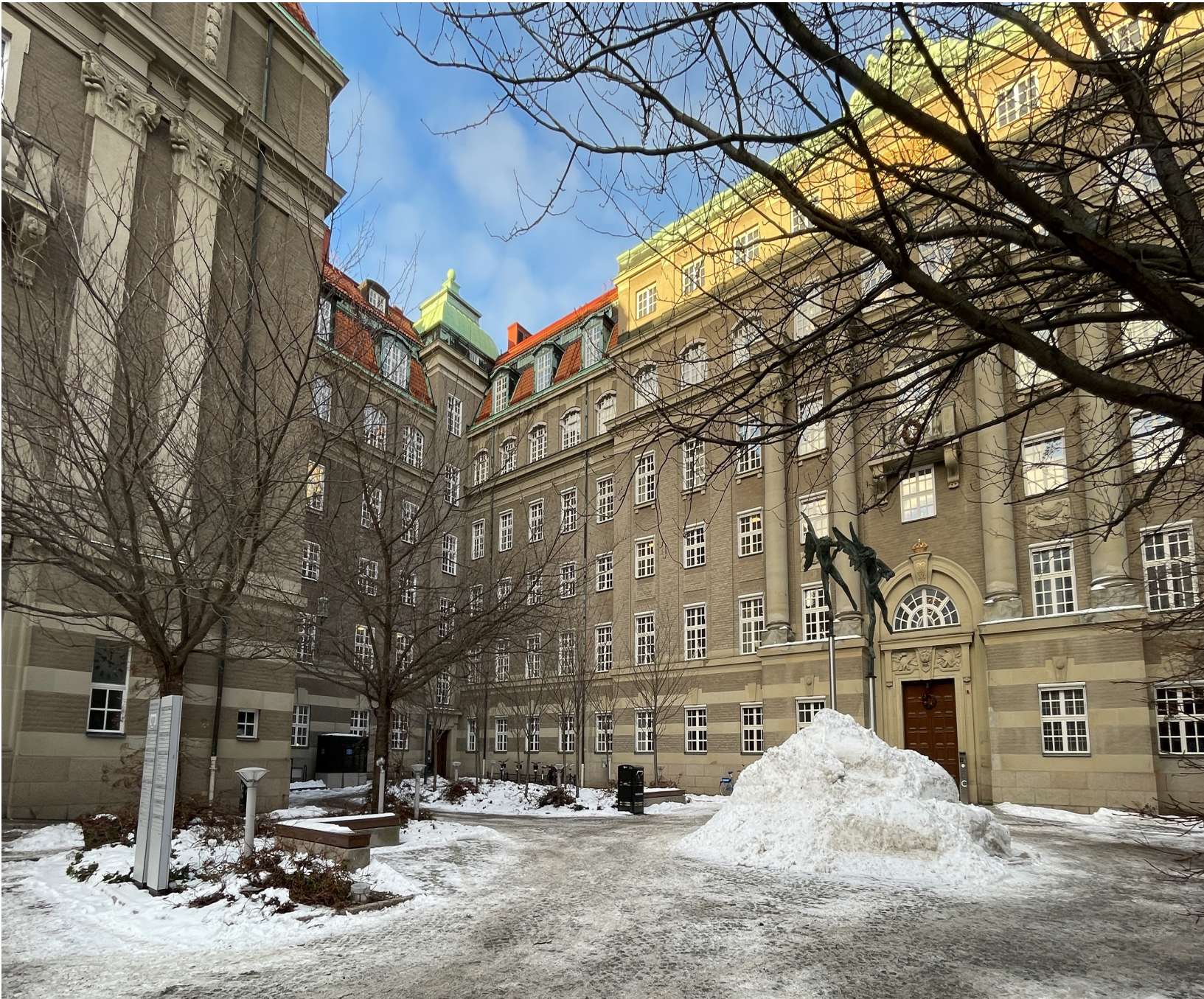
Innergård med trädplantering, mitt framför huvudentrén finns en skulptur föreställande två änglar.