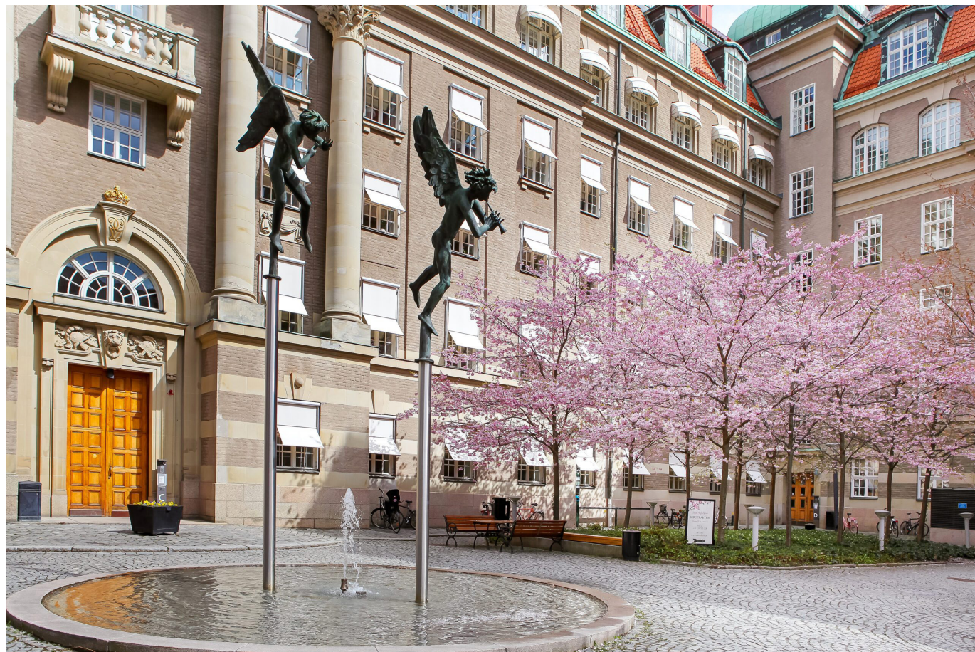
Fontän och körsbärsträd. Vasakronan.