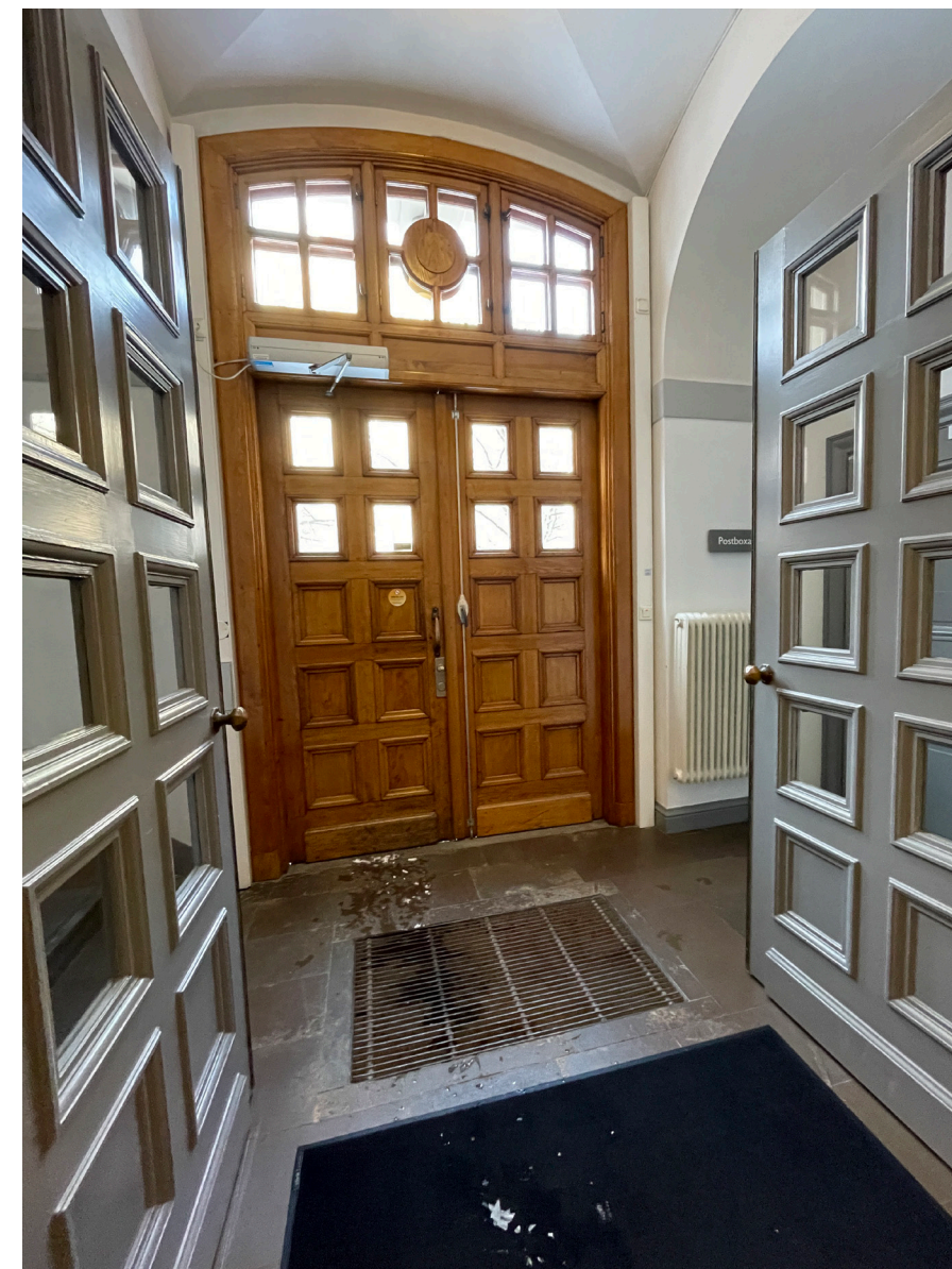
Entréport och vindfångsdörrar som harmonierar i utformningen.