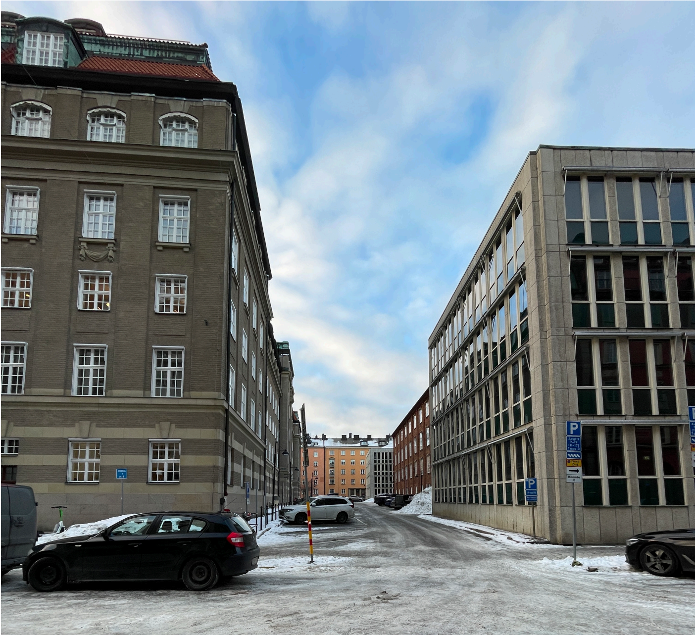
”Löjtnantsgatan” - närmast fasaden grönska, järnräcke och parkeringsytor.