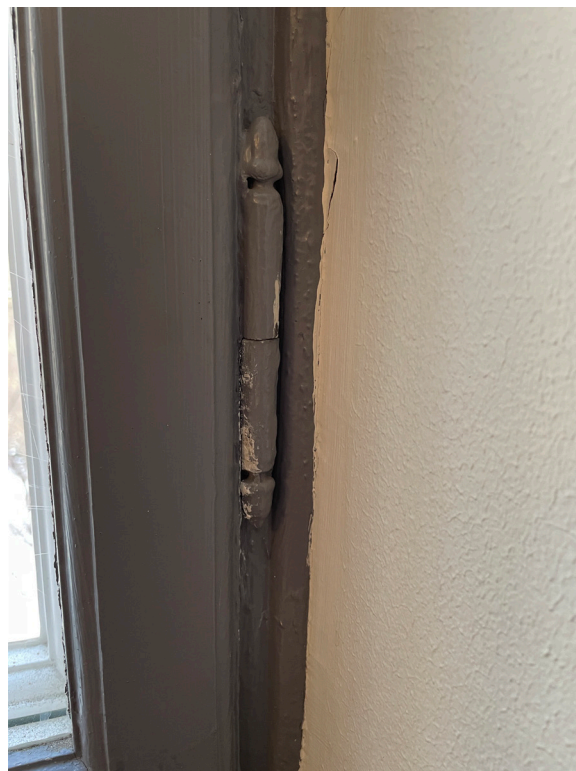
Gångjärn, fönster, ursprungligt.