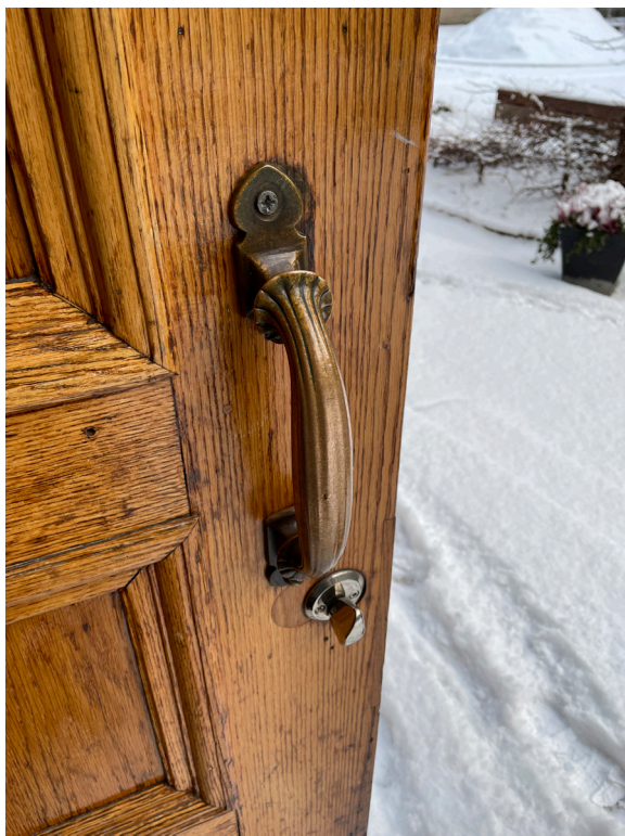
Dörrtrycke, entréport, ursprungligt.