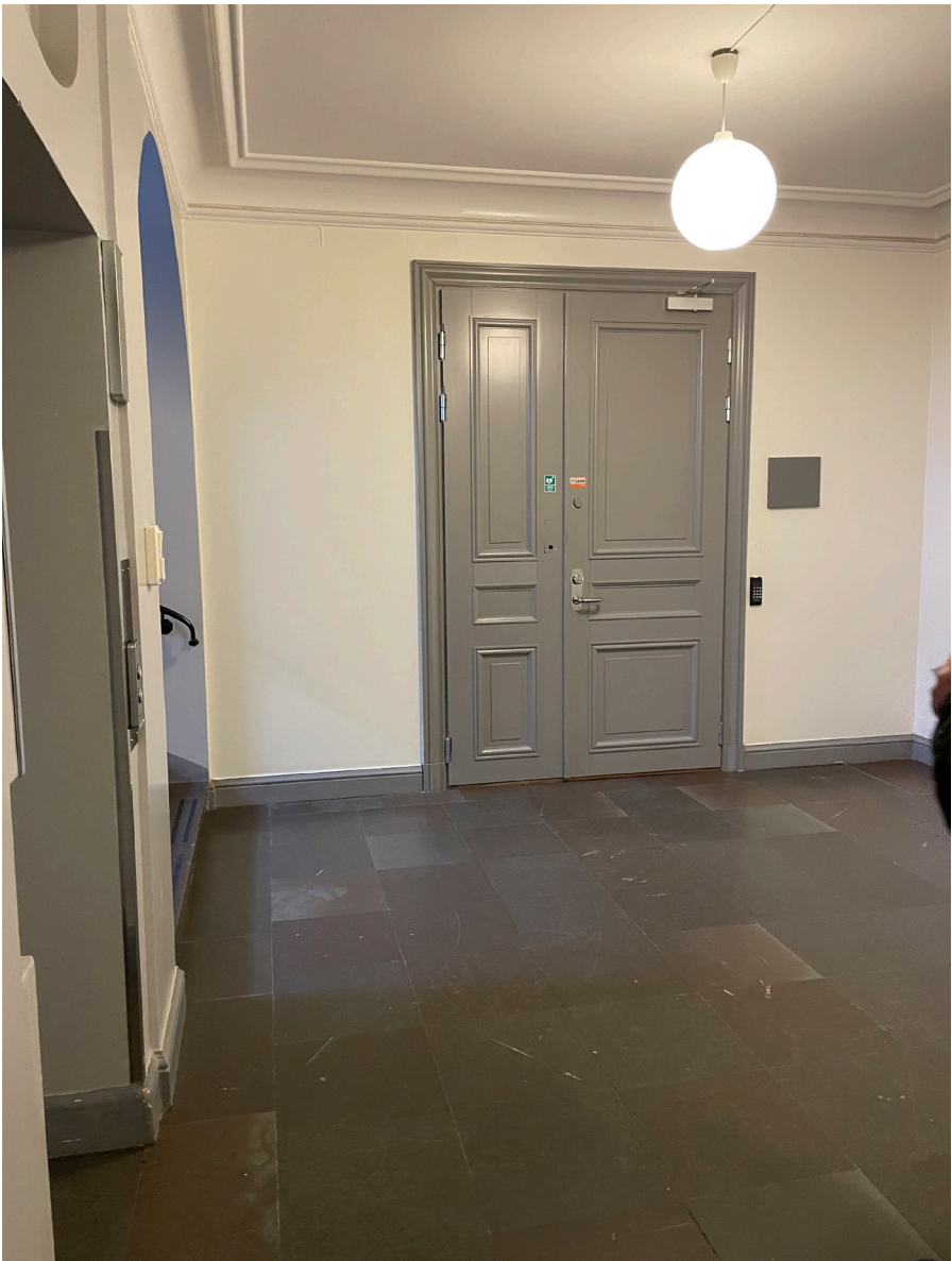
Trapphallarna är rymliga men strama och utan tecken från den militära epoken. Dörr till lokal är i sentida utförande.