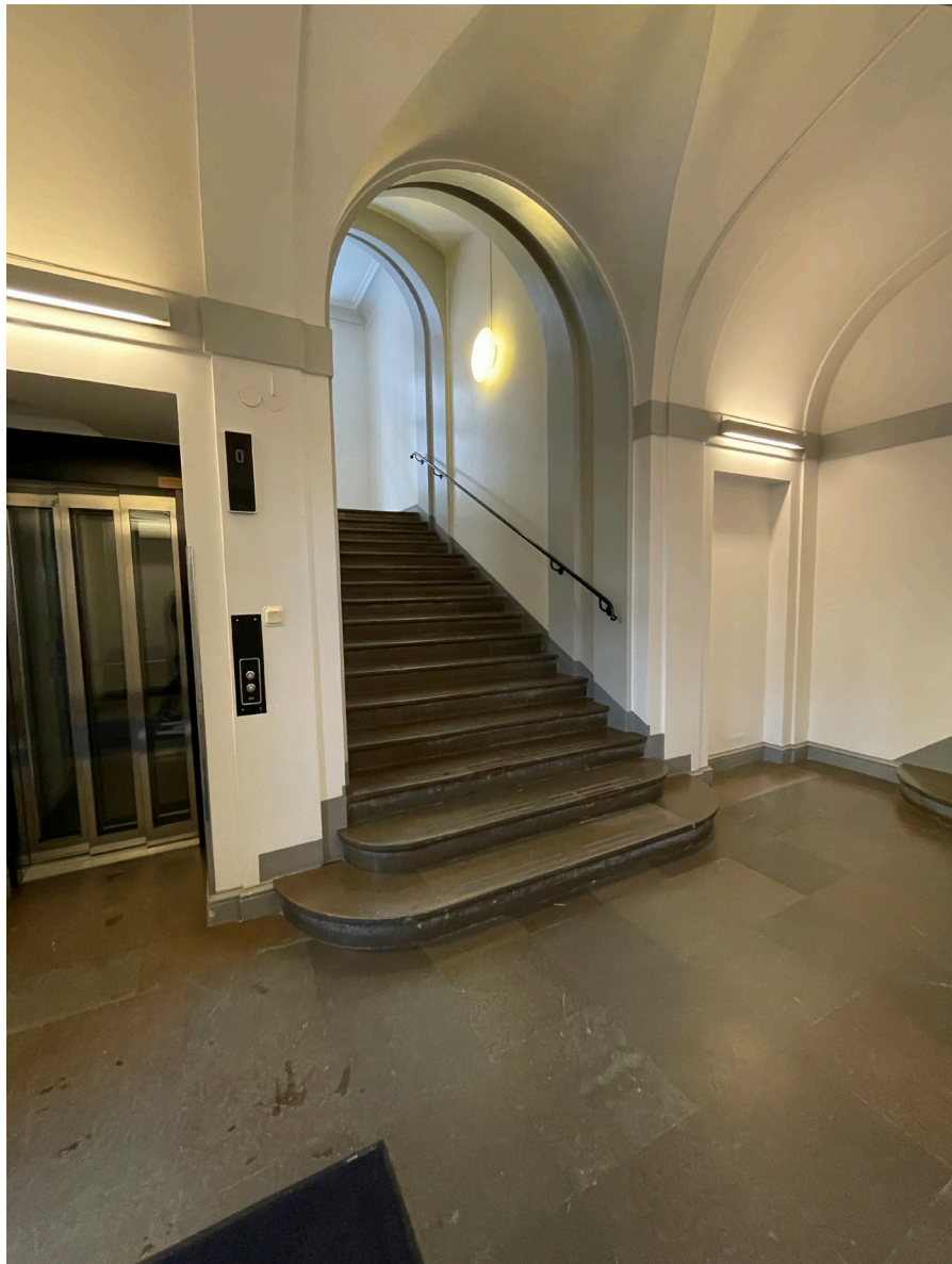
Entréhall. I denna flygel är inte kalkstengolvet rött utan istället i skiftande nyanser.