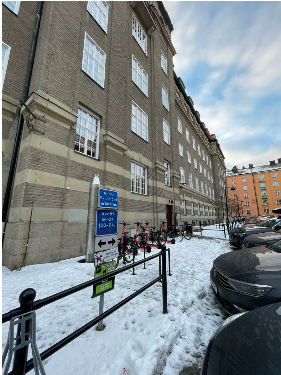
"Löjtnantsgatan" - cykelställ invid entréporten. Räcket är till största delen sen-tida.