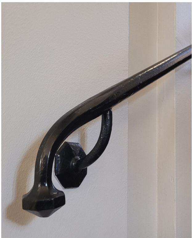
Smideshandledarna i trapporna är medvetet utformade för att ge ett hantverksmässigt och äldre intryck. Avslutet påminner om handeldvapen från 1600-talet.