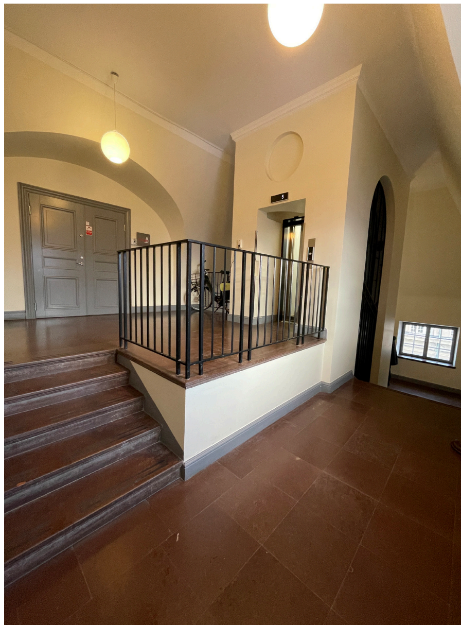
Trapphallen på översta planet. Dörr till hyresgästlokal är inte ursprunglig och hissorgen har bytts ut under 2000-talet.