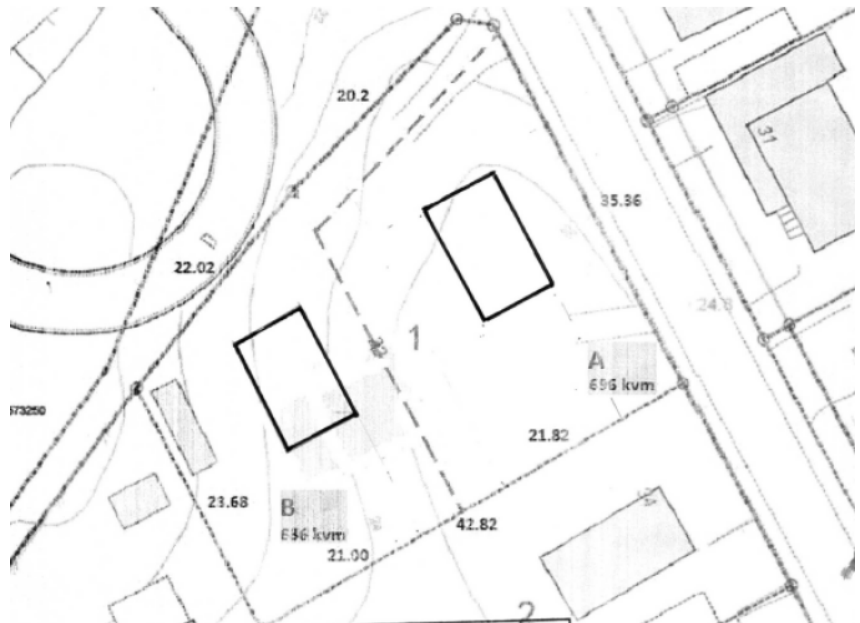
Situationsplan för en möjlig avstyckning med ungefärlig placering av tänkt bebyggelse. Från ärende om rivningslov, dnr 2021-16749.

Planförslaget innebär att gällande fastighetsindelningsbestämmelser upphävs inom planområdet. Åtgärden möjliggör att en ny fastighet för bostadsändamål på 600-742 kvadratmeter nybildas genom avstyckning. Fastigheten bedöms kunna få en lämplig utformning och uppfylla plan- och bygglagens krav på angöring och tillgänglighet. För hantering av dagvatten i samband med nybyggnation hänvisas till Stockholms stads dagvattenstrategi och riktlinjer för dagvattenhantering. Stadens riktlinjer för avfallshantering ska också följas.