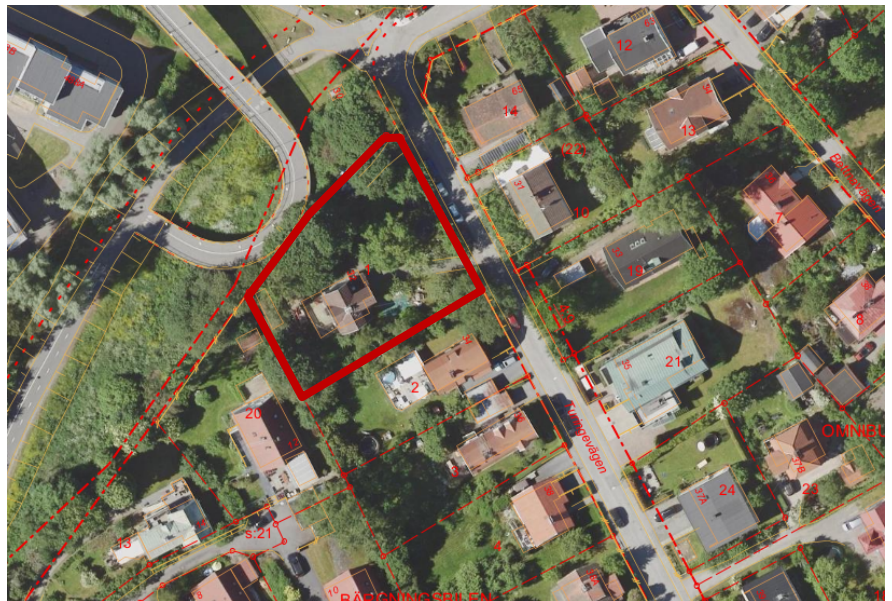
Fastigheten Bärningsbilen 1 markerad med röd linje.