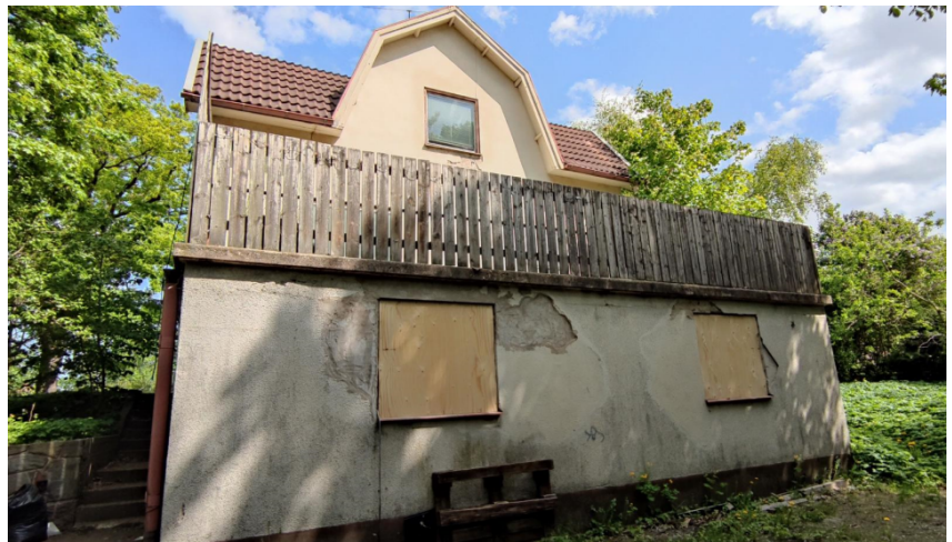
Befintlig byggnad är i dåligt skick.