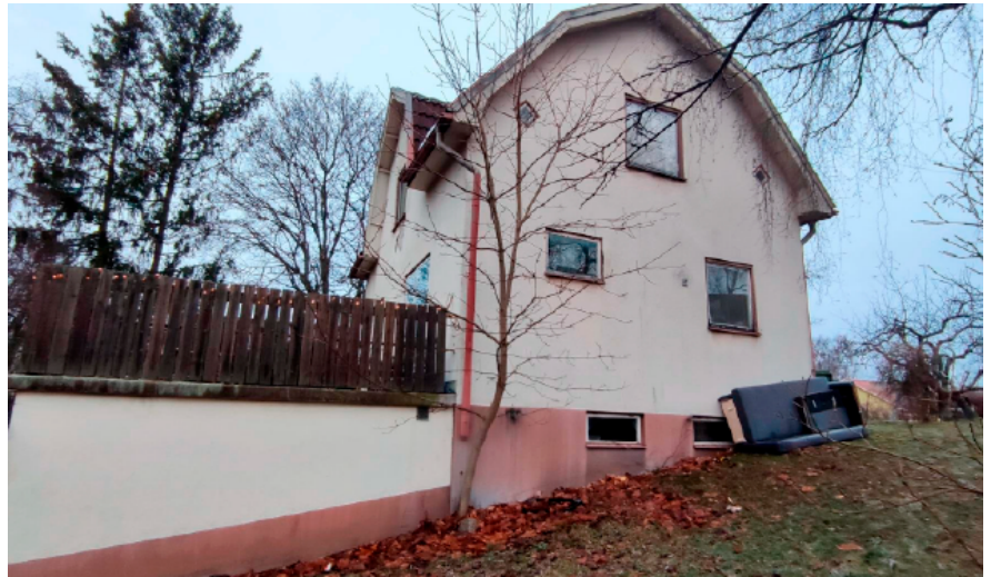
Befintlig byggnad. Bild från ärende om rivningslov dnr 2021-16749