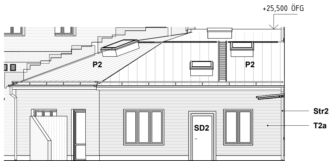
Gårdshus fasad mot öster