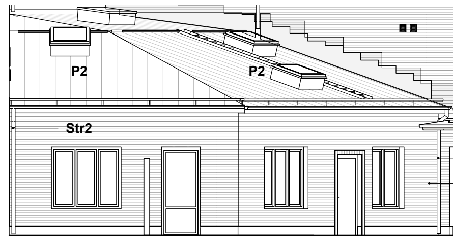
Gårdshus fasad mot sydöst