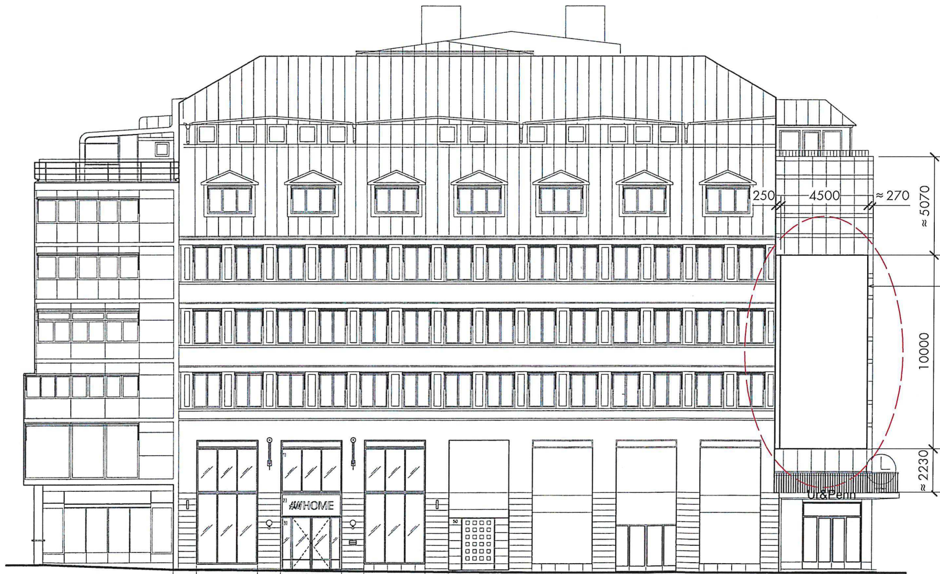
FASAD MOT DROTTNINGGATAN 1 : 200