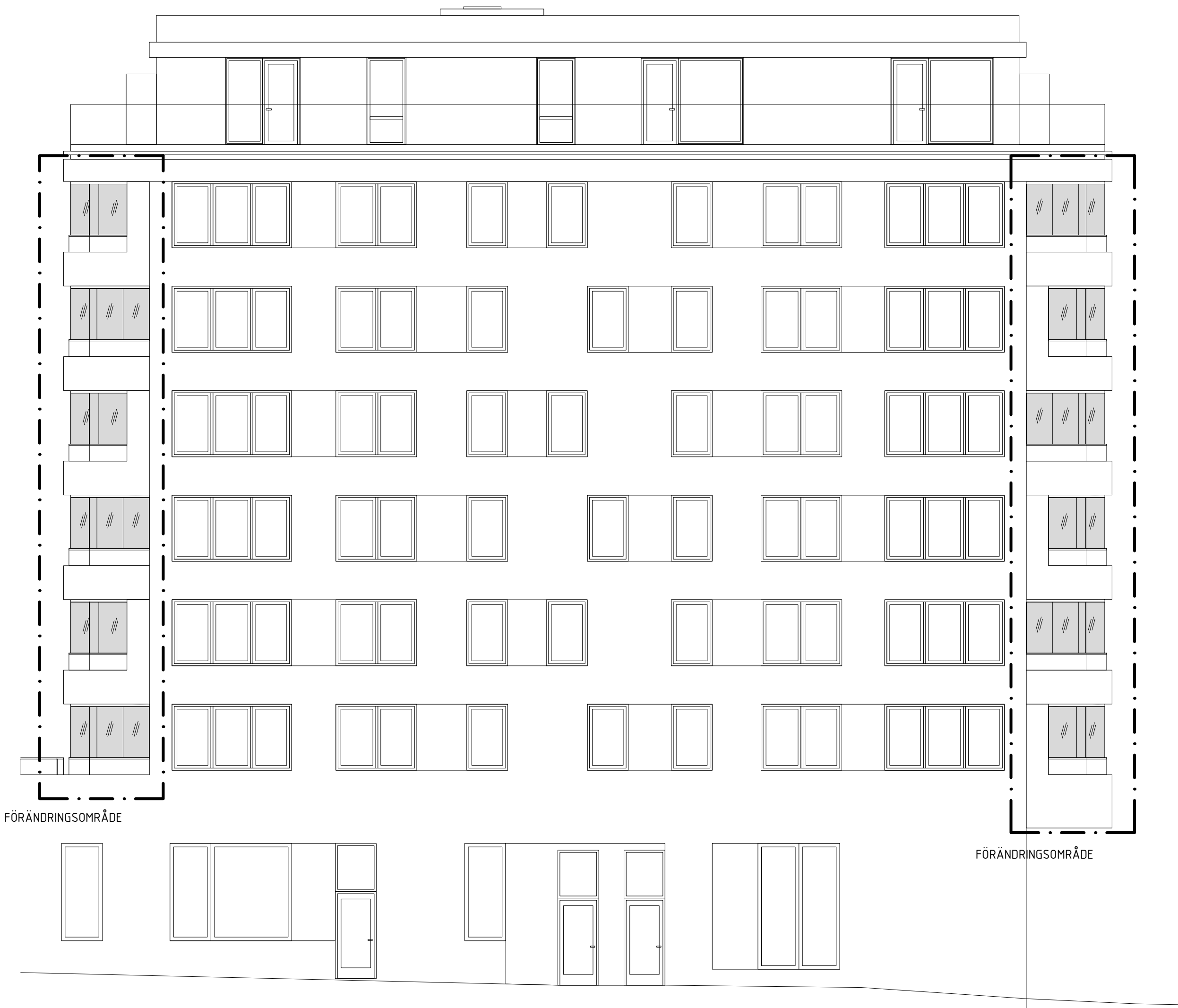
Fasad mot Öster T2