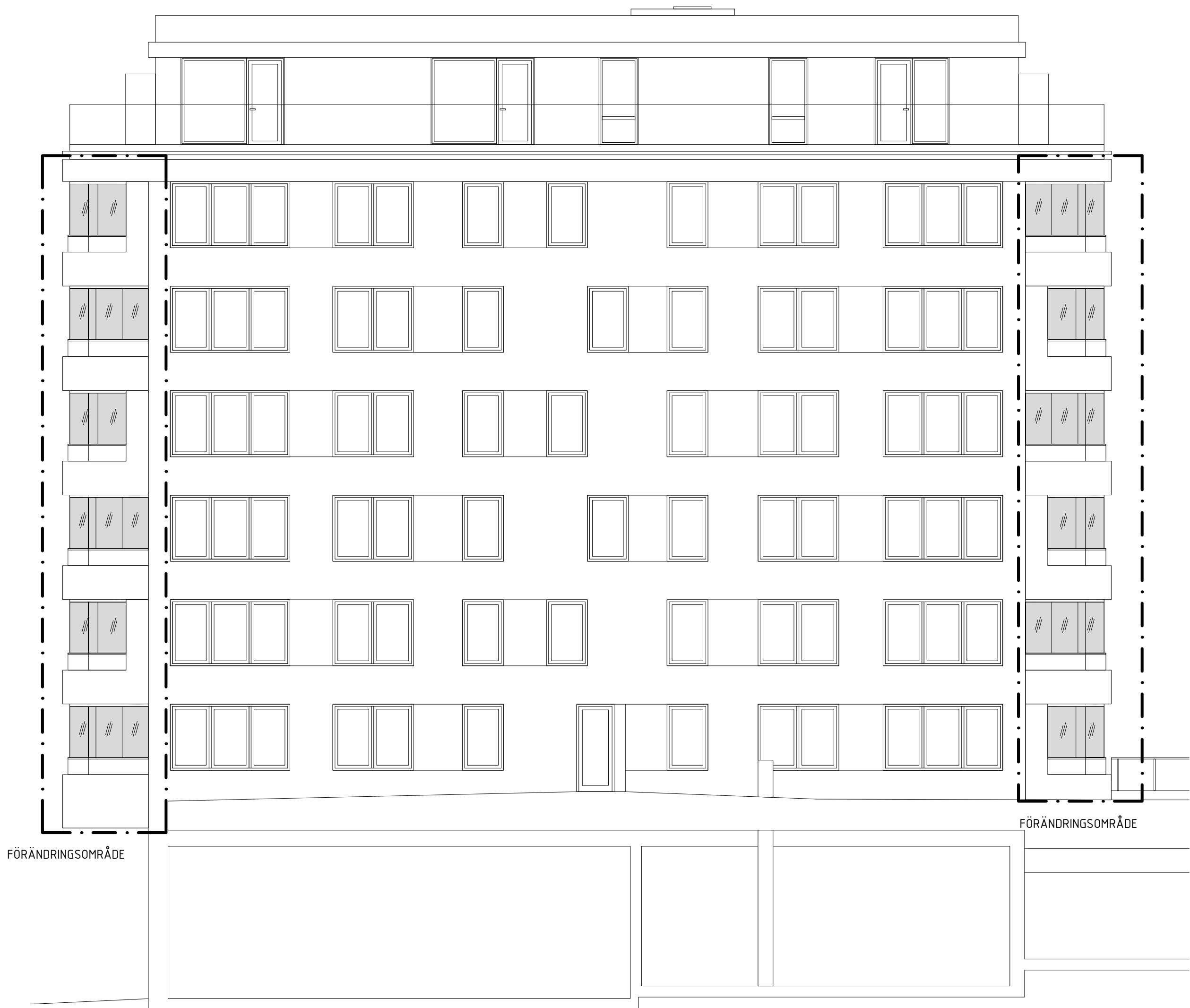
Fasad mot Väster T2