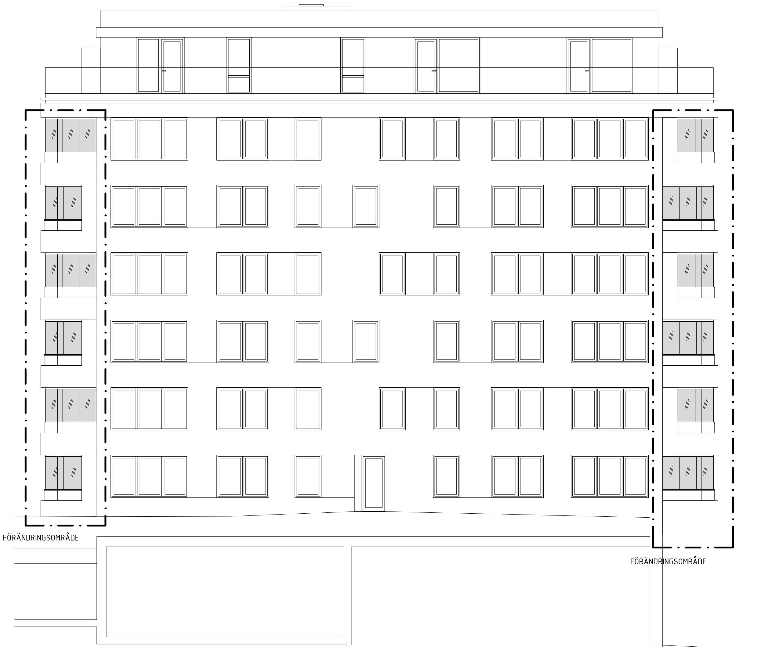
Fasad mot Öster T1