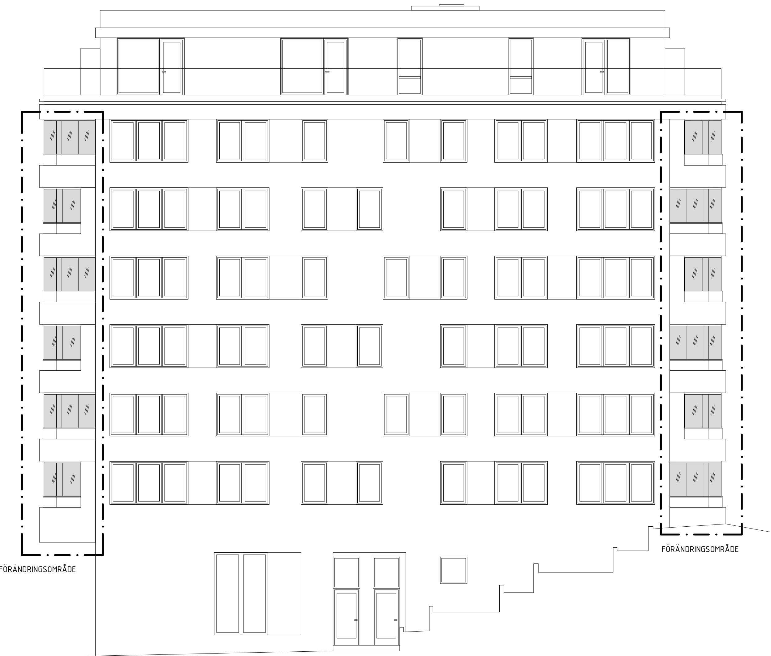
Fasad mot Väster T1