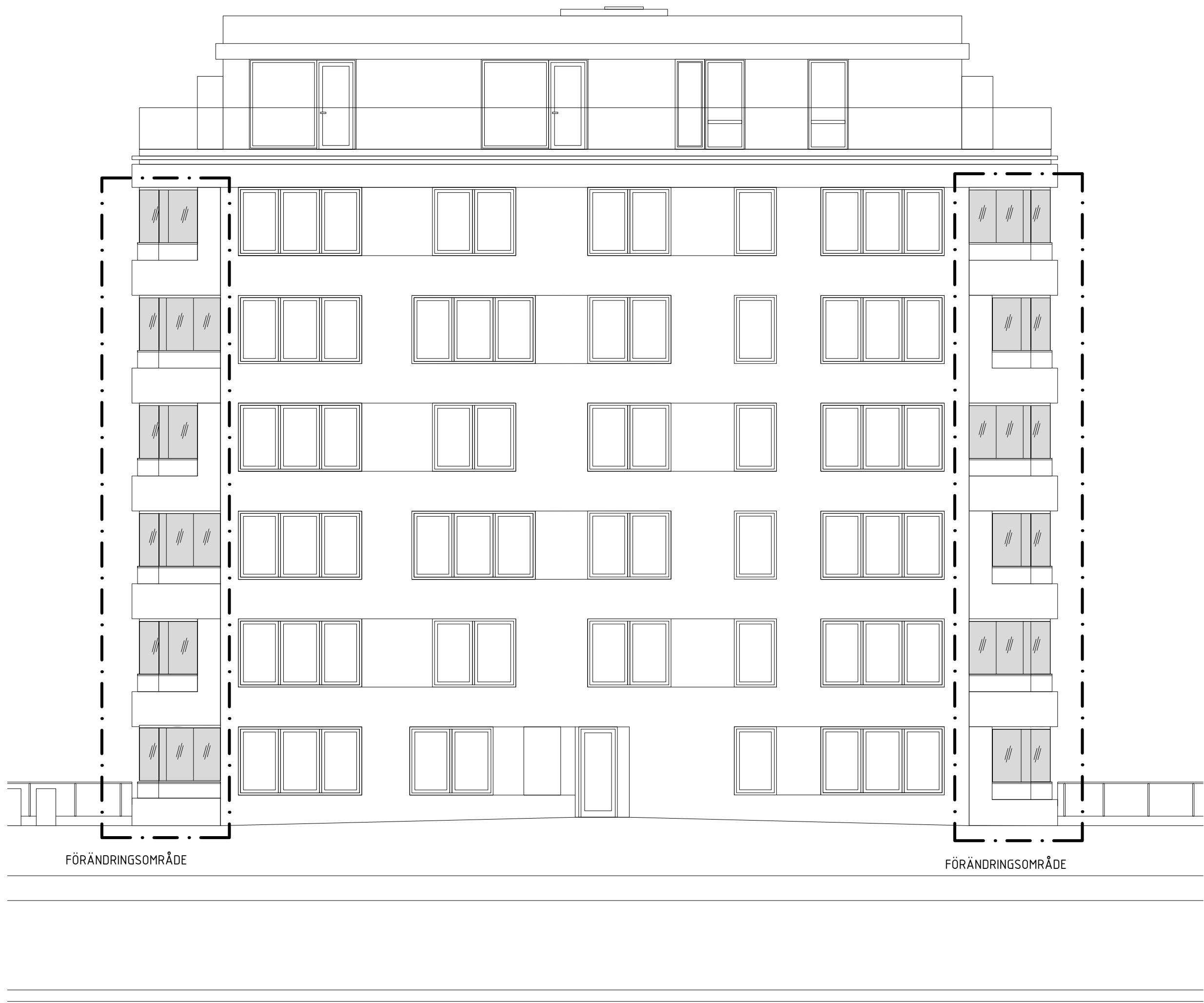
Fasad mot Väster T4