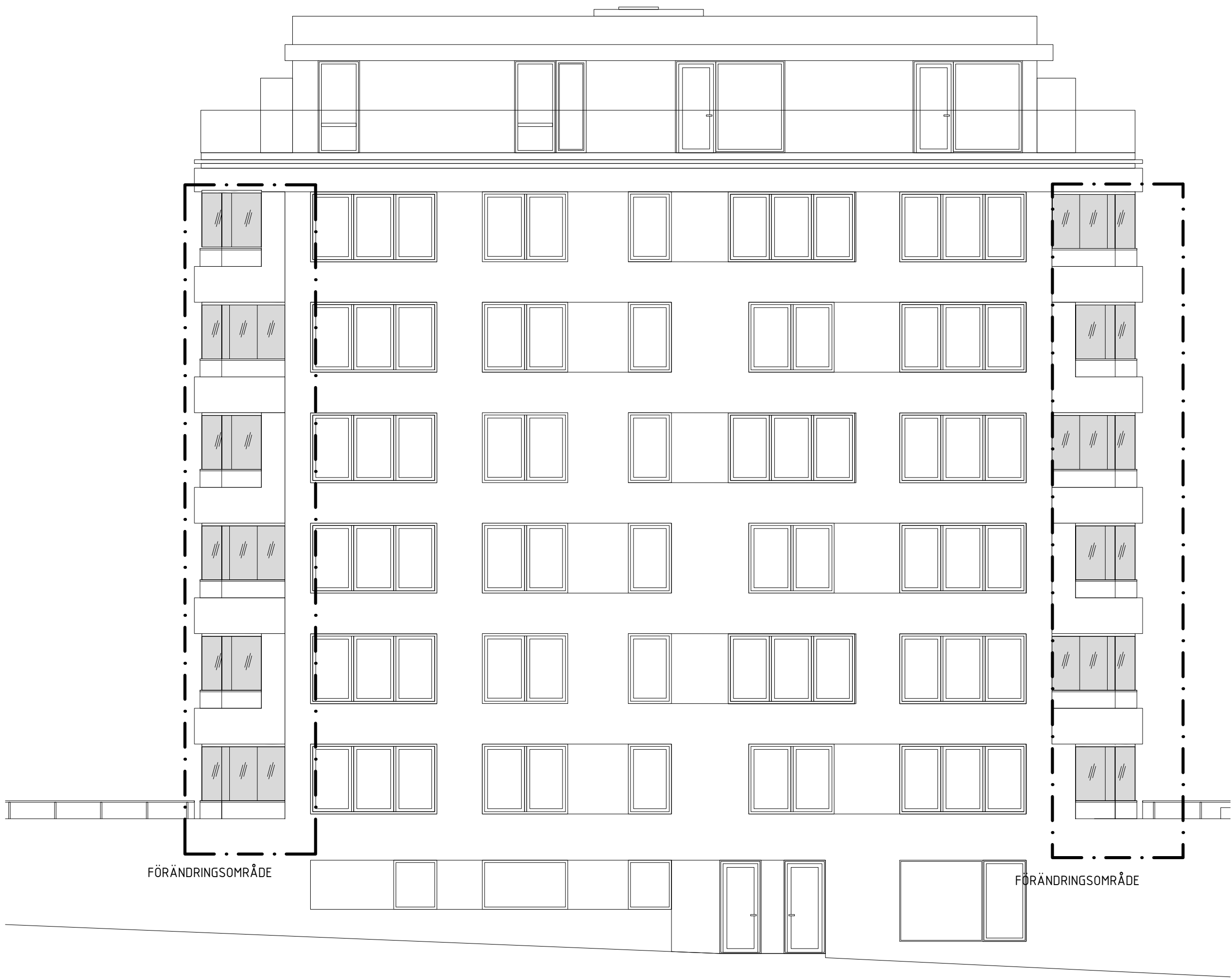
Fasad mot Öster T4