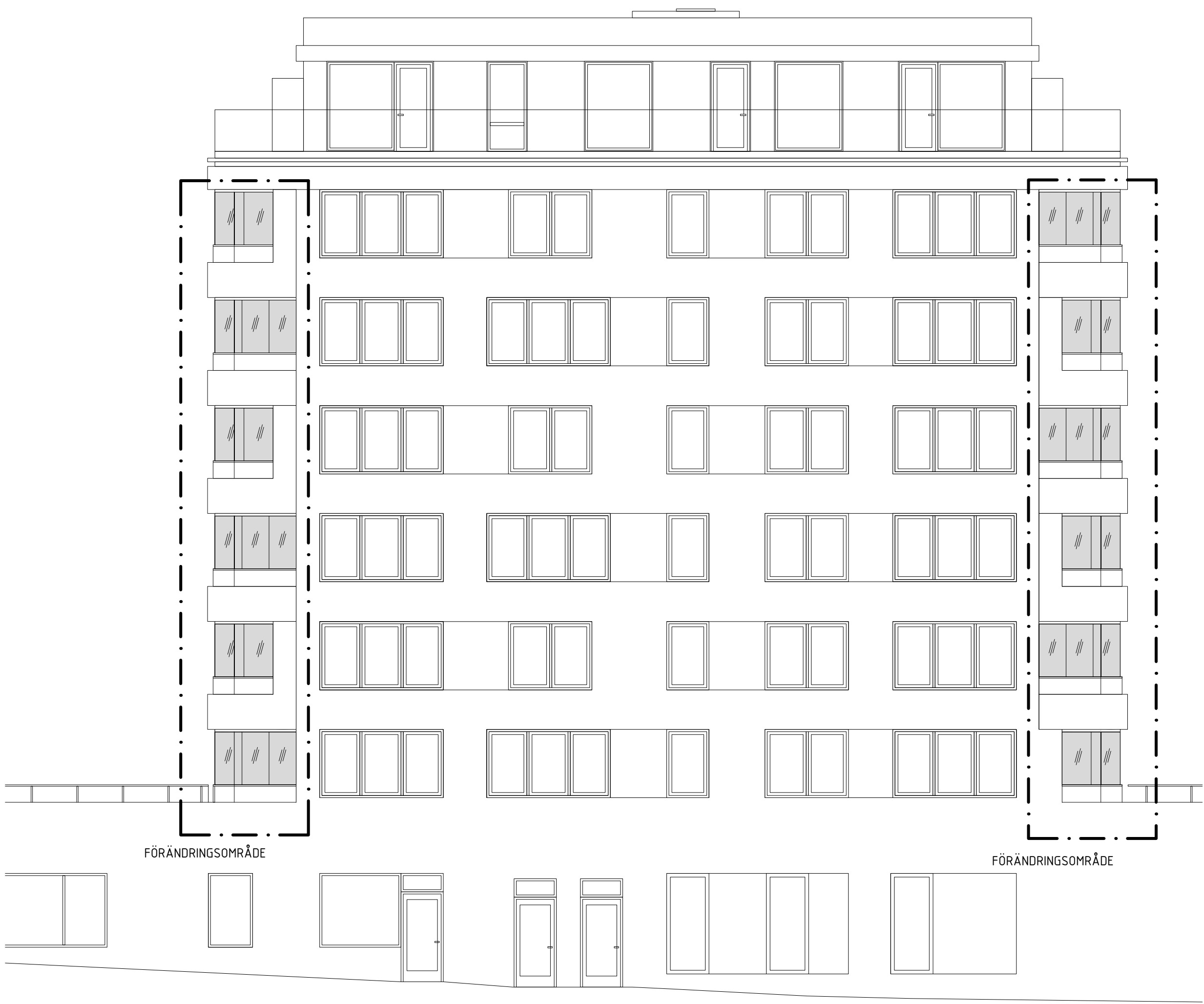
Fasad mot Öster T3