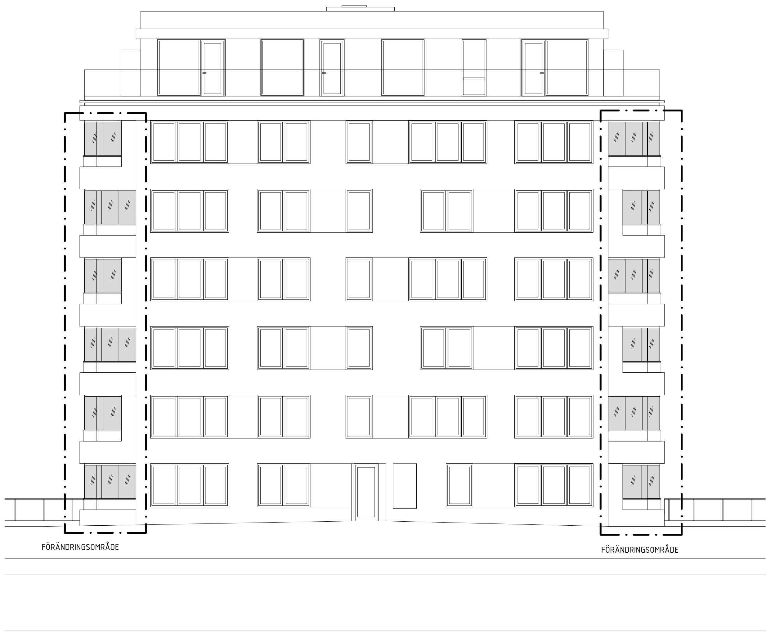
Fasad mot Väster T3