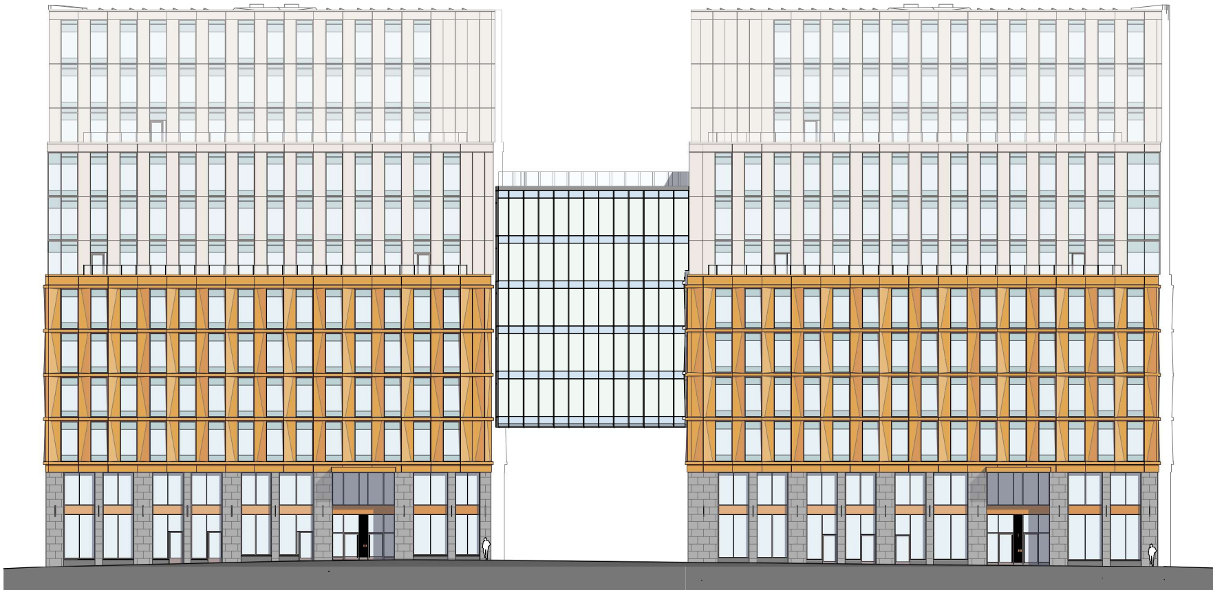
MOT NORDVÄST, EUGENIAVÄGEN