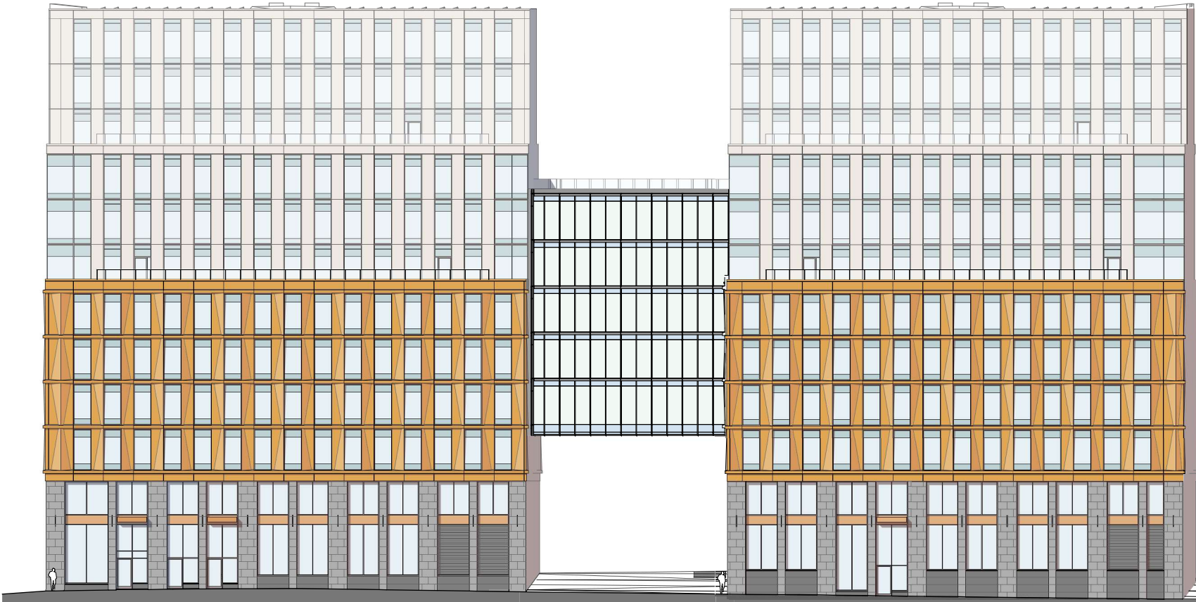
MOT SYDOST, JOHANNA HEDÉNS GATA