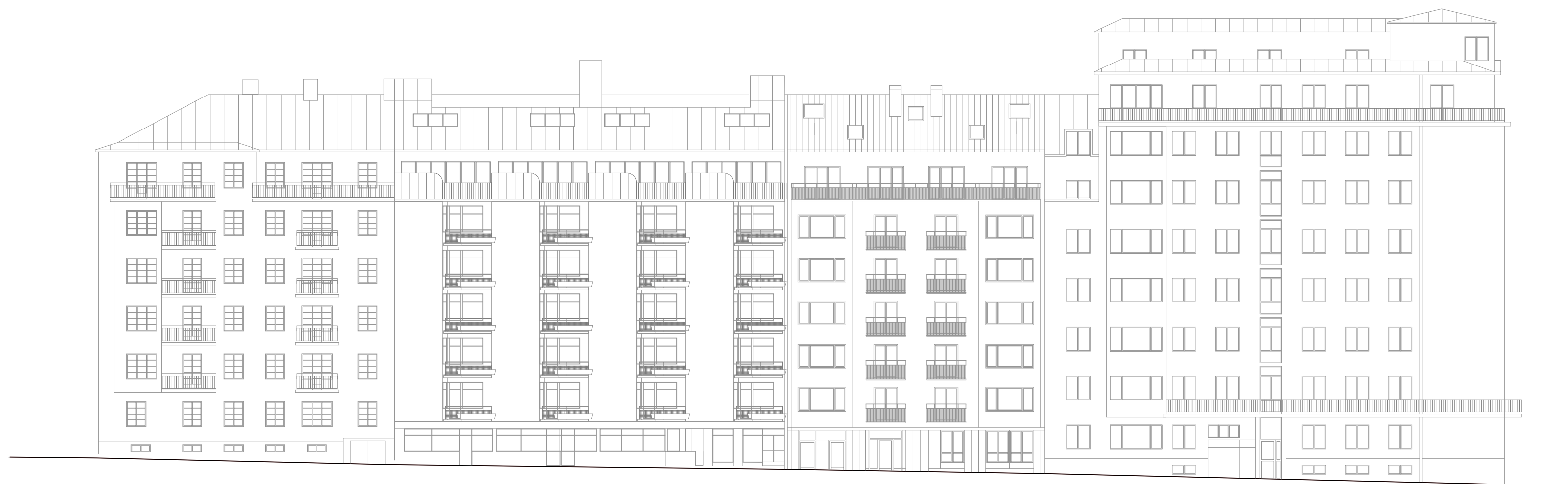
FASAD JOHN ERICSSONSGATAN MED OMGIVNING

Utvändig material - och kulörbeskrivning